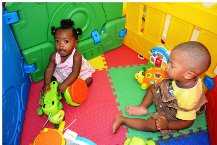
La sala de estimulación temprana funciona todos los días de lunes a viernes.

En todo el país Visión Mundial ha instalado 13 centros de estimulación temprana, a través de los cuales atiende a mil 557 niños y niñas de entre cero y cinco años de edad en más de 40 comunidades vulnerables, en distintas provincias. Esta estrategia comparte propósitos con la iniciativa gubernamental “Quisqueya empieza contigo”, un plan nacional para la protección de la niñez presentado el pasado 16 de abril por el presidente de la República, Danilo Medina.