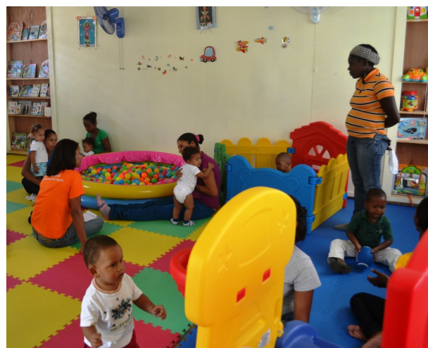
Vista del centro.

Reveló además que en el período presidencial 2012-2016, el gobierno capacitará a 47 mil cuidadores y cuidadoras de niños y niñas, y formará a 475 mil 940 familias en la crianza y promoción de buenos tratos a la niñez.