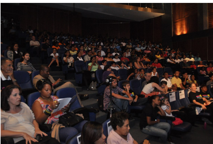
Público que asistió al lanzamiento de la campaña en el país.

Transmundial, la Fundación Espiga, Boaw Pictures Dominicana, la Red Reformando, el Teatro Alternativo Lorena Oliva y el Movimiento Nacional Infanto Juvenil Protagonistas.