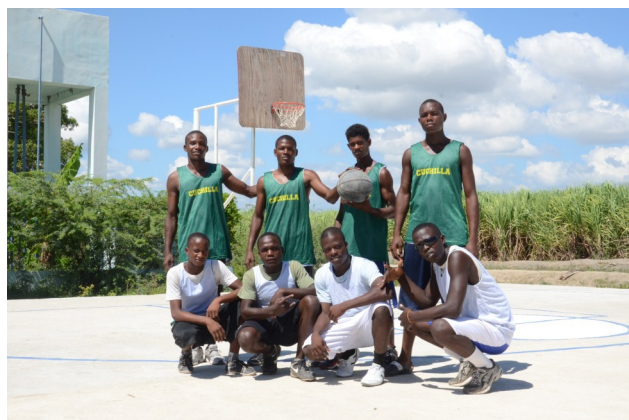
Batey Cuchilla dispone de una cancha de baloncesto para los niños, niñas, adolescentes y jóvenes que deseen aprender y practicar este deporte.