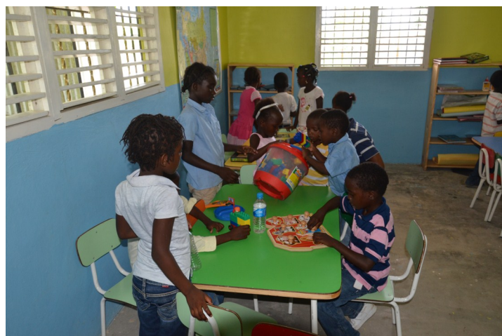
En batey Cuchilla funciona un Espacio De Aprendizaje Divertido (EDAD), en donde los niños se educan, desarrollan y ponen en práctica nuevos conocimientos.