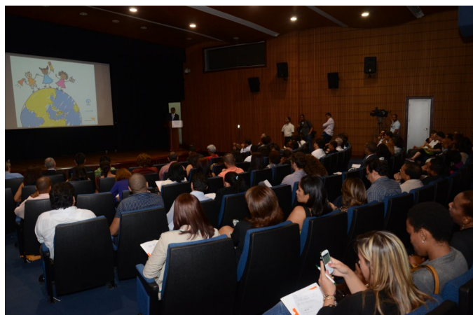
La asistencia fue concurrida al acto de premiación.