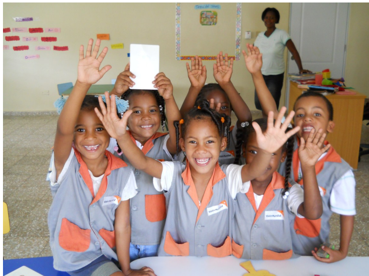
Niños y niñas del Programa de Desarrollo de Área (PDA) Canaán, de Villa Mella.