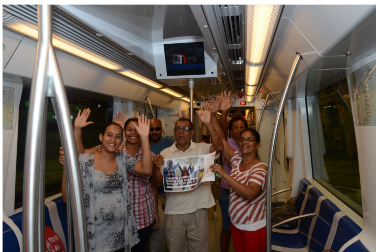
Viajeros de la línea 1 del metro de Santo Domingo, también elevaron sus manos.