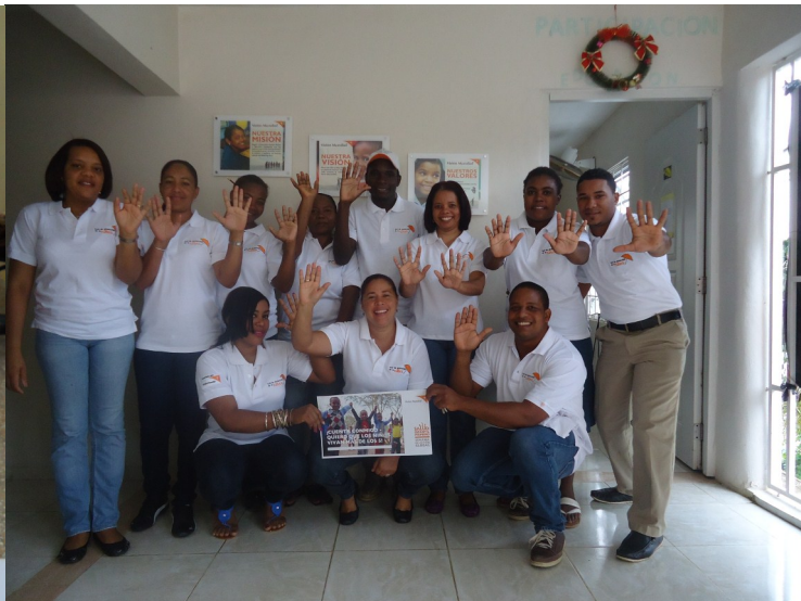
Empleados/as del Programa de Desarrollo de Área (PDA) Miches.