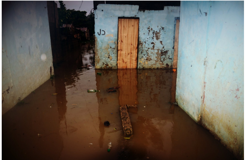
Las torrenciales lluvias provocaron el desbordamiento del río Isabela, inundando sectores de Santo Domingo Norte.

para la educación de las personas desplazadas, a través de charlas sobre protección infantil, prevención de enfermedades, control e higiene, manipulación adecuada de alimentos.