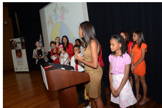
Los niños y niñas de Radio Seybo ganaron la categoría Radio del Concurso.

40 comunicadores y fotorreporteros participaron en el VIII Concurso Periodístico sobre Temas de Niñez y Adolescencia