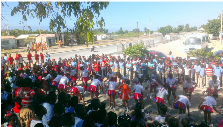
Actividades durante la marcha / Activities during the march.