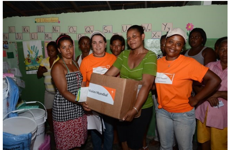
Entrega de kits de higiene y alimentos básicos a familias afectadas por el huracán Isaac, residentes en comunidades de intervención del PDA Pino.