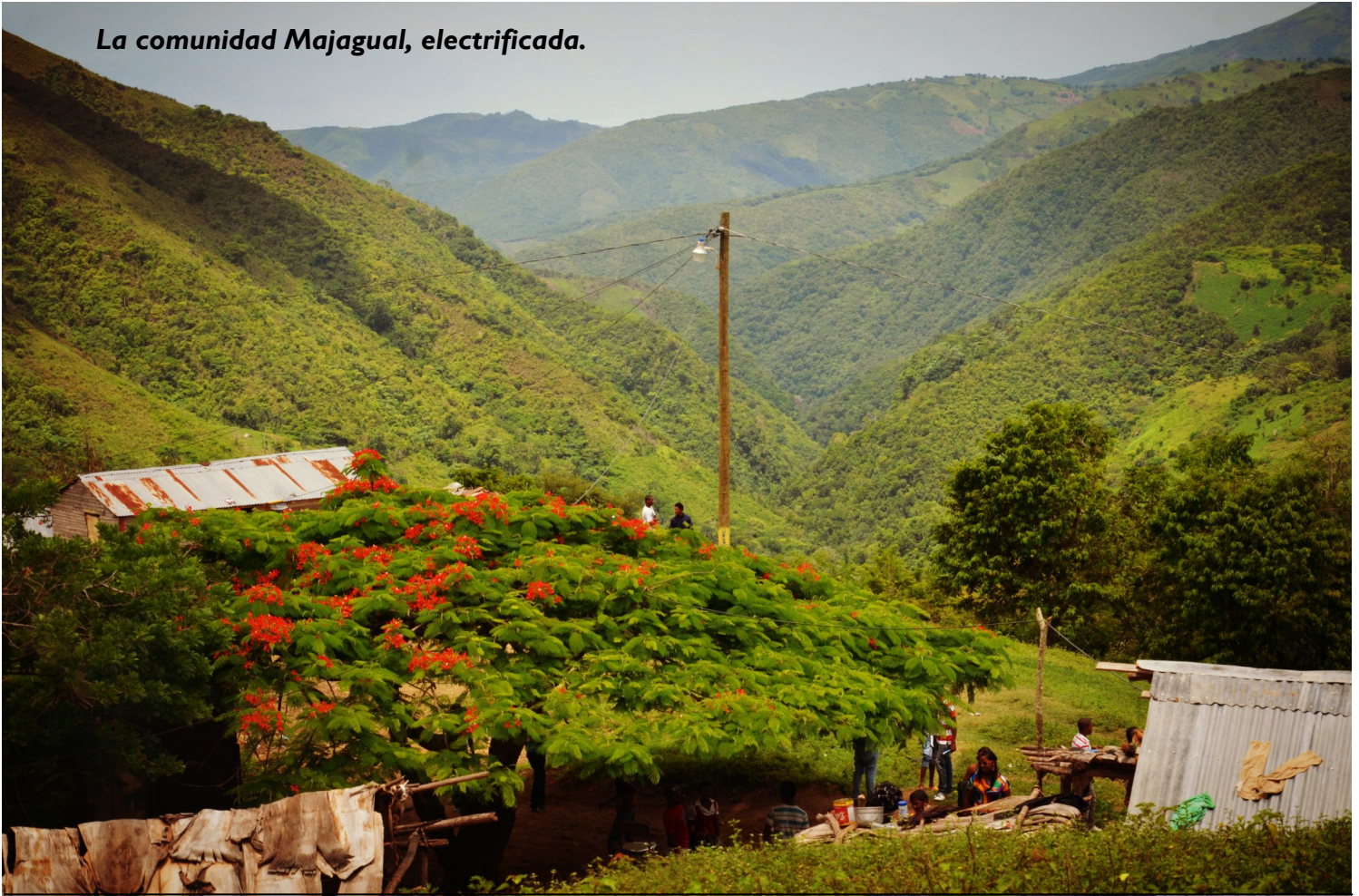
La comunidad Majagual, electrificada.