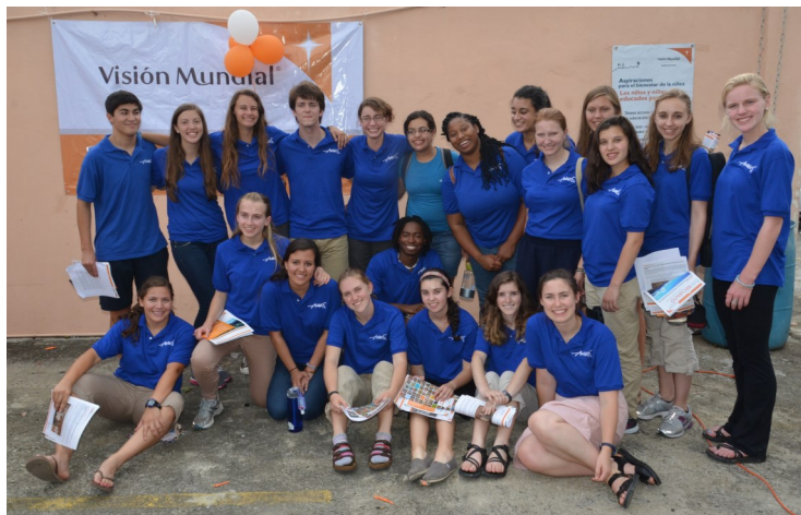
Voluntarios de AMIGOS, en el momento de su llegada a Dajabón.

Visión Mundial es una organización internacional cristiana, de ayuda humanitaria, dedicada a trabajar con niños, niñas, sus familias y comunidades, para superponerse de la pobreza e injusticia.