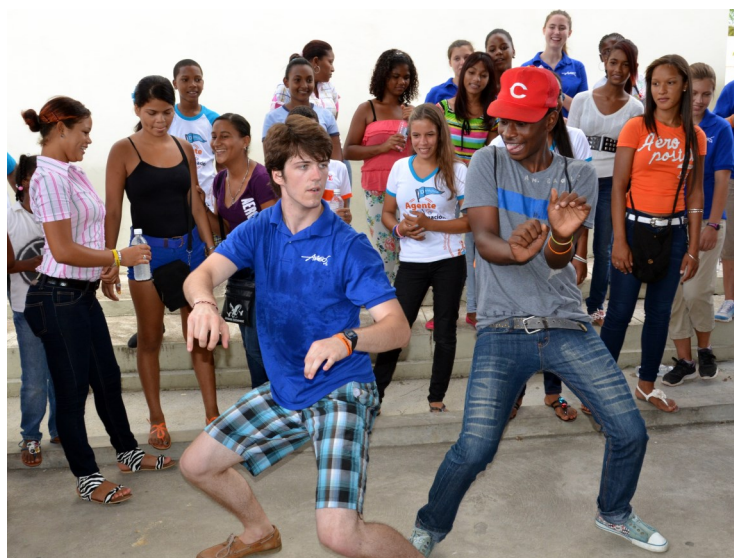
Actividad recreativa, en uno de los talleres de liderazgo.