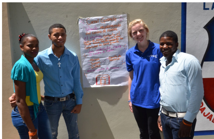
Presentación del micro-proyecto de la comunidad Corral Grande.