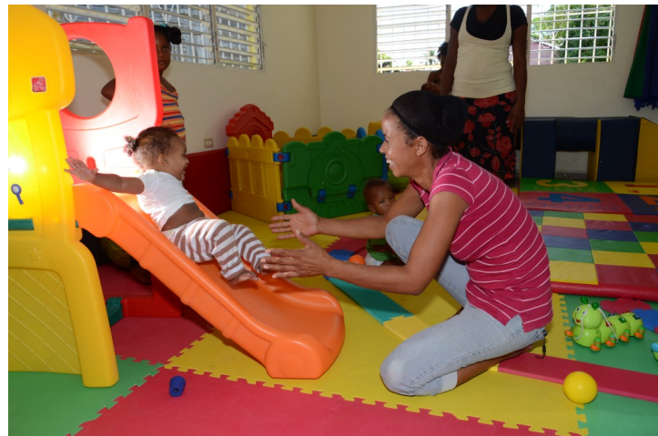
Centro de estimulación temprana de Visión Mundial, en el distrito municipal Fundación, provincia Barahona.

El referido módulo va dirigido a personas no profesionales que trabajan en el nivel de educación inicial, con el fin de habilitarlos para trabajar con la primera infancia.