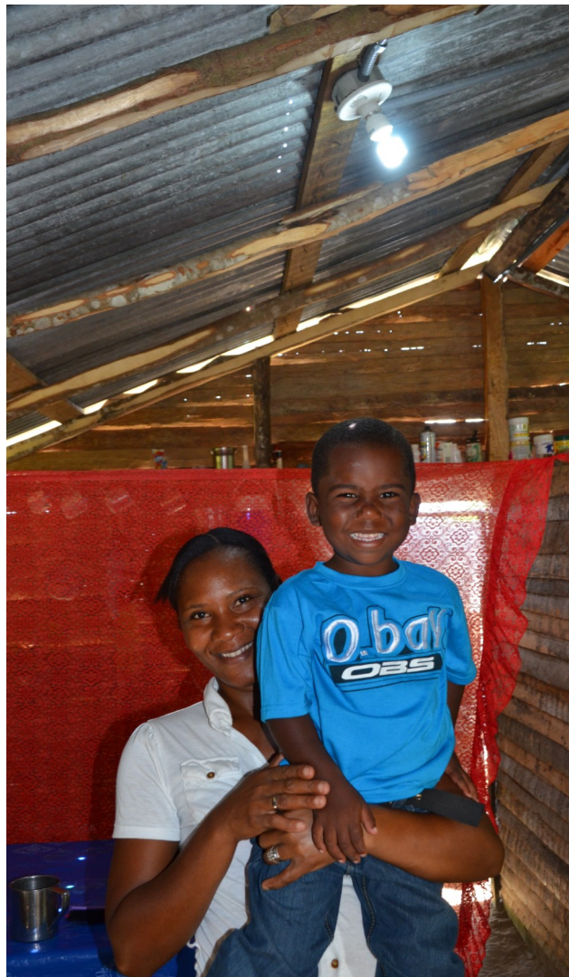
Una de las familias beneficiadas con la construcción de la micro-hidroeléctrica.

Esta iniciativa busca contribuir al desarrollo de las zonas rurales de República Dominicana, a través de la electrificación sostenible, y el fomento de las energías renovables, en pos de la mejora de la calidad de vida de la población.