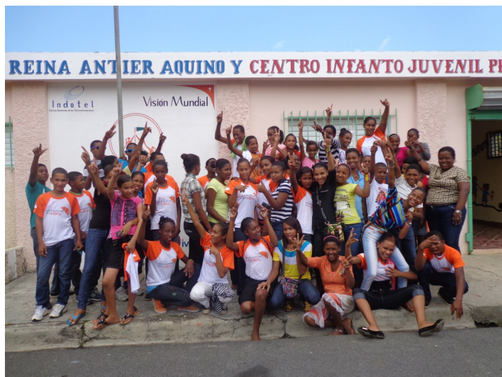
Algunos de los niños, niñas y adolescentes que fueron capacitados en liderazgo.

Miches, provincia El Seibo.- Al menos 160 niños, niñas y adolescentes del municipio Miches, provincia El Seibo, fueron capacitados en liderazgo, a través de un curso impartido por Visión Mundial en la referida localidad.