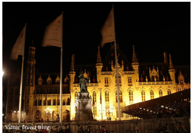
Victor Travel Blog