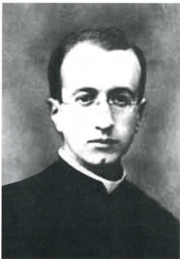
El sacerdote Manuel Larraín E., en 1935