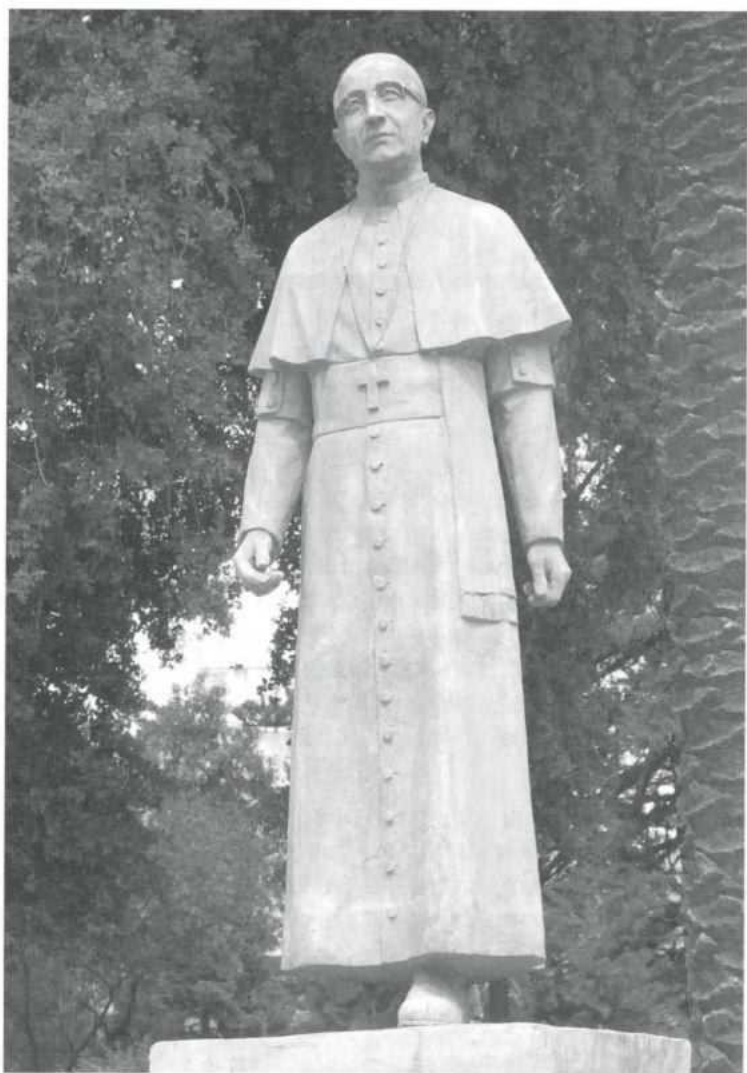
Estatua en la Plaza de Armas de Talca