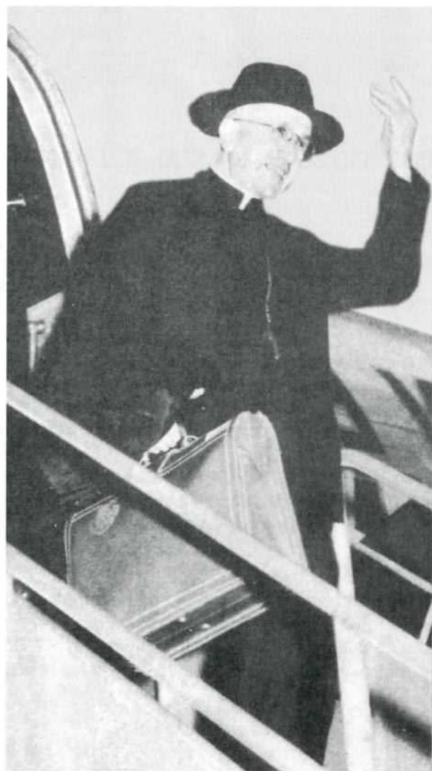
Presidente del Celam