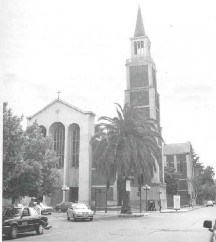
Iglesia Catedral de Talca