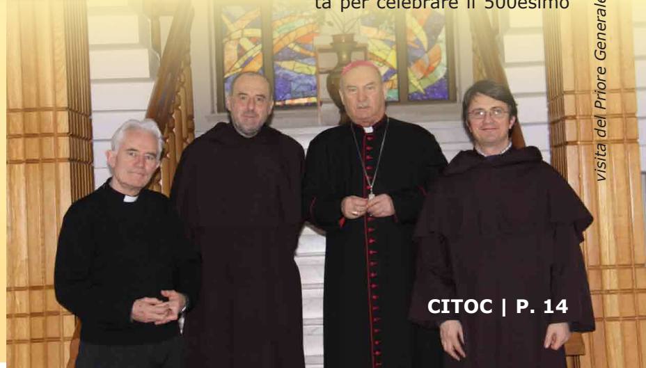
Visita del Priore Generale in Romania

In tutta Europa vi sono state delle meravigliose celebrazioni, congressi e attività per celebrare il 500esimo