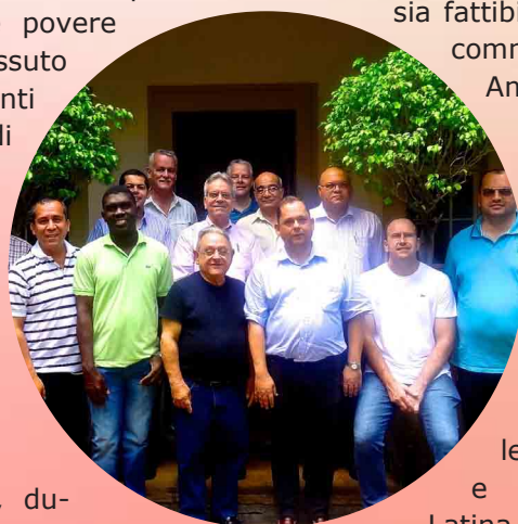
Incontro con i Superiori ed Economi

Desidero concludere dicendo che nel continente americano si può vedere molta speranza per il futuro. Allo stato attuale ci sono 181 studenti in formazione iniziale: 17 dagli USA, 63 dal Brasile e 101 dall'America Latina di lingua spagnola. Durante l'anno ci siamo sforzati di visitare le case di formazione e di incoraggiare i giovani che desiderano vivere la loro chiamata nel Carmelo. Che il Signore continui a benedirvi con molte e buone vocazioni.