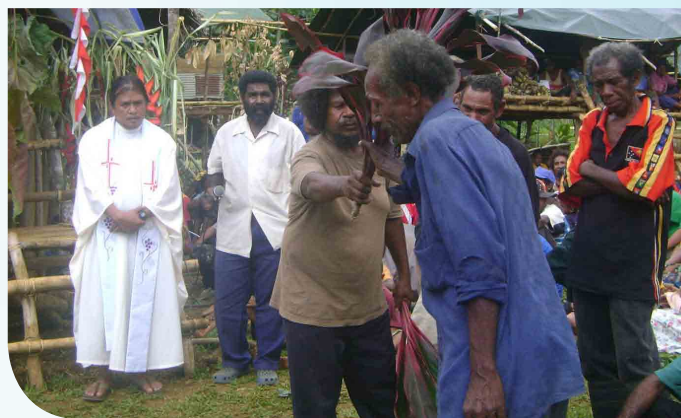
Rito della riconciliazione tra due clan

Dio è veramente il Dio delle sorprese. Ancora oggi, giorno dopo giorno Dio sorprende i nostri fratelli nelle missioni. I nostri fratelli continuano a scoprire nuove intuizioni e imparare nuove lezioni nella loro vita missionaria di tutti i giorni. Hanno dato l'esempio nel ministero pastorale di una nuova cultura e nuova realtà della Chiesa. Nel nostro 7° anno di presenza carmelitana in PNG, Dio