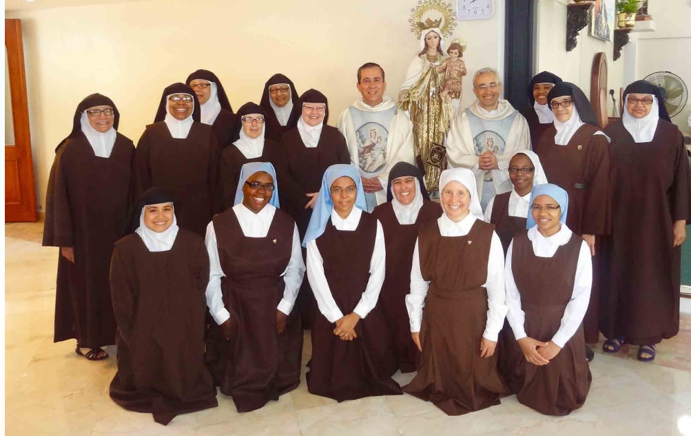
Visitando le monache nella Repubblica Dominicana

D'altra parte, durante l'incontro dei Provinciali, Commissari e Delegati di Europa tenutosi lo scorso settembre a Roma (Italia), ho avuto l'opportunità di incontrare i Provinciali di Aragón-Castilla-Valencia, Bética, Cataluña (le tre province spagnole), Italia e Malta, al fine di discutere riguardo al futuro delle loro missioni in America Latina: Antille, Venezuela (Baet), Venezuela (Cat), Colombia (Ita) e Bolivia. I cinque Priori Provinciali hanno sottolineato l'importanza e l'urgenza di rafforzare la formazione condi-