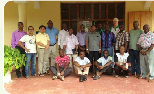
Assemblea dei superiori e formatori carmelitani in Tanzania

Infine nei giorni dal 15 al 18 settembre sono stato invitato a partecipare ad alcune sessioni dell'Incontro dei Provinciali europei; questo mi ha dato