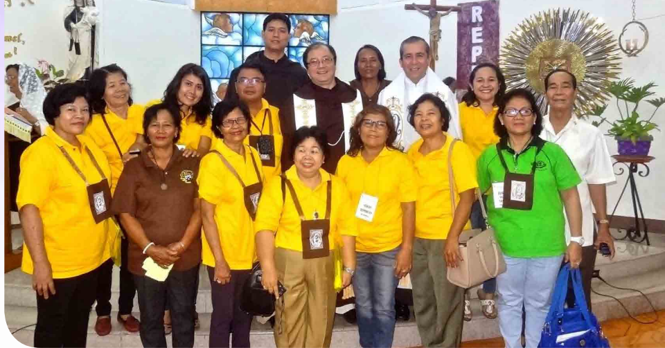
Incontro dei laici carmelitani dell'Asia-Australia-Oceania in Filippine

Nella veste di Consigliere generale incaricato per questa area geografica, ho potuto realizzare la visita fraterna in quasi tutte le comunità durante il 2015: da gennaio a