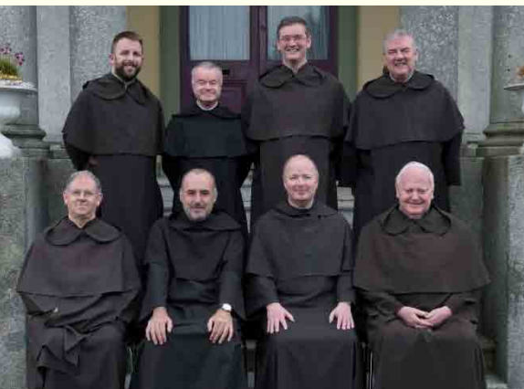
Capitolo Provinciale della Provincia d'Irlanda