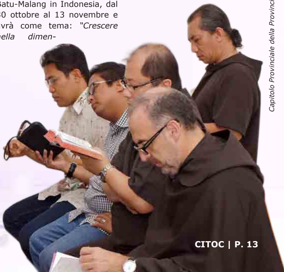
Capitolo Provinciale della Provincia di Indonesia

Chiedo a Dio che benedica i Carmelitani presenti in questa parte del mondo e che ci guidi con la sua sapienza per riuscire ad offrire il meglio al Carmelo di queste zone e a tutto l'Ordine.