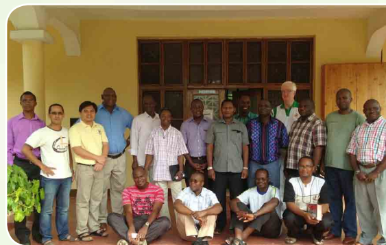
Asamblea de los líderes y formadores Carmelitas en Tanzania

8. Que las entidades apliquen la Resolución del Capítulo General sobre la creación de un Ambiente Seguro para Niños y Adultos con carácter de urgencia, de acuerdo con la política del Papa 'tolerancia cero' para asegurar que no haya abusos en los lugares donde viven los