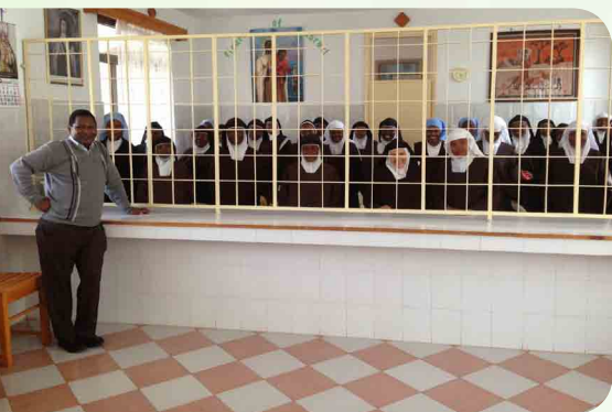
Monasterio Virgen del Carmen Machakos, Kenia

Si bien hay muchos aspectos positivos en la experiencia del Carmelo de África, también hay preocupaciones que deben abordarse para poder aprovechar y consolidar los aspectos positivos. Según mi opinión, hay que prestar mayor atención a las siguientes cuestiones: a. Liderazgo, b. Dinámicas de vida comunitaria, c. El proceso de formación, d. Sostenibilidad auto financiera sobre la base de los recursos africanos, e. Servicio en medio del pueblo, f. Programas de Familia Carmelita coordinados, g. El papel de las jurisdicciones de apoyo.