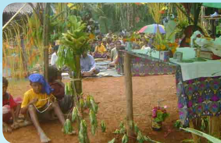
Orar la Lectio Divina ante la Eucaristía

Este desarrollo es muy positivo ya que tenemos nuestra presencia en la capital, pues ahí existen más ministerios y programas via-