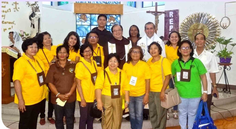
Encuentro de Laicos Carmelitas de Asia y Oceanía en Filipinas

Algunas de las actividades realizadas en el primer semestre de este sexenio son: reunión de formadores y estudiantes, cada dos años. La última reunión de formadores fue en noviembre de 2014, y los estudiantes se reunieron en abril de 2015; ambos encuentros se celebraron en Filipinas. El encuentro de superiores se llevó a cabo en noviembre de 2014 en Vietnam. En marzo de 2015 se realizó una asamblea de la Tercera Orden Carmelita en Tagaytay, Filipinas. Finalmente, en noviembre de 2015, llevamos a cabo, en Malang, Indonesia, un curso de formación permanente para frailes que se encuentran entre el primer y el quinto año de ministerio activo, con el tema: Cuidando la Vocación Carmelita en el Año de la Vida Religiosa. Como consejero de esta área he visitado en 2015 casi todas las comunidades de la zona a través de encuentros fraternos: la India, entre enero y febrero; Indonesia, Papúa Nueva Guinea, Australia y Filipinas, entre julio y septiembre.