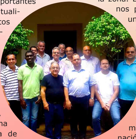
Encuentro con los Superiores y Eónomos

Por acuerdo de los superiores y delegados de las Américas, el primer curso intensivo de formación para estudiantes y formadores jóvenes tuvo lugar entre el 23 de julio y 9 de agosto de 2015 en nuestra Casa de Retiros de Lima, Perú. En dicho encuentro participaron 23 frailes de 10 países, los cuales profundizaron temas importantes sobre la Espiritualidad y los Santos Carmelitas, hicieron visitas pastorales en zonas pobres de la ciudad, compartieron muchos espacios de oración y meditación, y vivieron una experiencia rica de fraternidad e internacionalidad de la Orden.