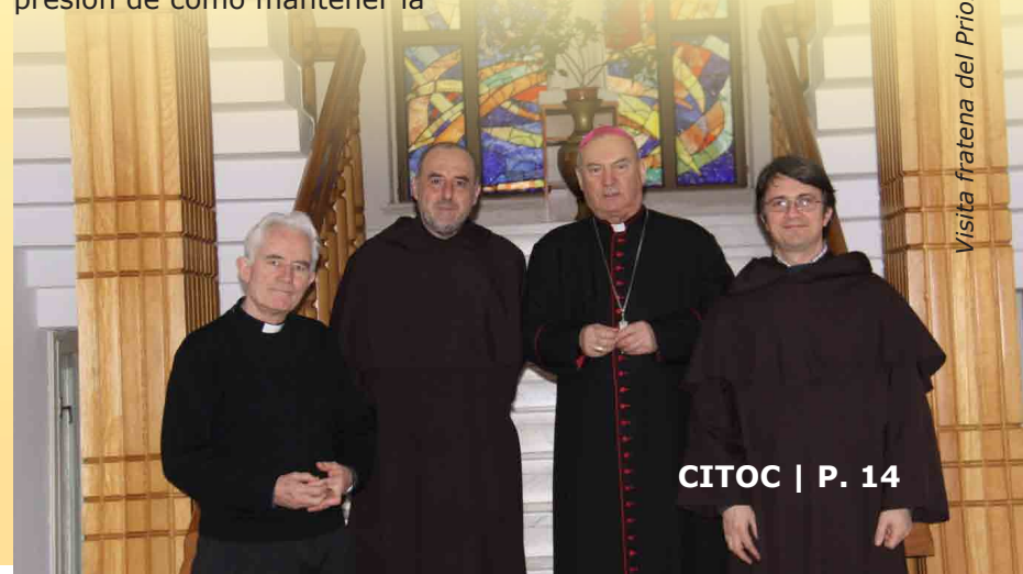
Visita fratana del Prior General en Rumania

Ha habido en toda Europa maravillosas celebraciones, congresos y actividades para conmemorar el 500º aniversario del nacimiento de Sta. Teresa de Jesús. La mayoría de estos acontecimientos han sido publicados por CITOC-online. En 2016 celebraremos el 450º aniversario del nacimiento de una de