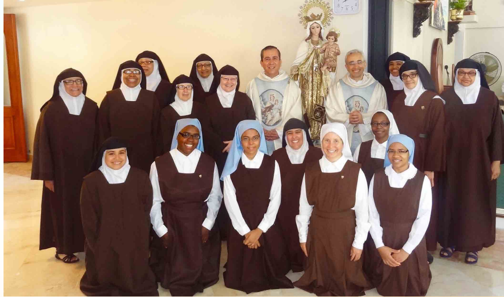
Visitando uno de los monasterios en la República Dominicana

Por otro lado, durante el encuentro de Provinciales, Comisarios y Delegados de Europa celebrado en el mes de septiembre en Roma, Italia, tuvimos la oportunidad de reunirnos con los Provinciales de España (Aragón-Castilla-Valencia, Bética y Cataluña), Italia y Malta para dialogar sobre el futuro de sus misiones en Hispano América: Antillas (Aragón-Castilla-Valencia) Venezuela (Baet y Cat), Colombia (Ita) y