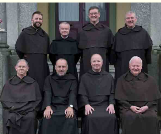
Capítulo Provincial de la Provincia de Irlanda