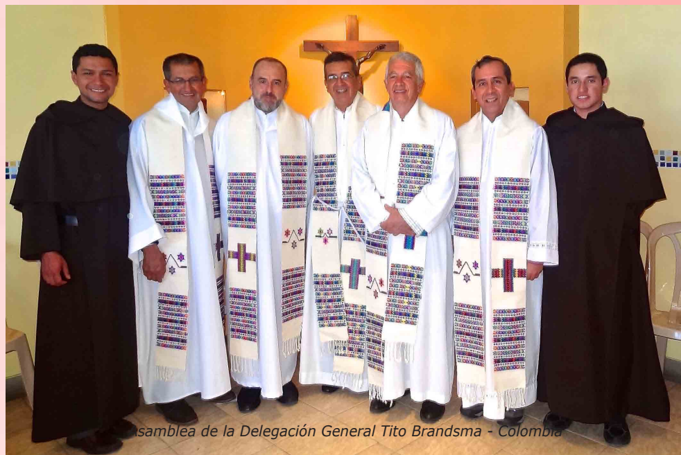
Asamblea de la Delegación General Tito Brandsma - Colombia