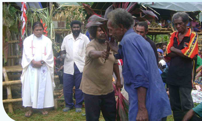
Rito de reconciliación entre los dos clanes

Dios es realmente el Dios de las sorpresas y nuestros hermanos en las misiones todos los días reciben alguna de ellas de parte de Dios. Nuestros frailes siguen descubriendo nuevas cosas y aprendiendo nuevas lecciones en su vida misionera. En nuestro séptimo año de presencia carmelita en PNG, Dios nos ha dado muchas bendiciones. La comunidad se ha comprometido en la construcción de Comunidades Eclesiales de Base como una estrategia pastoral en la construcción de la Iglesia de los Pobres