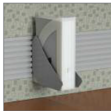
TACKBOARD WITH ACCESSORY RAIL TABLEAU PUNAISABLE AVEC TRINGLE POUR ACCESSOIRES