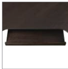
VENEERED PULLOUT KEYBOARD TRAY TABLETTE À CLAVIER COULISSANTE EN PLACAGE