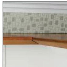
COPEDED EDGE ON CONNECTING WORKSURFACES CHANT CHANTOURNÉ SUR LES SURFACES DE TRAVAIL JUMELABLES