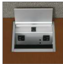
POWER/DATA GROMMET IN ANODIZED ALUMINUM OR BLACK BLOC ÉLECTRICITÉ/ DONNÉES FINI ALUMINIUM ANODISÉ OU NOIR