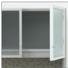
ALUMINUM GLASS DOORS PORTES VITRÉES CADRÉES ALUMINIUM