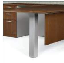
SQUARE POST LEG CHOOSE TUNGSTEN OR BLACK PIED CARRÉ FINI TUNGSTÈNE OU NOIR