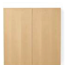
VISUAL BOARD TABLEAU DE PRÉSENTATION