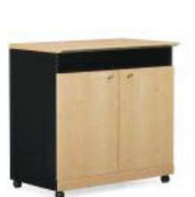
MOBILE SERVER DESSERTTE MOBILE