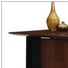
TWO INCH KNIFE EDGE ARÊTE VIVE DE 2 POUÇES