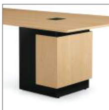
SQUARE TWO TONE TABLE BASE PIÉMENT CARRÉ À DEUX TONS