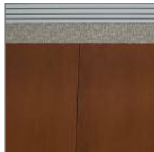
UNIFORM GRAIN DIRECTION ON WORKSURFACES ORIENTATION UNIFORME DU GRAIN DU BOIS SUR LES SURFACES DE TRAVAIL