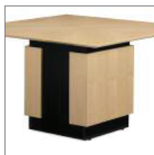
SQUARE TWO TONE MONO TABLE BASE PIÉMENT CARRÉ UNIQUE À DEUX TONS