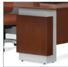
RECTANGULAR TWO TONE BASE PIÉMENT RECTANGULAIRE À DEUX TONS