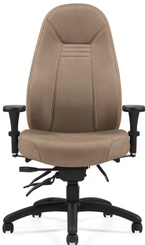
1240-3 Fauteuil à basculements multiples à dossier haut et piétement noir garni d'un textile Tek de Momentum en rêve.

Un système de soutien interne exclusif aide à réduire les tensions dorsales en plaçant votre dos dans une position correcte et saine. Le dossier épouse en tout temps la forme naturelle en « S » de votre colonne vertébrale.