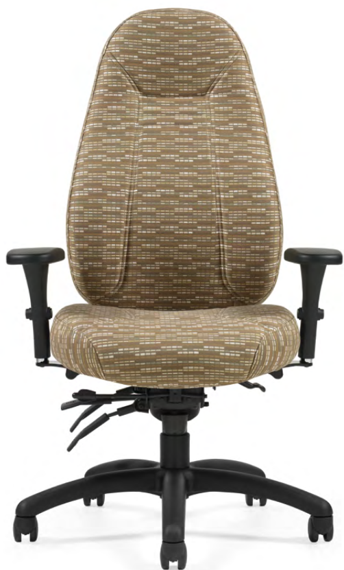
TS1240-3 Fauteuil à basculements multiples haut rendement 24 h à dossier haut et piétement noir garni d'un textile Flux de Momentum en dune.

La gamme Obusforme Comfort est reconnue pour le confort dorsal exceptionnel qu'elle offre et qui ne se compare à aucune autre.