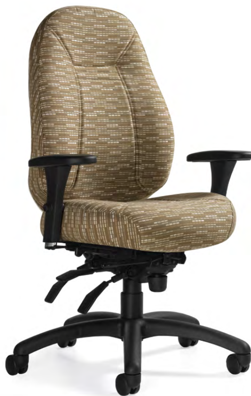
TS1241-3 Fauteuil à basculements multiples haut rendement 24 h à dossier moyen et piétement noir garni d'un textile Flux de Momentum en dune.