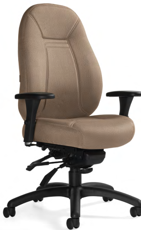
1241-2 Fauteuil à basculement aux genoux à dossier moyen et piétement noir garni d'un textile Tek de Momentum en rêve.

Certains modèles choisis présentent un support lombaire à profondeur réglable. Tous les modèles sont dotés d'une assise profilée et d'accoudoirs à hauteur et à écartement réglables. Les modèles à basculement aux genoux et à basculements multiples sont dotés d'un mécanisme de réglage de la profondeur de l'assise. La gamme peut être garnie de tissu, de vinyle ou de cuir.