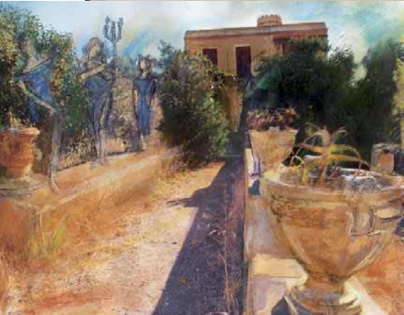
ΑΠΟ ΠΛΑΝΟ ΑΡΙΣΤΕΡΑ, ΔΕΞΙΟΣΤΡΟΦΑ: Ο ΚΑΛΛΙΤΕΧΝΗΣ ΛΙ ΓΟΥΕΛΣ. INTERVENTION OF A BAG LADY ON 14th STREET ΤΗΣ ΡΟΣΑΛΙΝΤΑ ΓΚΟΝΖΑΛΕΣ. ΤΟ ΑΡΧΟΝΤΙΚΟ ΒΕΝΙΕΡΗ ΣΤΗΝ ΑΝΘ ΜΕΡΑ.