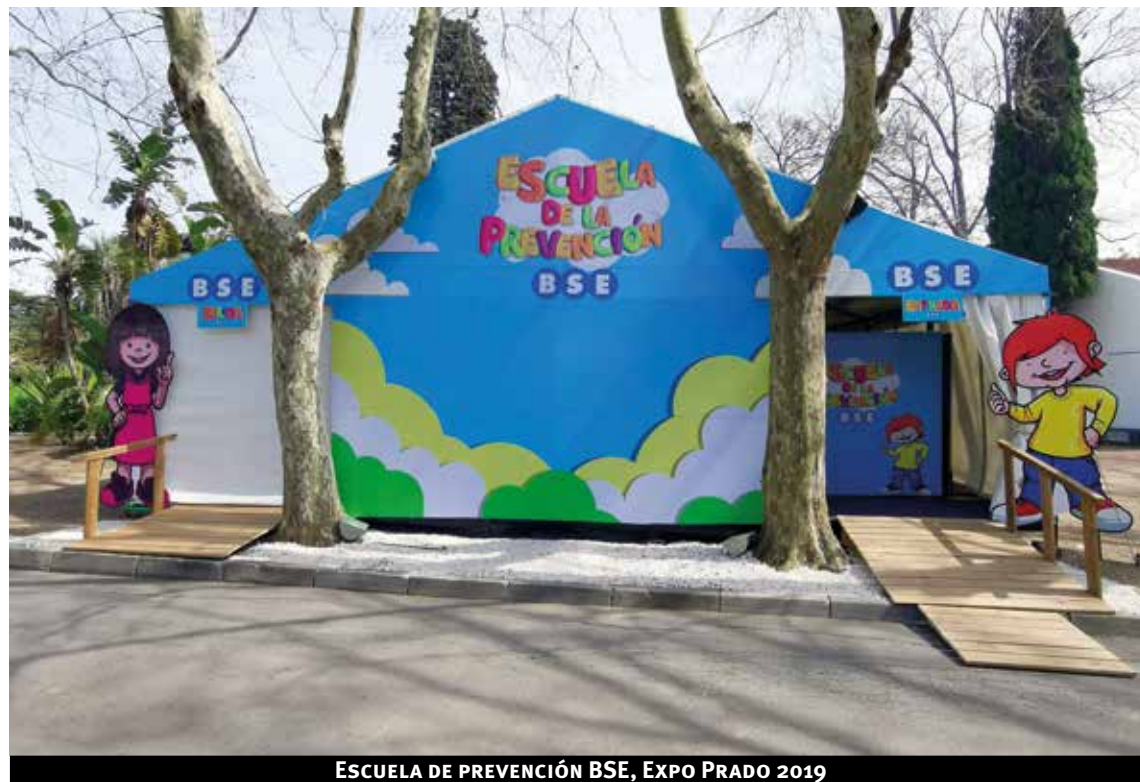
ESCUELA DE PREVENCIÓN BSE, EXPO PRADO 2019

Desde el año 2016 se suma al movimiento internacional Mayo Amarillo. Esta iniciativa busca generar conciencia sobre los siniestros de tránsito y mostrar la importancia de adoptar mecanismos de prevención. Este año, bajo el lema “en el tránsito, el sentido es la vida”, la fachada de