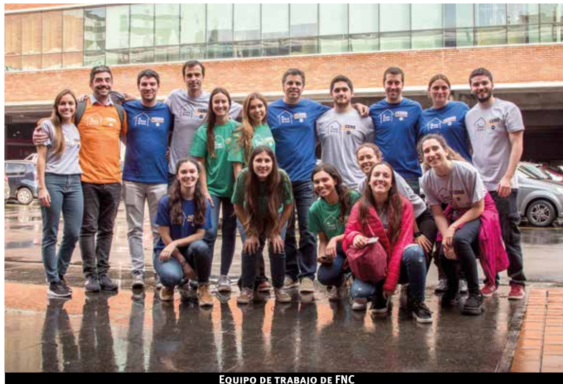
EQUIPO DE TRABAJO DE FNC

En la misma línea, desde el año 2016 se trabaja junto a la Federación de Obreros y Empleados de la Bebi-