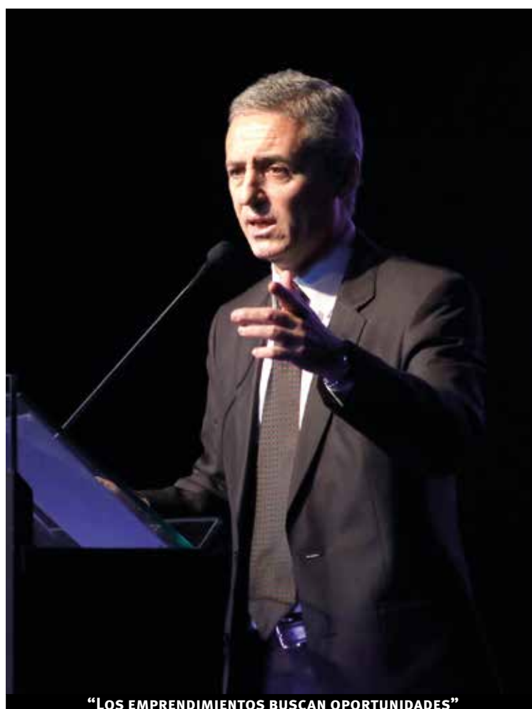
“LOS EMPRENDIMIENTOS BUSCAN OPORTUNIDADES”

A diferencia de los Objetivos de Desarrollo del Milenio, los ODS combinan el aspecto social, característico de los ODM, con el crecimiento económico y el cuidado del medio ambiente, así el “desarrollo pasa a ser integral”. Cada país mide desde donde inicia, “pero el objetivo no es llegar a un