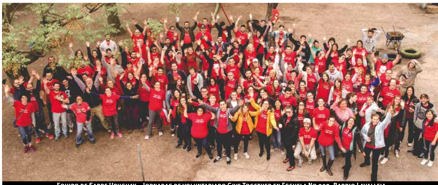
EQUIPO DE SABRE URUGUAY – JORNADAS DE VOLUNTARIADO GIVE TOGETHER EN ESCUELA NO 302, BARRIO LAVALLEJA

Sabre abre operaciones en Uruguay en mayo de 2004 y durante los 15 años de la empresa en el país se caracterizó por el crecimiento, evolución y diversificación del equipo. Este desarrollo es acompañado por un intenso trabajo de la cultura corporativa basada en valores, que fomenta el creci-