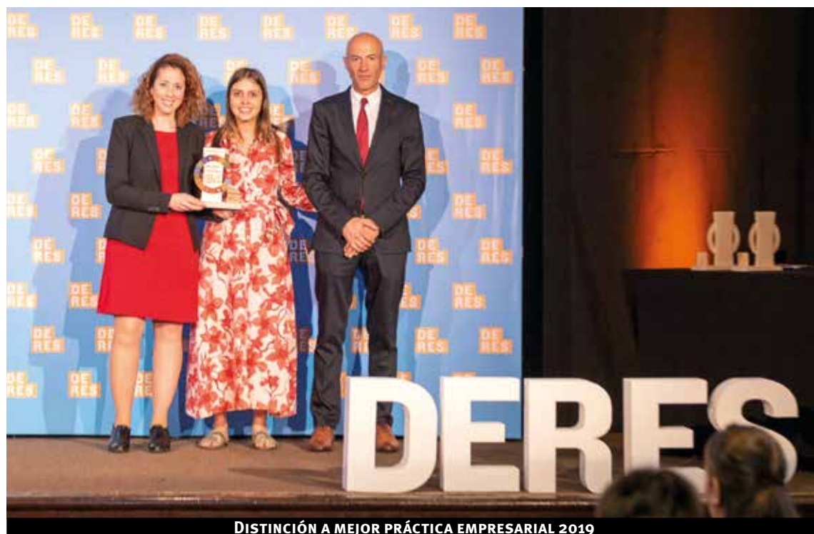
DISTINCIÓN A MEJOR PRÁCTICA EMPRESARIAL 2019

A través de su programa de Responsabilidad Social Empresarial (RSE), Pronto! apoya a organizaciones sociales y proyectos que generan oportunidades para la comunidad. Las causas sociales apoyadas deben compartir sus principios y valores, con foco en la pasión, el compromiso y la responsabilidad.