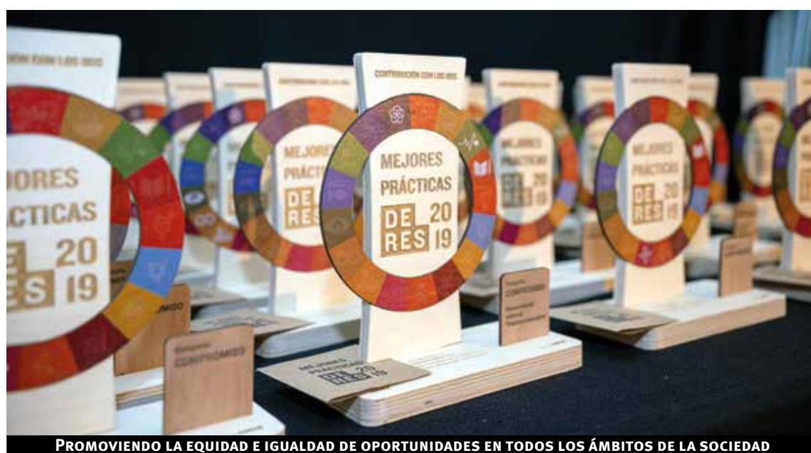
PROMOViendo LA EQUIDAD E IGUALDAD DE OPORTUNIDADES EN TODOS LOS ÁMBITOS DE LA SOCIEDAD

innovadoras, generando la mejor experiencia para todos.”