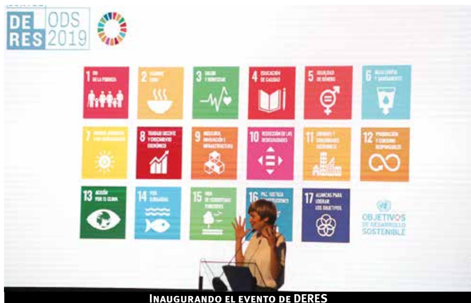
INAUGURANDO EL EVENTO DE DERES