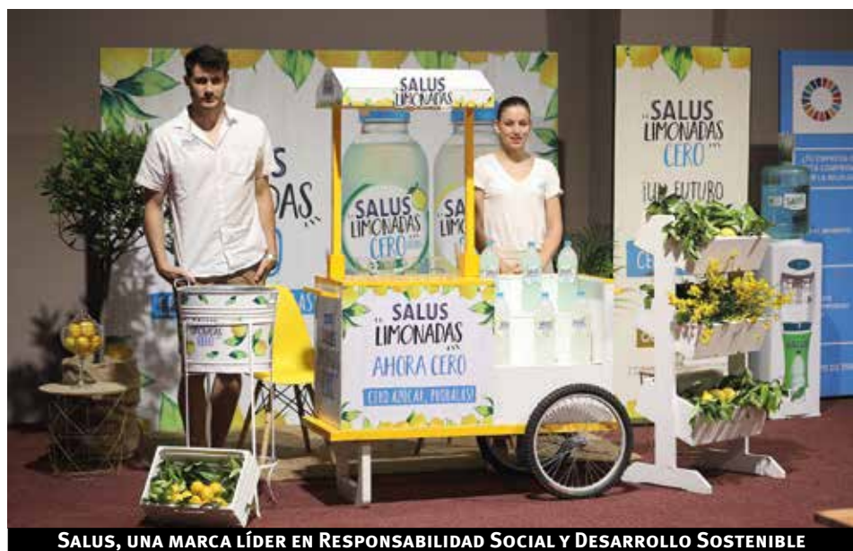
SALUS, UNA MARCA LÍDER EN RESPONSABILIDAD SOCIAL Y DESARROLLO SOSTENIBLE