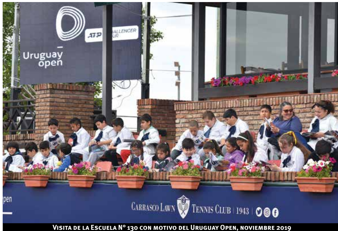
VISITA DE LA ESCUELA N° 130 CON MOTIVO DEL URUGUAY OPEN, NOVIEMBRE 2019

Instalamos entre socios y funcionarios el concepto de solidaridad como proyecto colectivo,