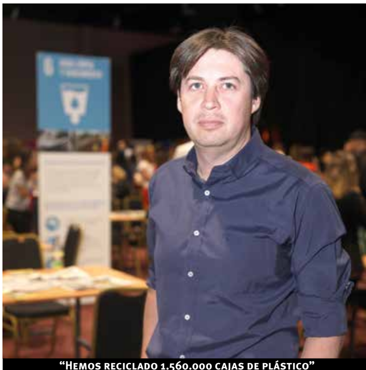
“HEMOS RECICLADO 1.560.000 CAJAS DE PLÁSTICO”

“Hemos reciclado 1.560.000 cajas de plástico. Fuimos el primero del mundo en descubrir que es posible hacer artículos funcionales con 100% del material polialuminio. Trabajamos con más de 60 tipos de plásticos”, declara la empresa. “La Virtud de Reciclar” es un proyecto pionero en el mundo en cuanto al reciclaje de los desechos plásticos domiciliarios. La empresa los recupera para volver a ponerlos en el mercado en forma de productos revalorizados y competitivos que cierran la consigna recuperación-reciclaje-revalorización. Además la iniciativa triunfó en la categoría Tierra, del Premio Nacional de Medio Ambiente, Recyclápolis 2017.