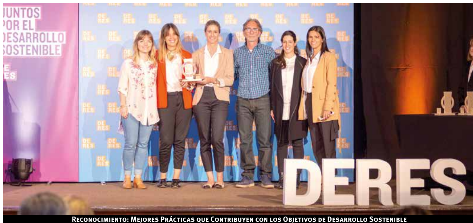
RECONOCIMIENTO: MEJORES PRÁCTICAS QUE CONTRIBUYEN CON LOS OBJETIVOS DE DESARROLLO SOSTENIBLE

Así es que en Itaú la orientación financiera es uno de los temas materiales al negocio y se viene trabajando en ello desde hace varios años. Se conformaron equipos de trabajo integrados por colaboradores de Empresas,