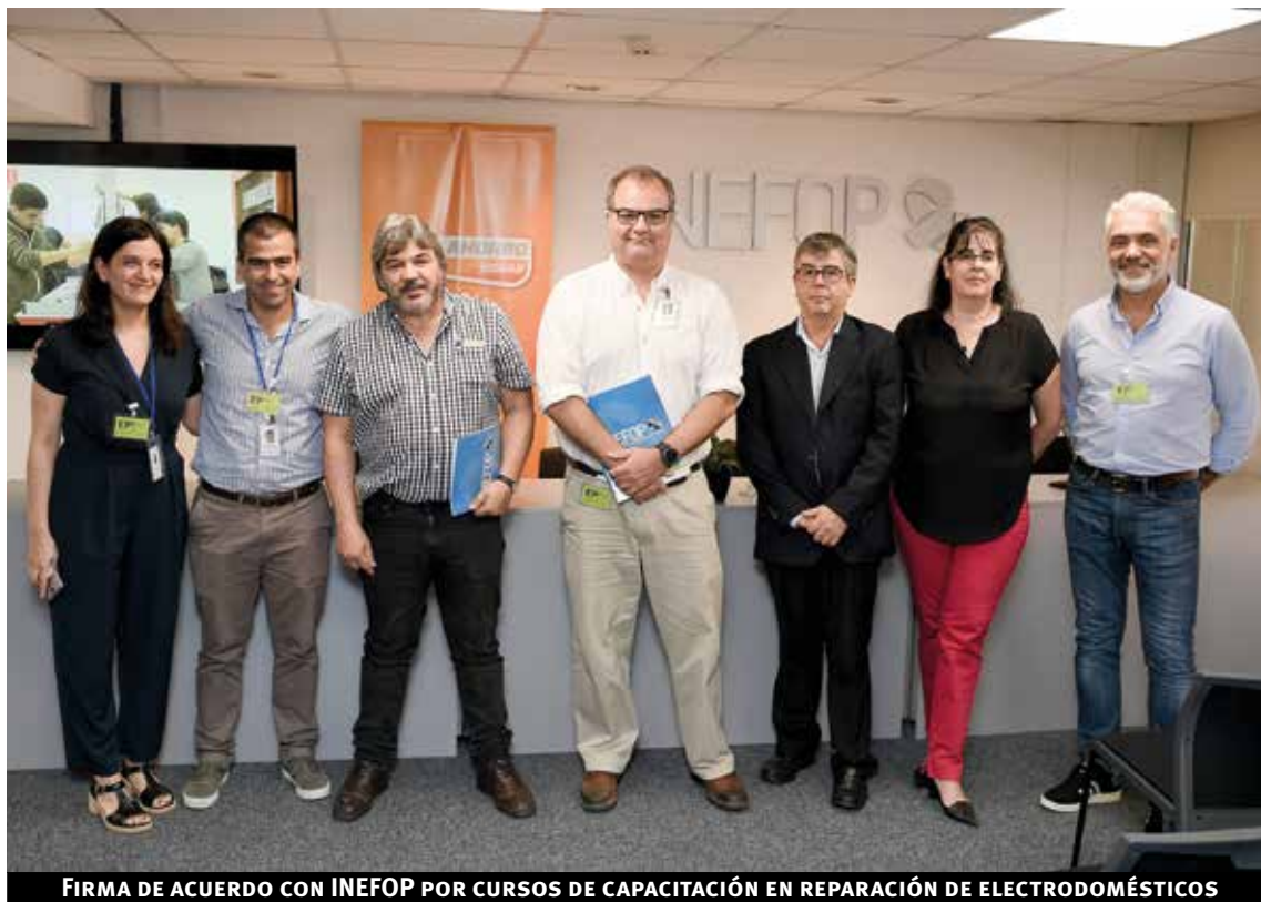
FIRMA DE ACUERDO CON INEFOP POR CURSOS DE CAPACITACIÓN EN REPARACIÓN DE ELECTRODOMÉSTICOS

El resultado de este plan es la generación de un círculo virtuoso y sustentable que crece y evoluciona gracias a la participación y compromiso de todas las partes involucradas. Plan Recambio logra impactar de manera positiva