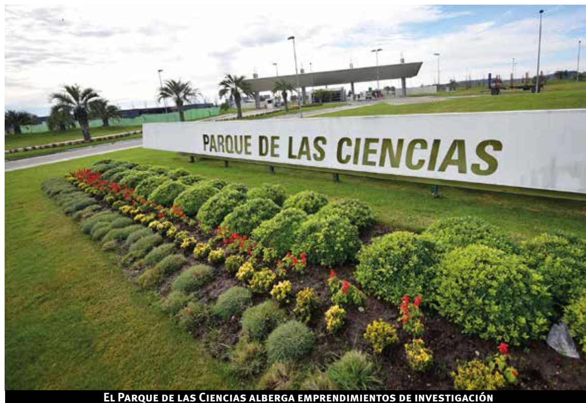
EL PARQUE DE LAS CIENCIAS ALBERGA EMPRENDIMIENTOS DE INVESTIGACIÓN

Se toma como eje principal en una punta al Parque de las Ciencias, en el que hay investigación y desarrollo, relacionado con la ciencia de la vida y la salud, dijo Filippini. Del otro lado, se encuentra