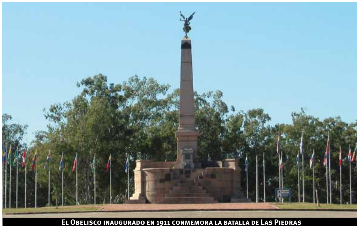
EL OBELISCO INAUGURADO EN 1911 CONMEMORA LA BATALLA DE LAS PIEDRAS

La ciudad, que en este 2019 festejó su aniversario número 275, es un enclave fundamental de la historia nacional debido a la gesta