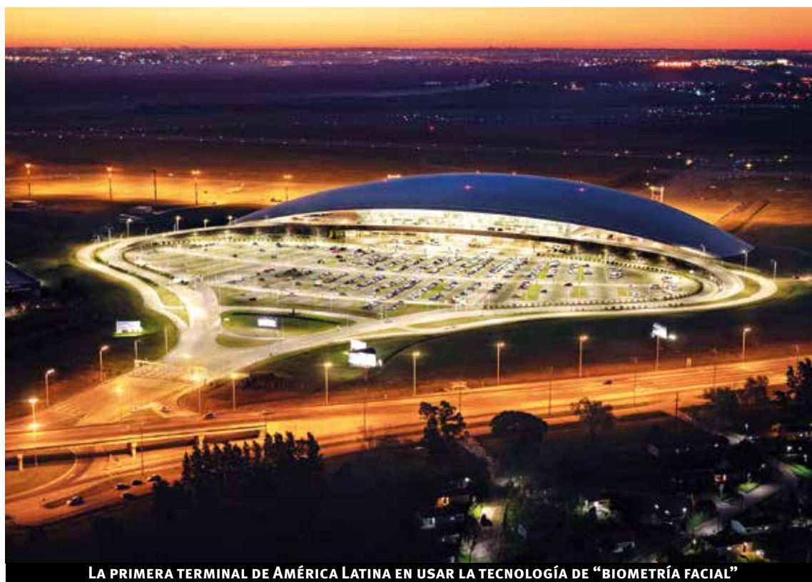
LA PRIMERA TERMINAL DE AMÉRICA LATINA EN USAR LA TECNOLOGÍA DE "BIOMETRÍA FACIAL"

Todo esto busca que el aeropuerto sea cada vez más ágil, seguro y eficiente, y que los pasajeros, clientes, comunidad aeroportuaria y usuarios en general disfruten de una experiencia única.