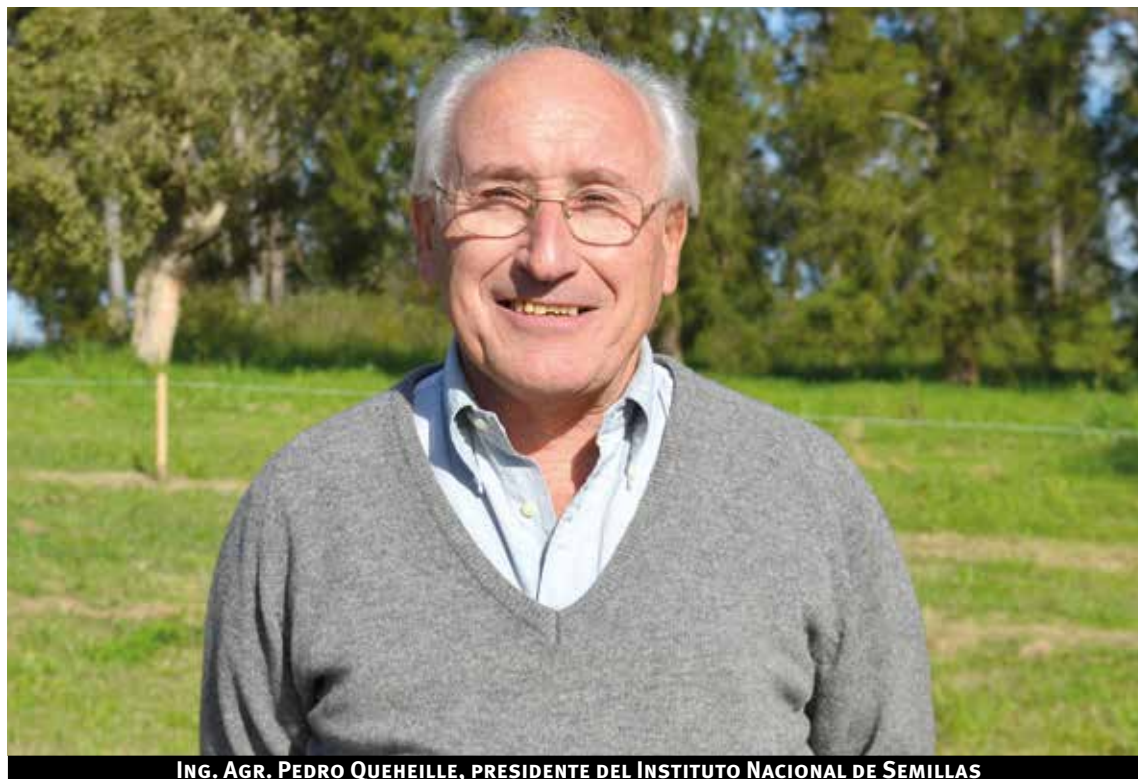
ING. AGR. PEDRO QUEHEILLE, PRESIDENTE DEL INSTITUTO NACIONAL DE SEMILLAS

El jerarca, que dirige el instituto que se encarga de velar por la calidad de las semillas que se utilizan en Uruguay, explicó que trabajan fuertemente en el departamento, donde también está ubicada la sede del Instituto, para llegar a todos los productores de la zona.