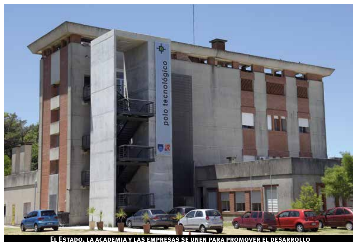
EL ESTADO, LA ACADEMIA Y LAS EMPRESAS SE UNEN PARA PROMOVER EL DESARROLLO

Es que además de promover la llegada, también se trabaja para que estas inversiones se incorporen al territorio de manera ordenada. “Por ejemplo, la dirección de planificación territorial está trabajando desde hace tiempo en la organización del territorio. Antes venía cualquier empresa y se instalaba en cualquier lado. Eso cambió rotundamente. Y ahora pasa. La planificación se hace en virtud