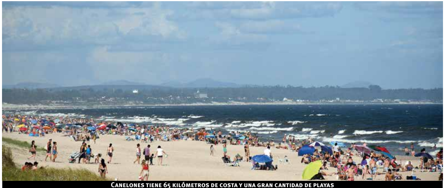
CANELONES TIENE 65 KILÓMETROS DE COSTA Y UNA GRAN CANTIDAD DE PLAYAS

En ese marco, la intendencia de Canelones en coordinación con los actores privados del sector y el Ministerio de Turismo, incrementó la cantidad y calidad de los servicios