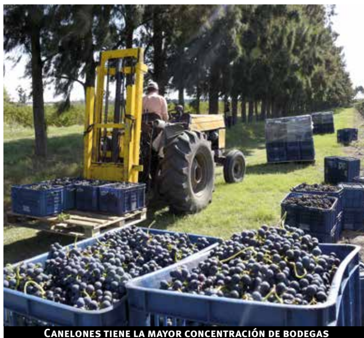
CANELONES TIENE LA MAYOR CONCENTRACIÓN DE BODEGAS

El nuevo MUV será un edificio de dos plantas, una en el subsuelo de la actual escuela y otra—a construirse—en planta baja. Tendrá un centro de información turística,