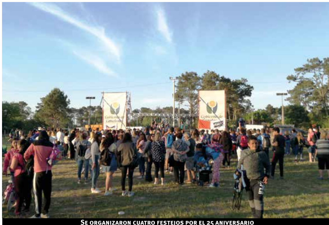
SE ORGANIZARON CUATRO FESTEJOS POR EL 25 ANIVERSARIO

El alcalde añadió que para el municipio es un gran desafío