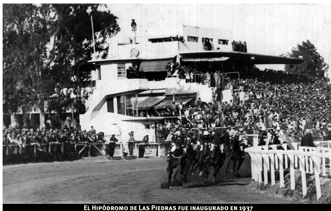
EL HIPÓDROMO DE LAS PIEDRAS FUE INAUGURADO EN 1937

La obra está orientada hacia el oeste sobre una base rectangular de granito rosa que fue extraído de canteras de la zona. En la parte superior la Victoria, una figura de porte clásico. Además, se pueden observar elementos de la Patria Vieja: en el brazo izquierdo un escudo y una lanza de caña tacuara;