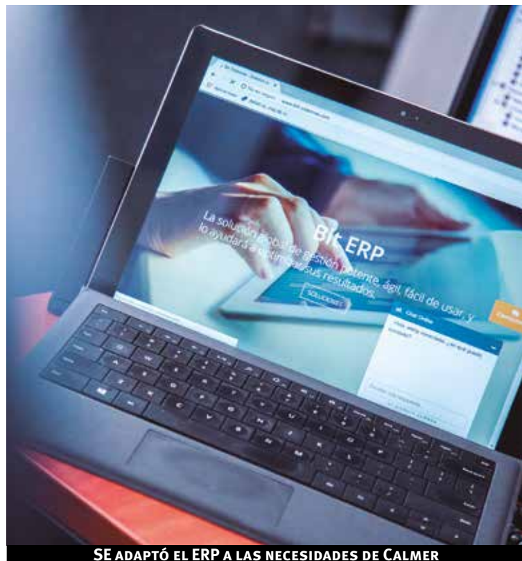
SE ADAPTÓ EL ERP A LAS NECESIDADES DE CALMER

“QUIERO DESTACAR LA COLABORACIÓN Y DEDICACIÓN DE TODOS LOS FUNCIONARIOS”