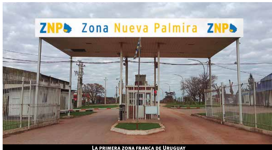
LA PRIMERA ZONA FRANCA DE URUGUAY

Dentro de la zona franca podrá también realizarse toda clase de operaciones de montaje, manipulación, transformación, perfeccionamiento, etc. de artículos y materiales primas de procedencia extranjera, los que podrán desembarcarse o reembarcarse en cualquier tiempo, libre de derechos