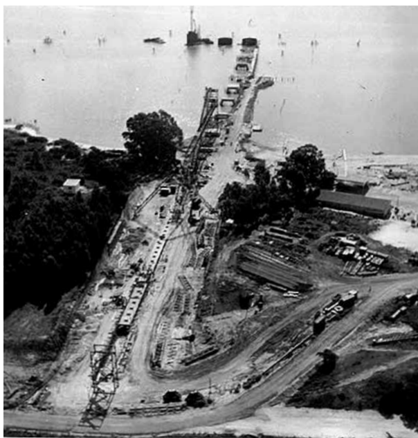
EARLY FEBRUARY, 1958 Aerial view of TRANSFER STATION.

Ambos terminales están equipados con cientos de metros de cintas trans-