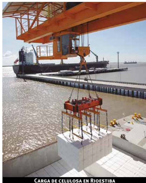
CARGA DE CELULOSA EN RIOESTIBA

El compromiso de nuestro equipo humano y la constante inversión en capacitación, nos permiten ofrecer servicios altamente competitivos y profesionales”. El gerente