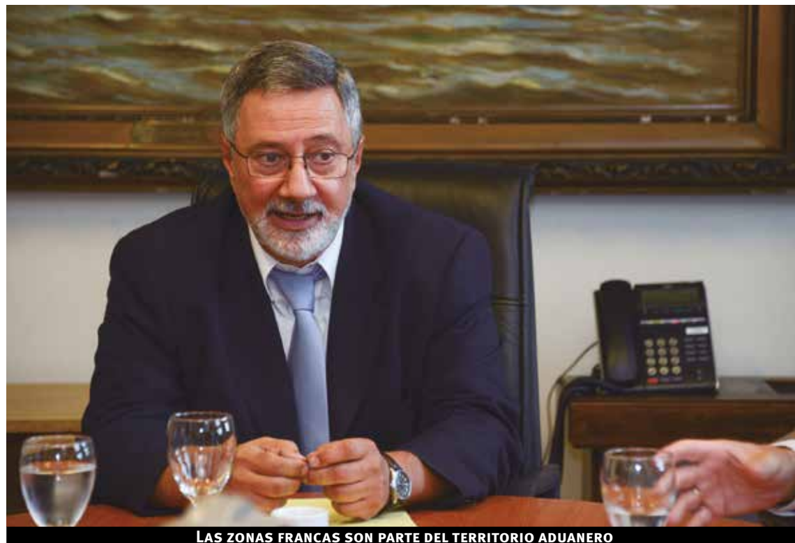
LAS ZONAS FRANCA SON PARTE DEL TERRITORIO ADUANERO

Para gestionar ese conocimiento de los operadores, “la DNA construyó un registro electrónico, basado en el intercambio de información ya existente en diferentes organismos. Este registro integra las transmisiones de la Dirección General Impositiva (DGI) de un