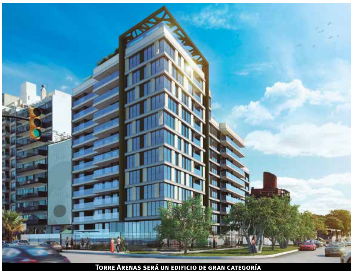
TORRE ARENAS SERÁ UN EDIFICIO DE GRAN CATEGORÍA