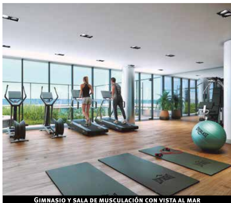
GIMNASIO Y SALA DE MUSCULACIÓN CON VISTA AL MAR

La Torre Arenas es un proyecto concebido por el Estudio Rener para disfrutar en uno de los barrios más importantes de la ciudad, frente al mar, en un entorno residencial cercano a espacios verdes y múltiples comercios y centros de servicios.