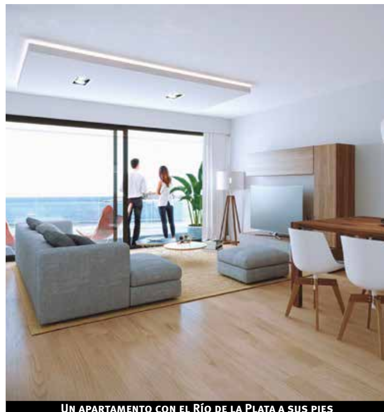
UN APARTAMENTO CON EL RÍO DE LA PLATA A SUS PIES