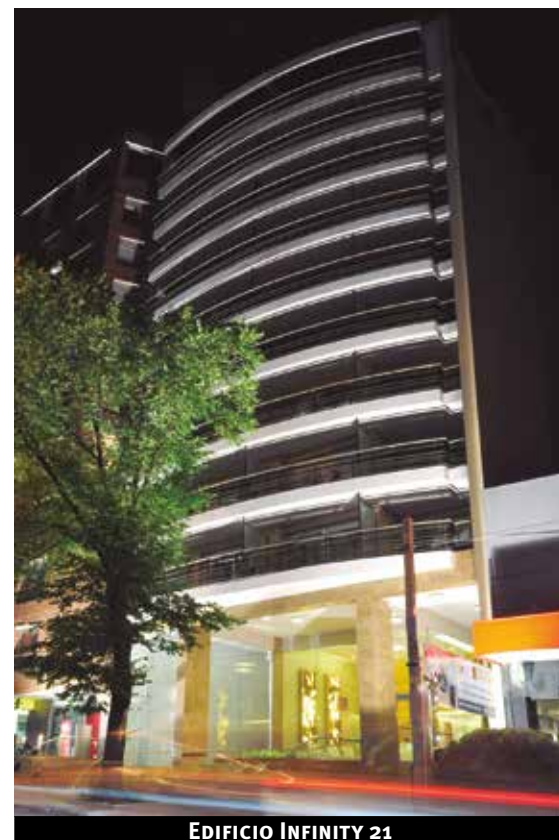
EDIFICIO INFINITY 21