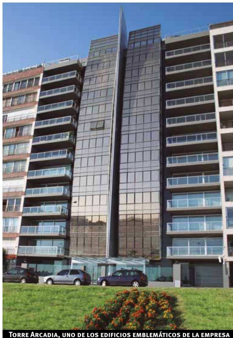
TORRE ARCADIA, UNO DE LOS EDIFICIOS EMBLEMÁTICOS DE LA EMPRESA

Construimos en la década de 1970, en el cruce de Rivera y Ponce, el edificio “Central Park”, cuyo predio lo adquirimos por 3.000 dólares. En aquel entonces cada apartamento costaba 3.000 dólares. Se fueron vendiendo en el transcurso de la obra, y fueron subiendo de precio. Al finalizar la construcción, las unidades que quedaban disponibles, pasaron a venderse, increíblemente, a 15.000 dólares. Este fue un claro