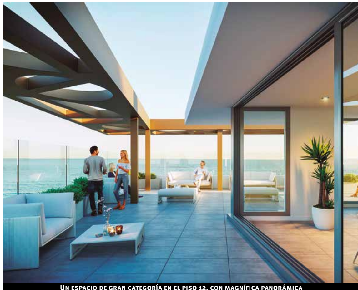
UN ESPACIO DE GRAN CATEGORÍA EN EL PISO 12, CON MAGNÍFICA PANORÁMICA