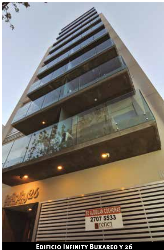
EDIFICIO INFINITY BUXAREO Y 26

Rompe la monotonía urbanística de su entorno generando un grato y espectacular impacto en la Rambla República del Perú. Tiene 12 pisos, en dos torres, con un impactante hall de acceso. Es coronado por una hermosa quilla que le aporta una distinguida estética.