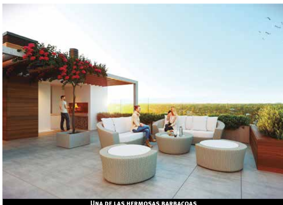
UNA DE LAS HERMOSAS BARBACOAS