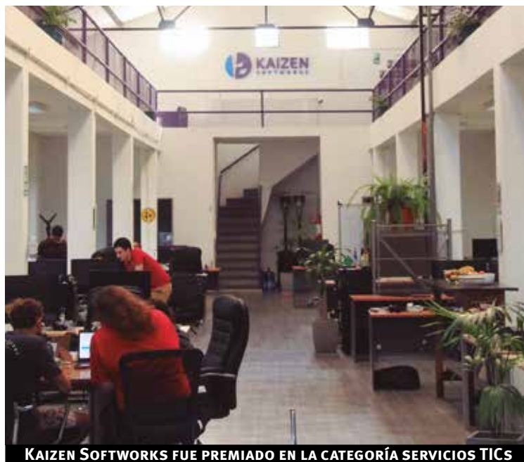
KAIZEN SOFTWORKS FUE PREMIADO EN LA CATEGORÍA SERVICIOS TICS

Una vez que dejamos de ser una pequeña empresa y empezamos a expandirnos, comenzamos a enfrentar nuevos desafíos. Los