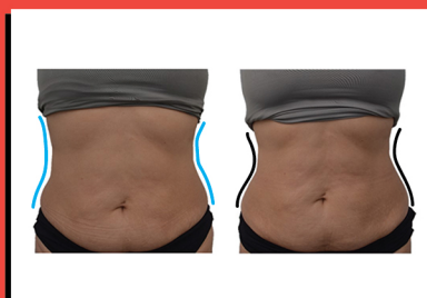
ANTES DE NUBOD DESPUÉS DE NUBOD