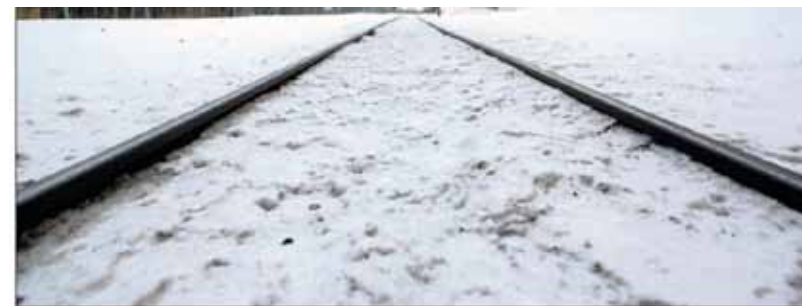
HELHET: Innsenderen ser byggingen av jernbane i nasjonalt perspektiv. Her dagens trase, på Nykirke.