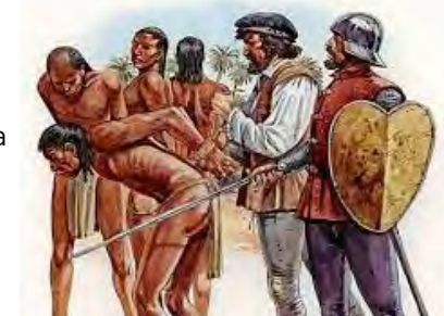
ESCLAVOS INDIOS NATIVOS