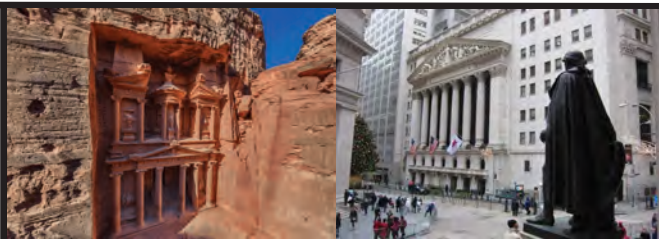
MONTE SEIR REINO EDMITA

• Herodes: Idumeano gobernantes de Palestina (47 AC-79 DC) se inició on la línea Antípater, a quien Julio César procurador de Judea realizado en 47AC Herodes el Grande, primer fiscal de Galilea, a continuación, el Rey de los Judíos (37-4 AC), construyó Cesarea, en el templo de Jerusalén; sacrificados los niños en Belén (Mateo 2:1-18). Estos Edomitas se convirtieron al Judaísmo se les llama Jew-ish hoy.