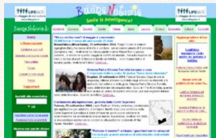
Le versioni del sito, originariamente su dominio .net