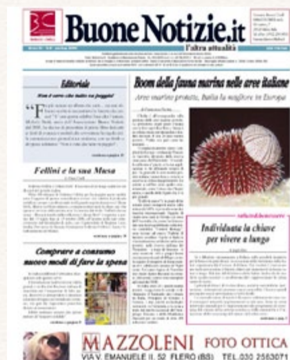
La copertina dell’ottavo e ultimo numero pubblicato

Come nella migliore delle favole, dopo difficoltà, traversie, voglia di mollare tutto, ecco che arriva la redenzione: sempre più veloce.