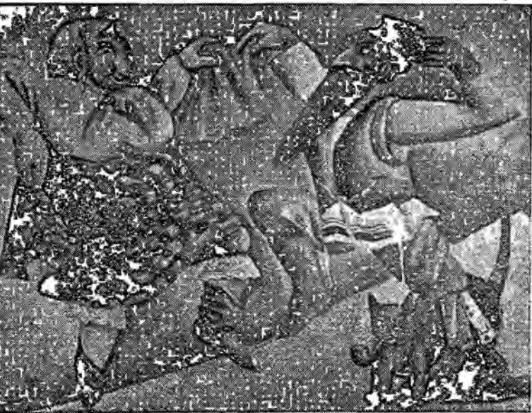
טאַני. אויפּפאַרב פון יאָסל קאָטלער

(אַפּ) מע שויל עך : (באַווייזט זיך) ס'וועט אים העלפּן ווי אַ טויטן באַנקעס. (אַ בלאַז אַפּן לעכטל.) דאָס לעכטל איז שוין ווידער פאַר . . . (פאַרהאַנג האַקט איבער לעצטן)