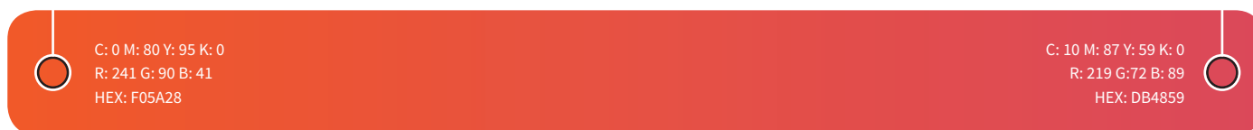
MARCA 19 SENSES