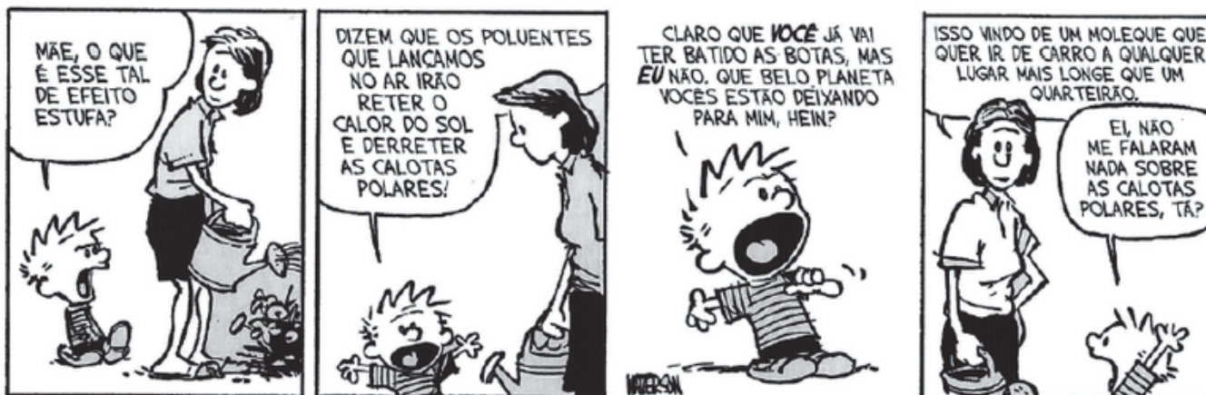
Figura Ampliada do texto 3