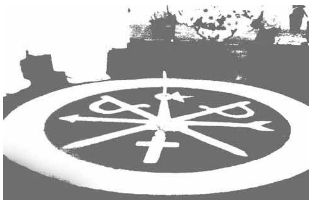
(Lísias N. Negrão. Entre a cruz e a Encruzilhada: Formação do Campo Ubandista em São Paulo . São Paulo; EDUSP. 1996)