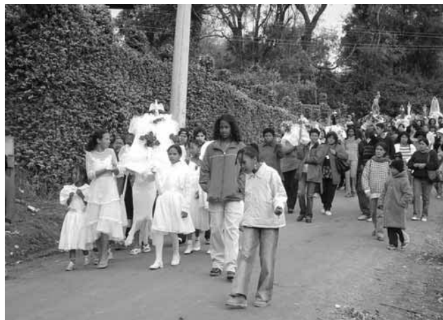
(Festa de Nossa Senhora do Carmo – Bairro do Carmo/São Roque-SP. Castro, 2006)