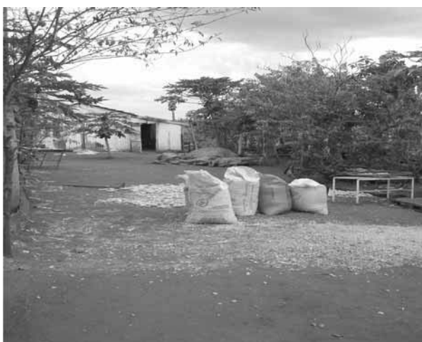
Figura 2 (B. Castro, 2008)

Assinale a alternativa correta relacionando o enunciado com o que está sendo mostrado nas Figuras 1 e 2.