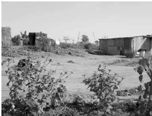
(Acampamento Elizabete Teixeira – Limeira/SP – B. Castro, 2008)