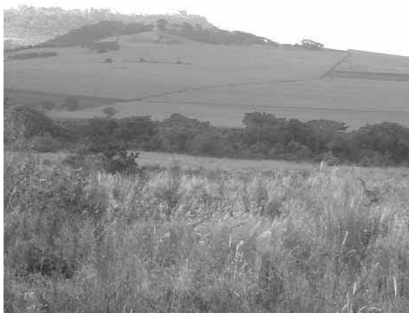
Figura 1 (B. Castro, 2008)