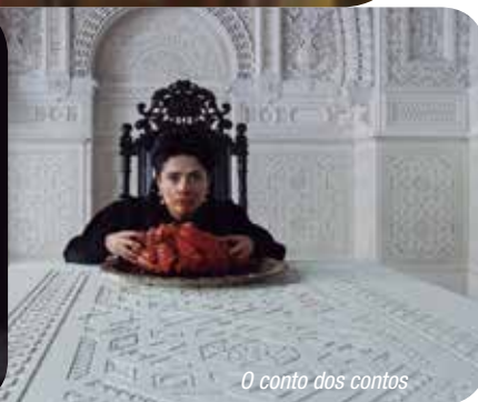
O conto dos contos