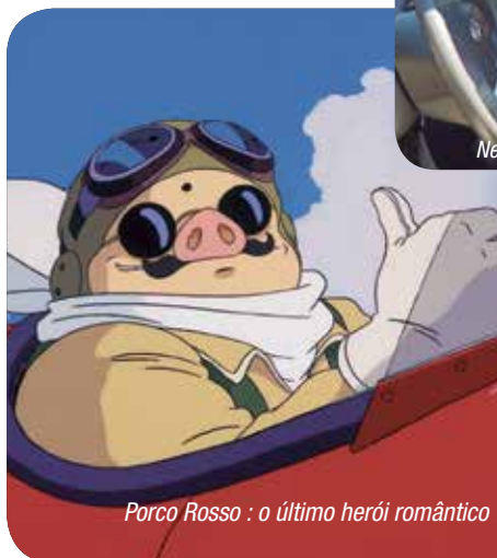
Porco Rosso : o último herói romântico