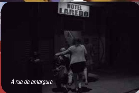
A rua da amargura