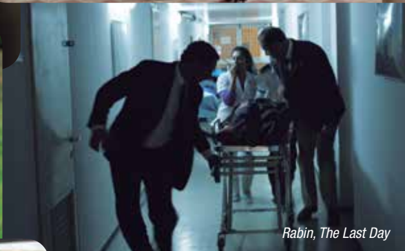
Rabin, The Last Day