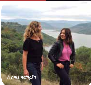
A bela estação