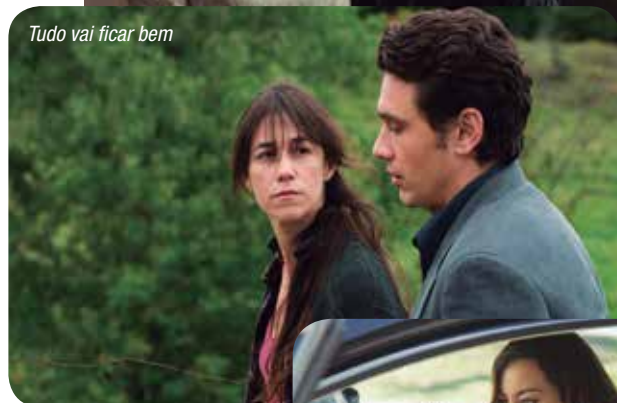
Tudo vai ficar bem