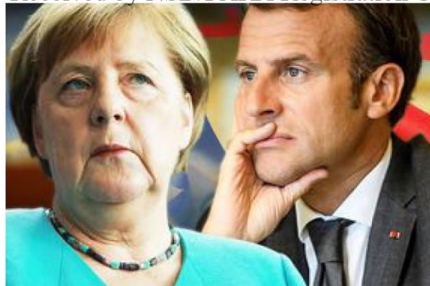
Trump to remove trade tariffs on UK - France and Germany foot the bill

(/news/world/1322380/brexit-news-latest-donald-trump-trade-tariffs-uk-greece-airbus-eu-news)