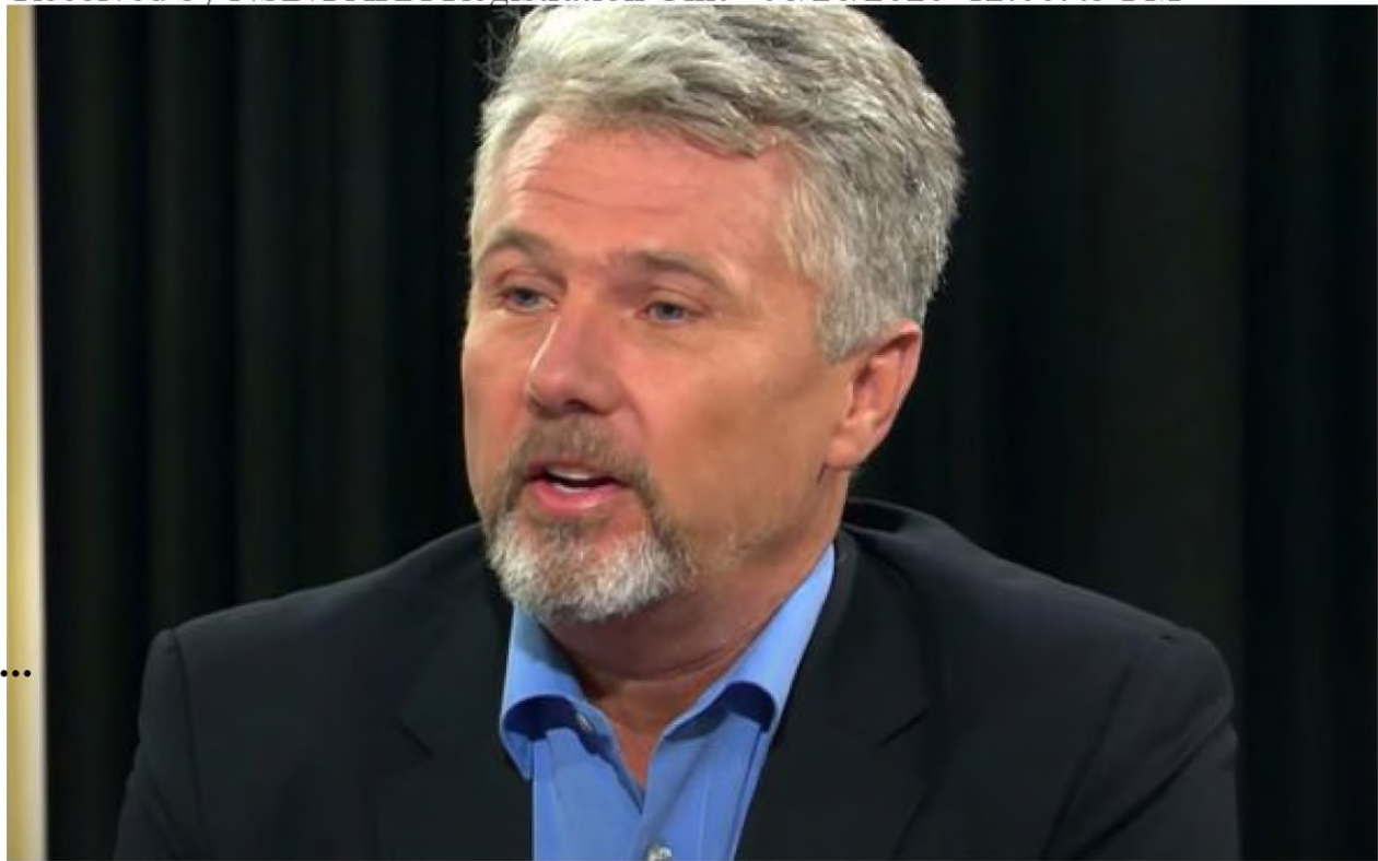
Angela Merkel has been "ignoring" the criticism for years