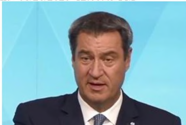
Germany second wave: Panic as 900 positive tests DELAYED

(/news/world/1322380/brexit-news-latest-donald-trump-trade-tariffs-uk-greece-airbus-eu-news)