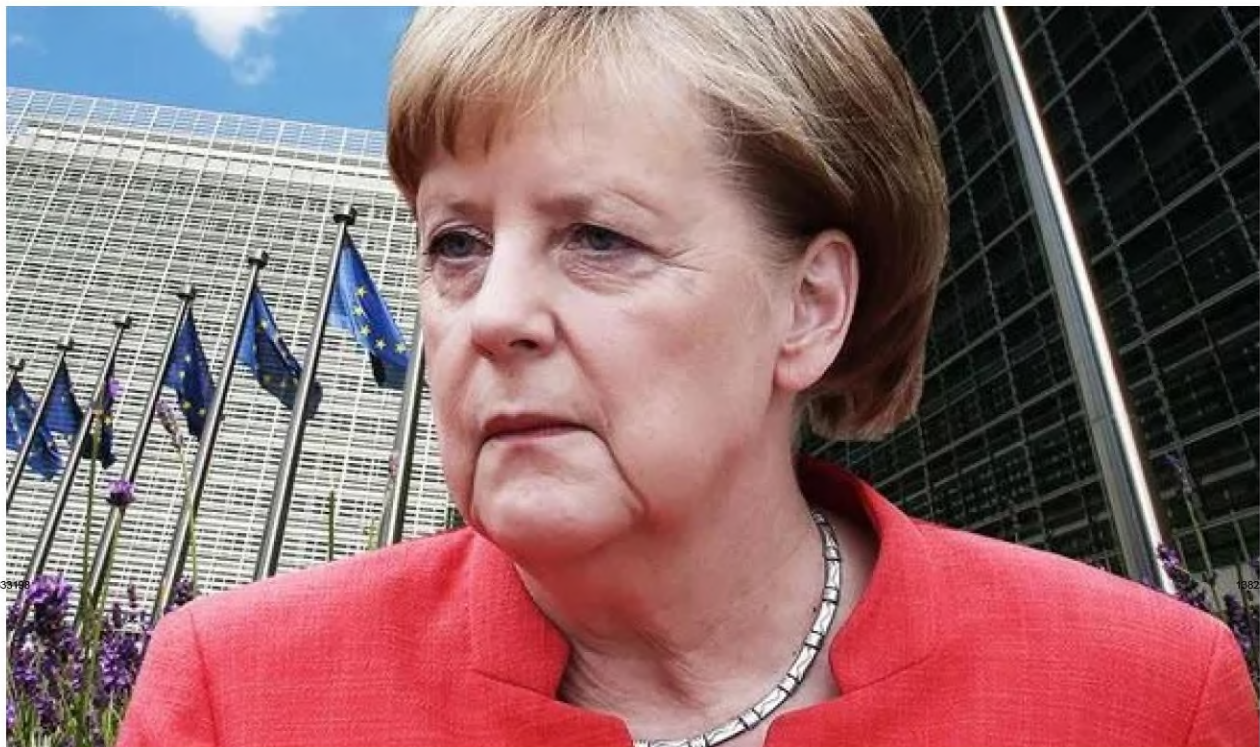
Angela Merkel has been warned to stand down on Nord Stream 2

JUST IN: Ireland forced to pay more than DOUBLE into EU coffers – as bloc panics without UK money ( https://www.express.co.uk/news/world/1322472/ireland-eu-budget-payments-brexit-news-irexit-news-eu-finances-latest )