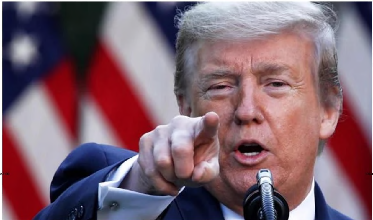
Donald Trump threatened to slap crippling sanctions on Rügen to stop Merkel (Image: GETTY)

"Trump may be gone but the next president is likely to sing the same tune."