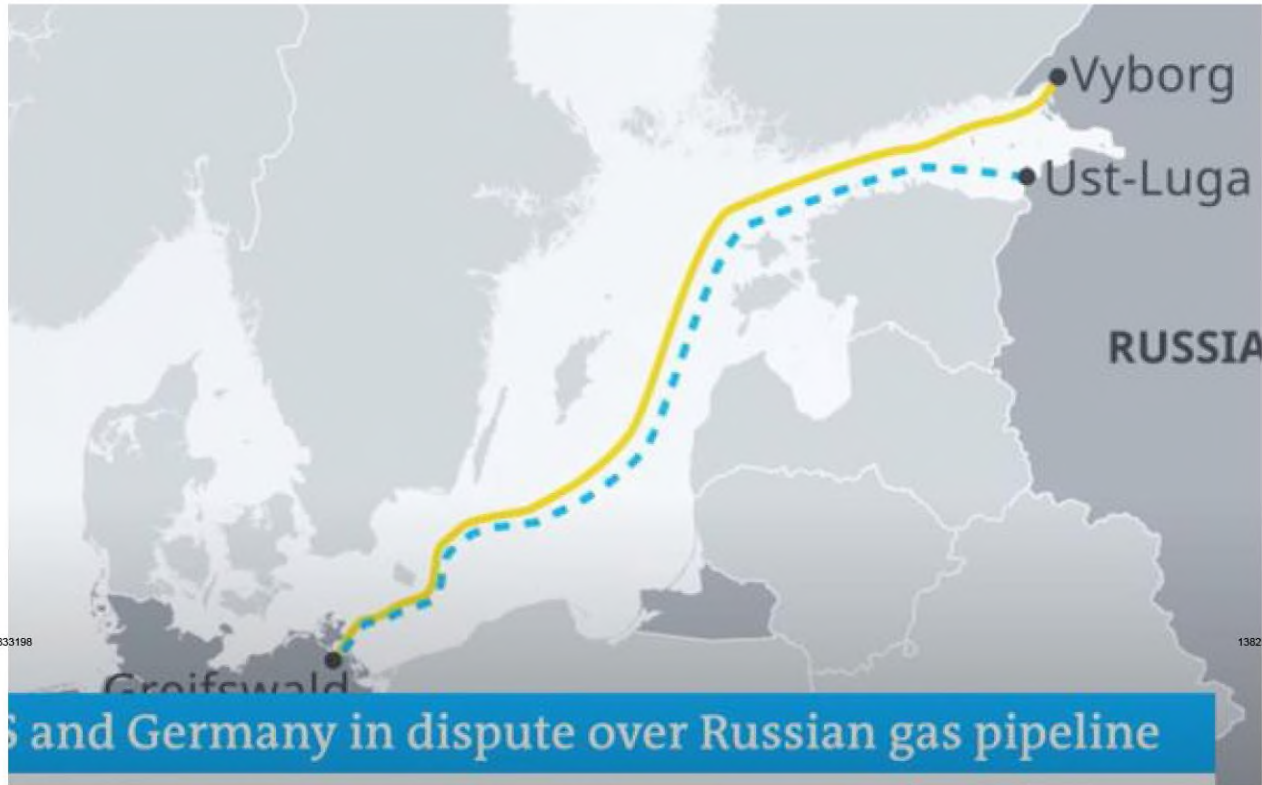
The Nord Stream 2 pipeline would connect Germany and Russia directly

Germany warned of 'slow progress' in recovery from coronavirus ( /news/world/1322993/eurozone-european-union-germany-economy-coronavirus-news-recovery )