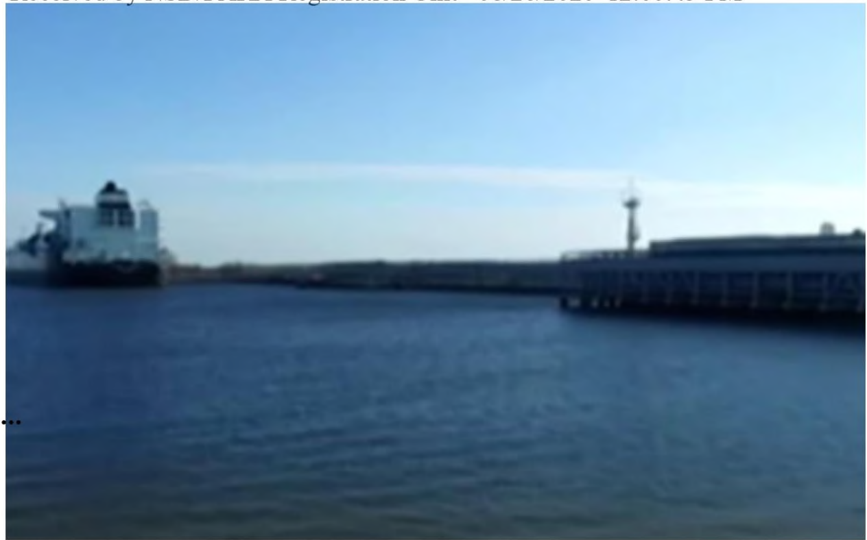
Nord Stream 2 has sparked economic and political concerns across the EU and the US