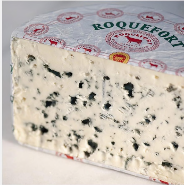
그림1. 로크포르 치즈 5

로크포르 치즈는 프랑스 아베롱주 (Department of Aveyron) 로크포르 지방 (Community of Roquefort)의 천연 석회암 동굴에서 양젖을 푸른곰팡이로 숙성시킨 블루치즈의 한 종류이다. 1 로마 제국의 카롤루스 대제 (Charlemagne)가 즐겨먹었고, 18세기 프랑스 계몽주의 시대의 철학자 드니 디드로 (Denis Diderot)와 장바티스트 르 롱 달랑베르 (Jean-Baptiste le Rond d'Alembert)로부터 “치즈의 왕 (le roi des fromages)”이라는 극찬을 받은 바 있는 로크포르 치즈는 1411년 프랑스 국왕 샤를 6세 (Charles VI)가 로크포르 주민들에게 독점 생산권을 부여했다고 한다. 2 1666년에는 툴루즈 (Toulouse) 의회가 가짜 로크포르 치즈 판매자들을 벌했다는 기록도 전해진다. 3 로크포르 치즈는 1925년부터 프랑스의 원산지 통제 명칭 (Appellation d'Origine Contrôlée (AOC)) 제도로 보호를 받기 시작한 최초의 치즈로 역사적 유서가 깊다. 4