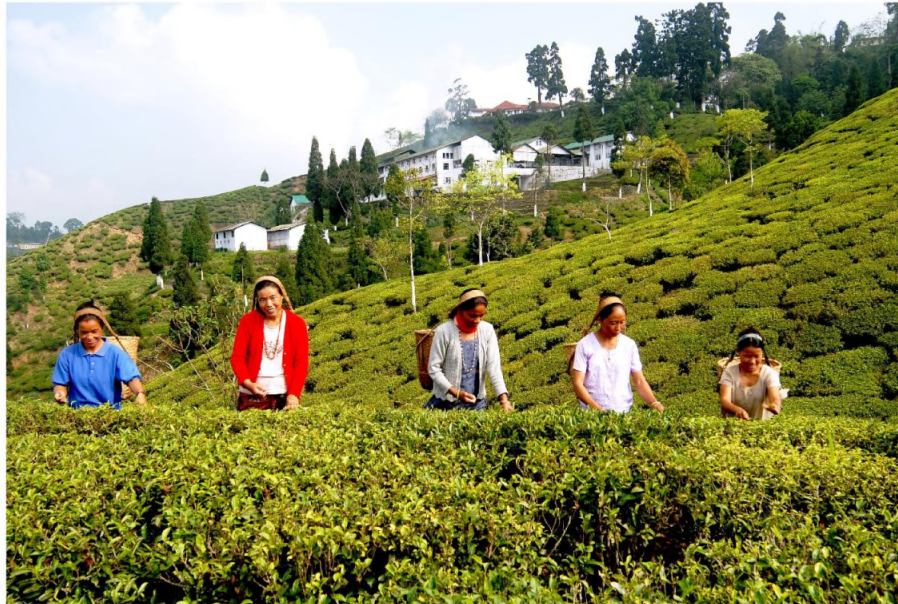
그림6. 다즐링 홍차 다원 30

인도 차 위원회는 “차 (tea)”를 지정상품으로 기재한 지리적 표시 증명표장을 “DARJEELING” 로고에 대한 디자인표장 (등록번호 1,632,726)과 표준문자표장 (등록번호 2,685,923) 형태로 미국 특허상표청에 출원·등록했다. 31 1991년 1월 22일에 등록된 디자인표장의 인증사항 진술서는 “증명표장권자의 허락 하에 의해 사용될 때 이 표장은 해당 혼합차에 100% 인도 다즐링 지역에서 생산되는 하나 이상의 차 품종이 포함되며, 증명표장권자가 제정한 다른 규격 요건에도 부합함을 인증한다. (THE CERTIFICATION MARK, AS USED BY PERSONS AUTHORIZED BY CERTIFIER, CERTIFIES THAT A BLEND OF TEA CONTAINS AT LEAST ONE HUNDRED PERCENT (100%) TEA ORIGINATING IN THE DARJEELING REGION OF INDIA, AND THAT THE BLEND MEETS OTHER SPECIFICATIONS ESTABLISHED BY THE CERTIFIER.)”로 확인된다. 2003년 2월 11일에 등록된 “DARJEELING” 표준문자표장도 인증사항 진술서 내용이 이와 거의 같다.