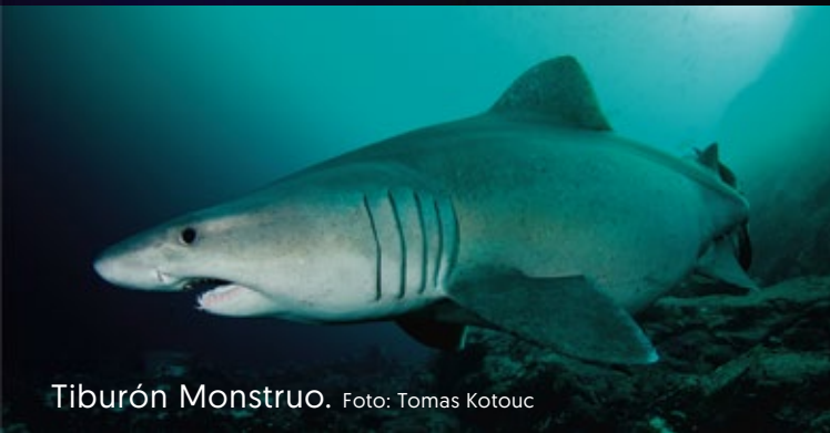
Tiburón Monstruo.