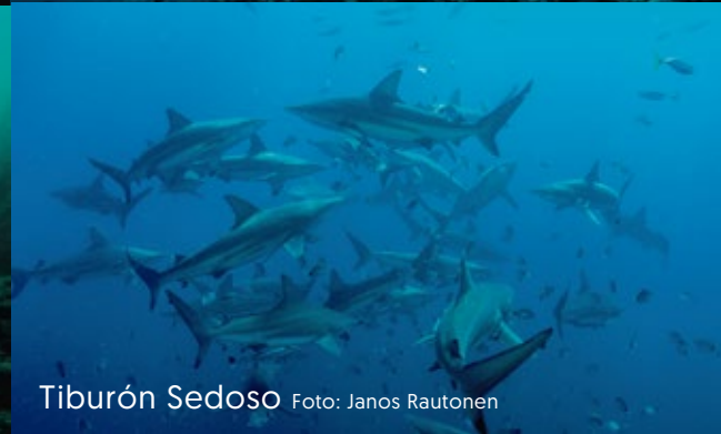
Tiburón Sedoso