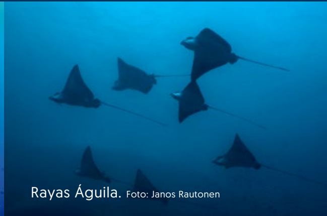
Rayas Águila.