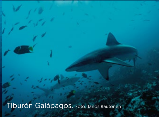
Tiburón Galápagos.