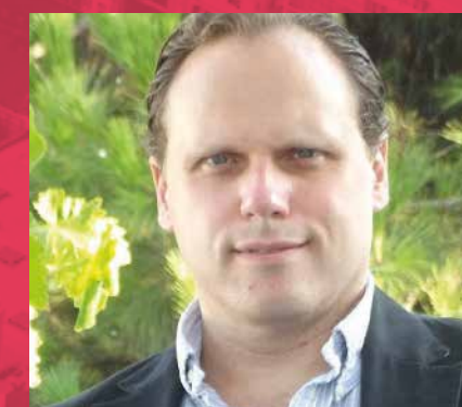
Daniel Lacalle, Economista