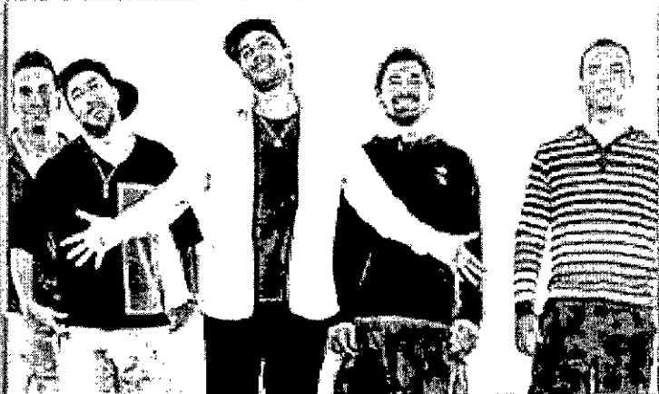
Jeito Moleque 31/01/2016