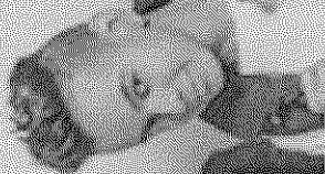
LIVRES PARA ADORAR JULIANO SON