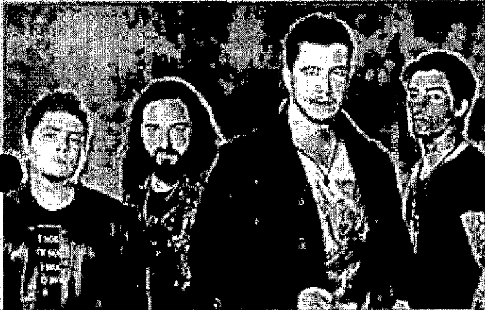
Banda Malta 30/01/2016