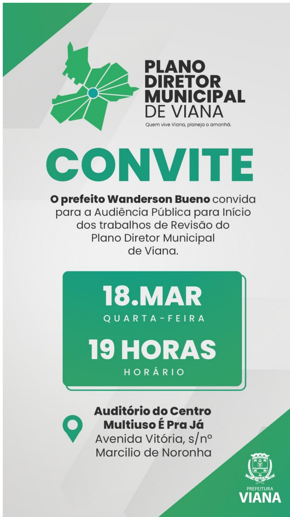
Figura 3- Cartaz de divulgação.