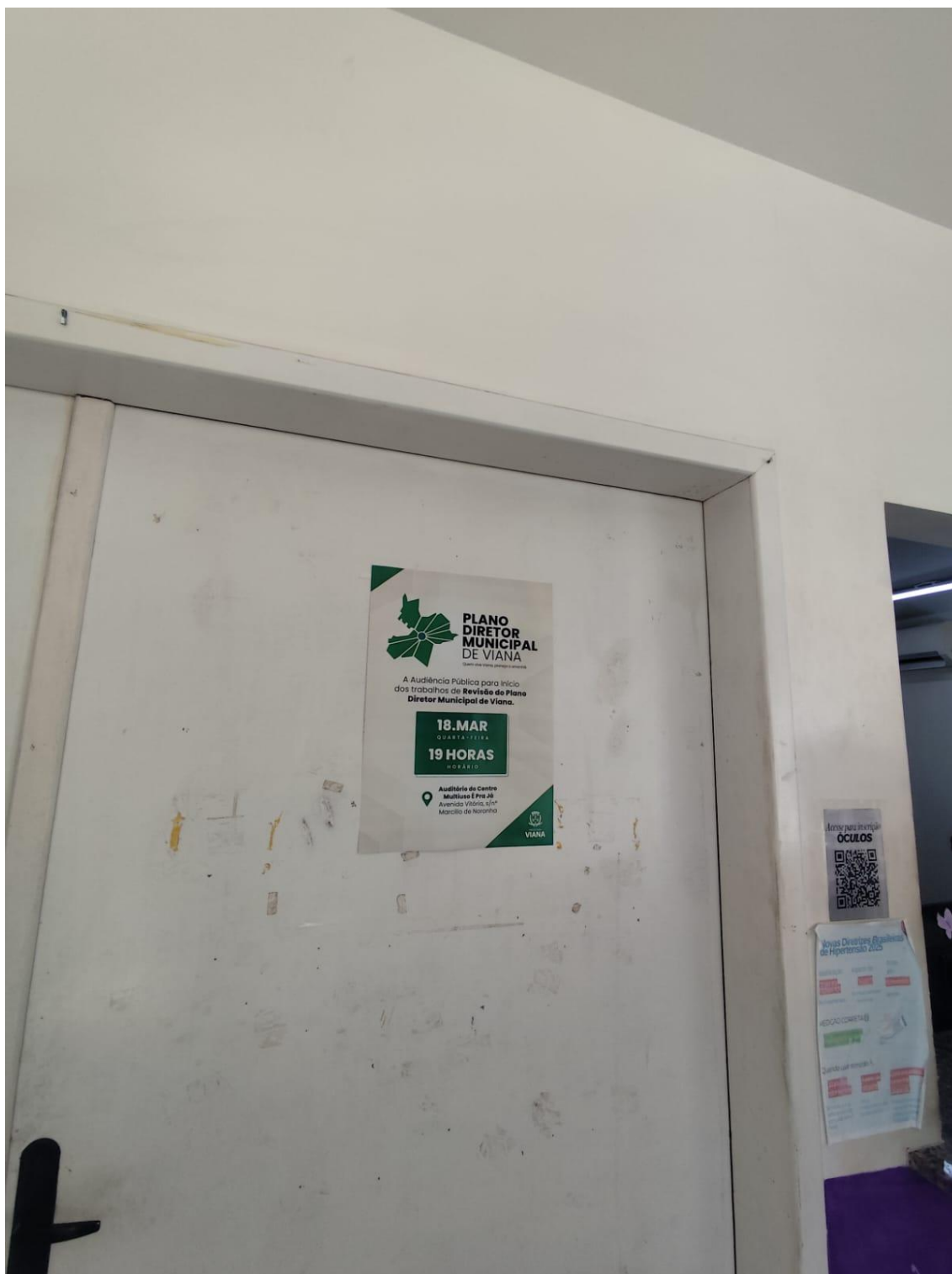
Figura 14- Registro da afixação de cartaz pela SEMDUH para divulgação da audiência – PA ARLINDO VILLASCHI.