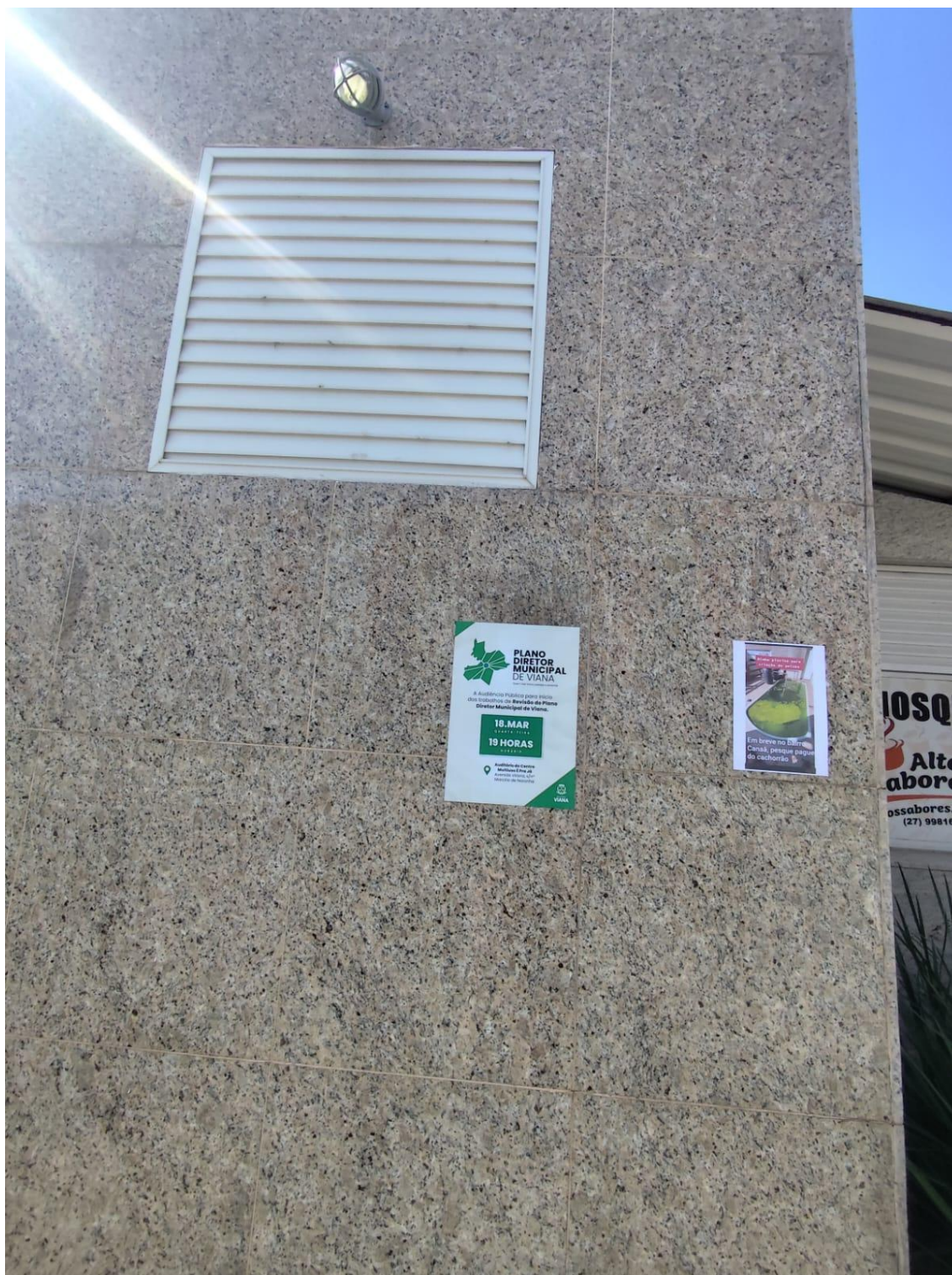
Figura 20- Registro da afixação de cartaz pela SEMDUH para divulgação da audiência – PARQUE LINEAR.