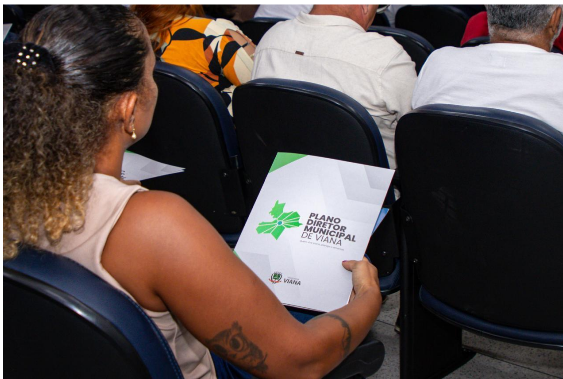
Figura 28- Registro da audiência pública de início da revisão do Plano Diretor.

Adicionalmente, seguem anexos a lista de presença dos participantes e a ata da audiência pública, para fins de comprovação e registro.