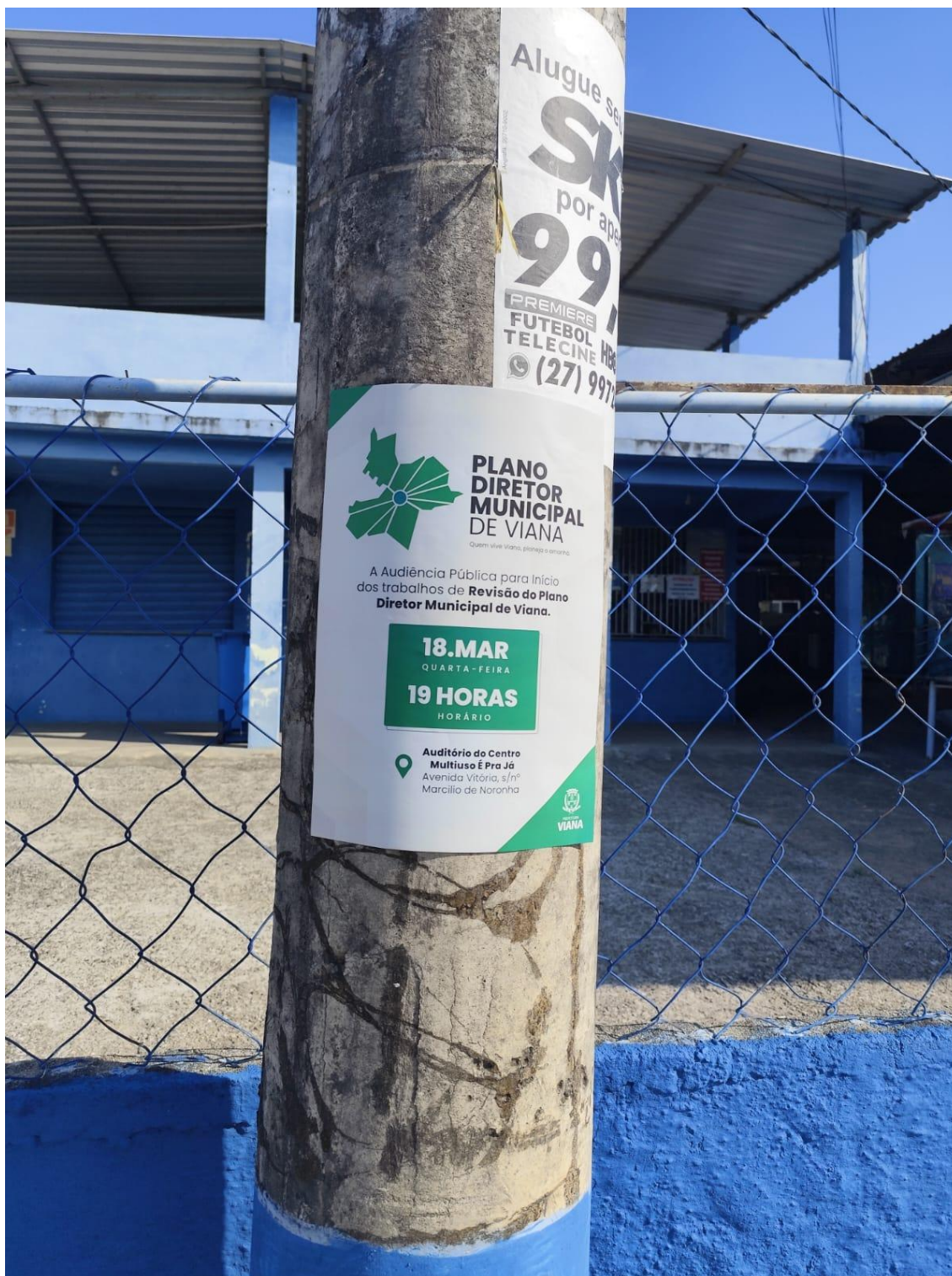
Figura 24- Registro da afixação de cartaz pela SEMDUH para divulgação da audiência – QUADRA DO ERILDO.