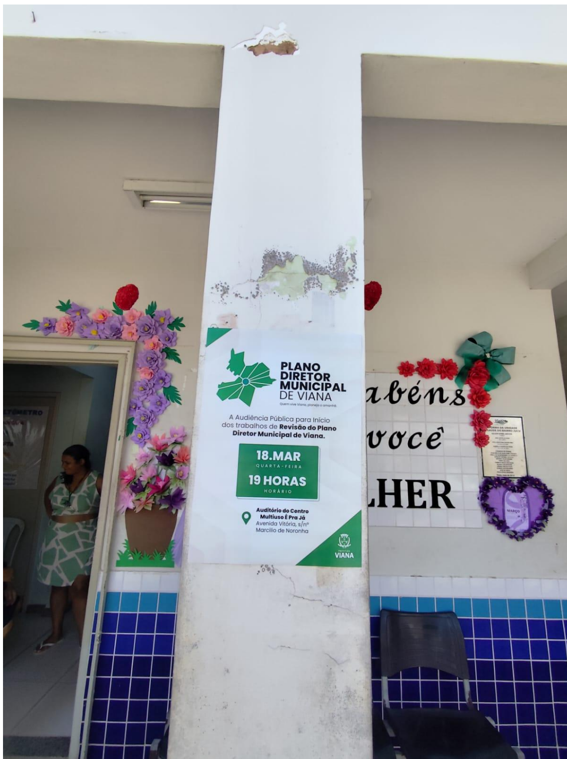
Figura 7- Registro da afixação de cartaz pela SEMDUH para divulgação da audiência – UBS JUCU.