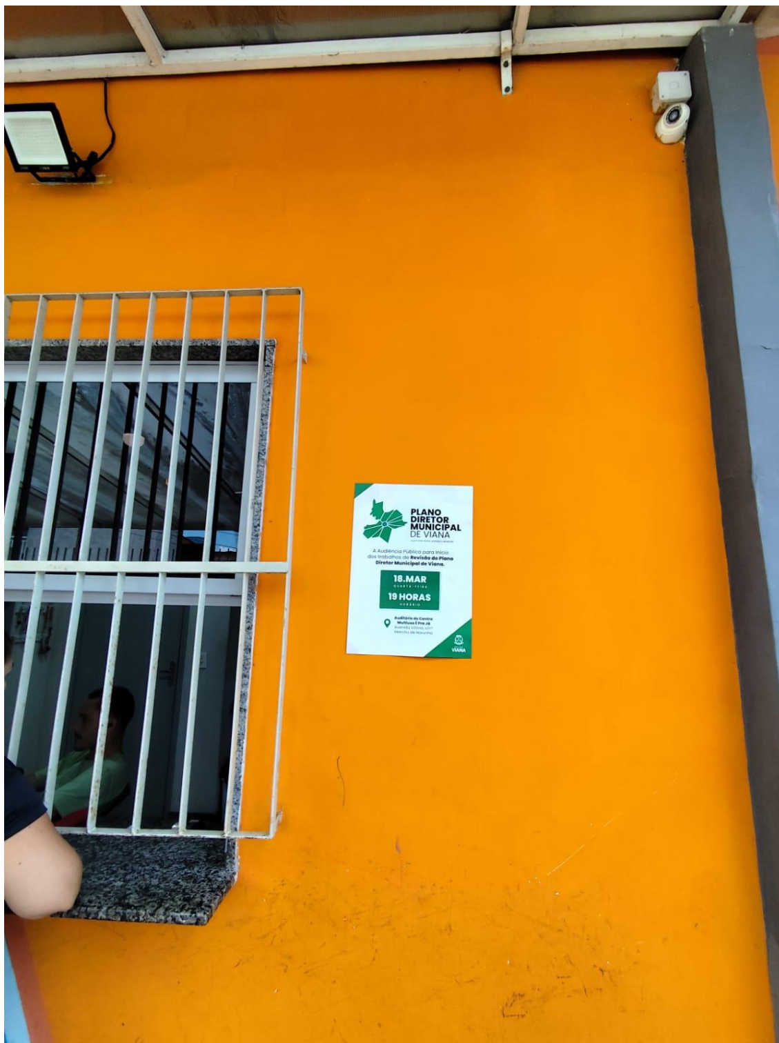
Figura 10- Registro da afixação de cartaz pela SEMDUH para divulgação da audiência – EMEF TANCREDO NEVES – NOVA BETHÂNIA.