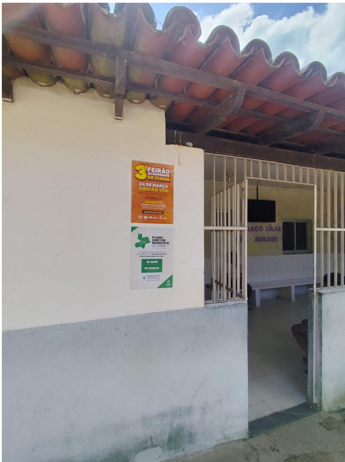
Figura 8- Registro da afixação de cartaz pela SEMDUH para divulgação da audiência – UBS ARAÇATIBA.