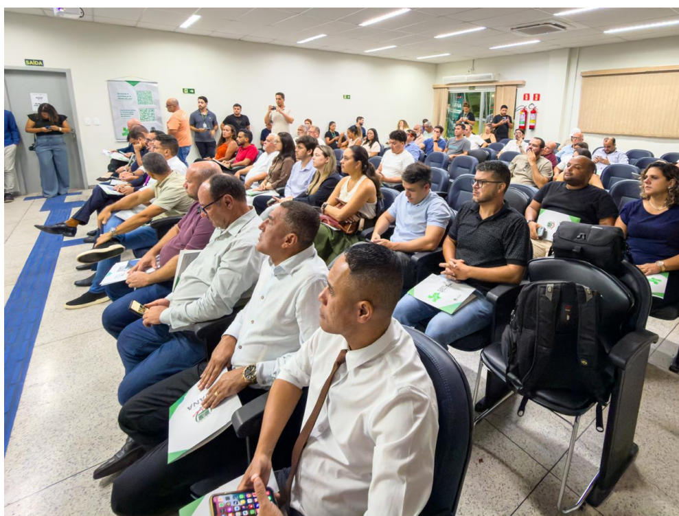
Figura 33 e 34- Registro da audiência pública de início da revisão do Plano Diretor.