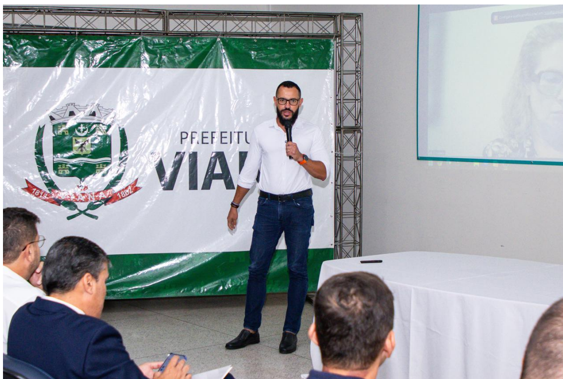
Figura 31 e 32- Registro da audiência pública de início da revisão do Plano Diretor.