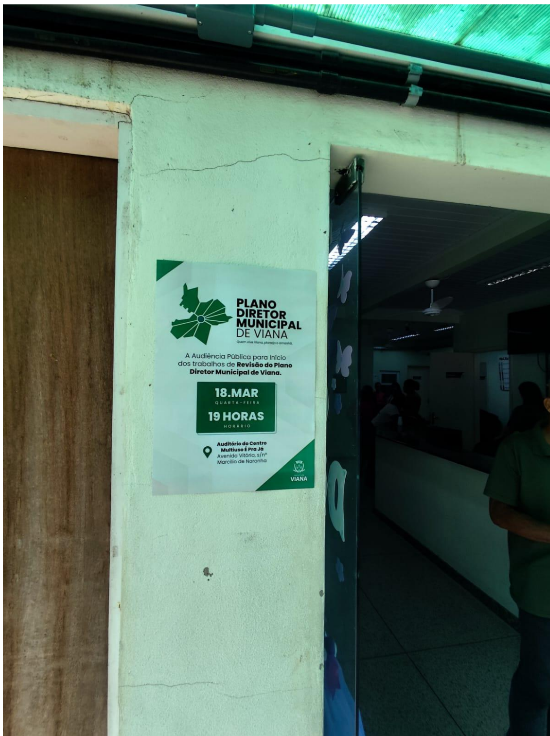
Figura 22- Registro da afixação de cartaz pela SEMDUH para divulgação da audiência – UBS IPANEMA.