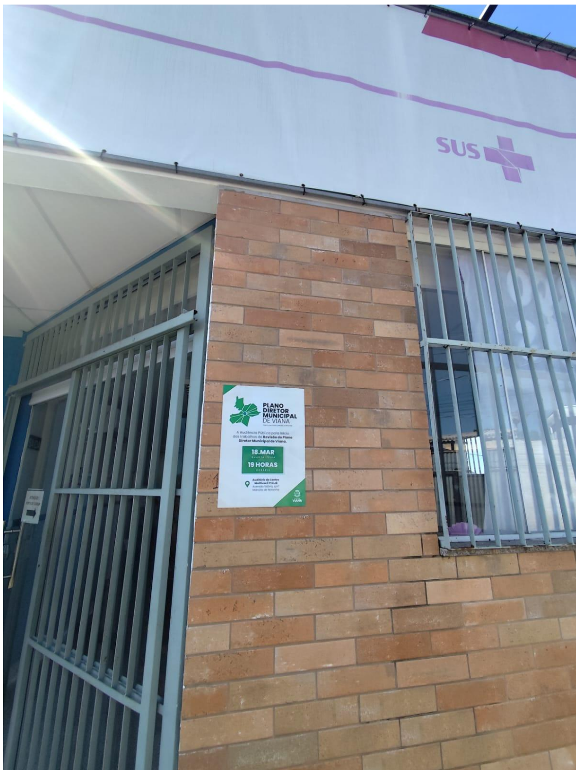
Figura 26- Registro da afixação de cartaz pela SEMDUH para divulgação da audiência – UBS CANAÃ.