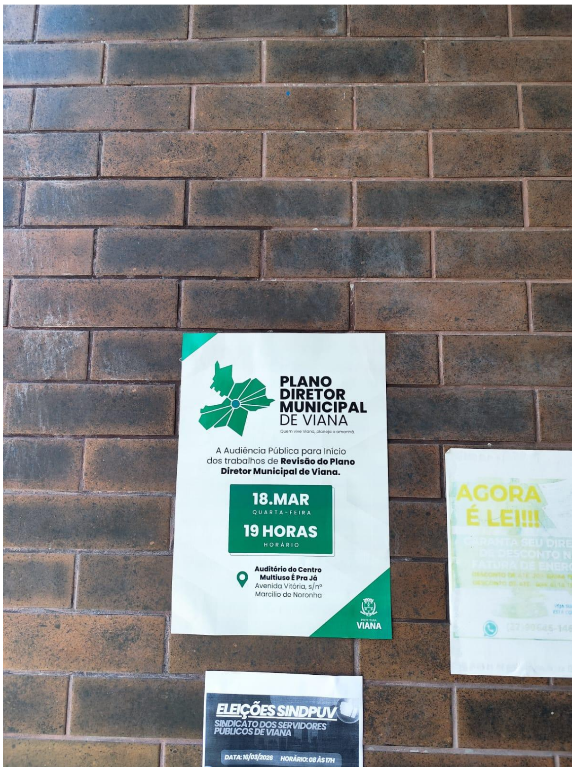
Figura 12- Registro da afixação de cartaz pela SEMDUH para divulgação da audiência – UBS MORADA DE BETHÂNIA.