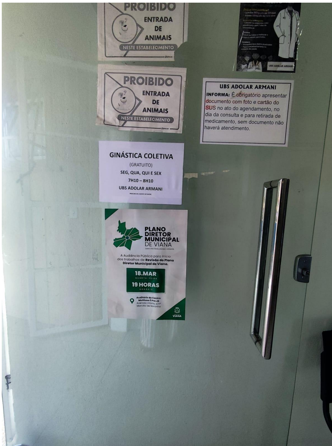
Figura 17- Registro da afixação de cartaz pela SEMDUH para divulgação da audiência – UBS MARCILIO 2.