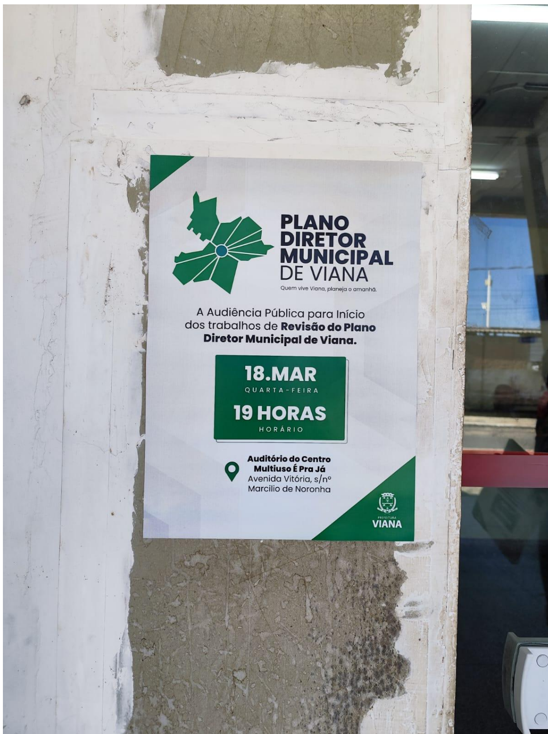
Figura 19- Registro da afixação de cartaz pela SEMDUH para divulgação da audiência – POLICLINICA - PRIMAVERA.