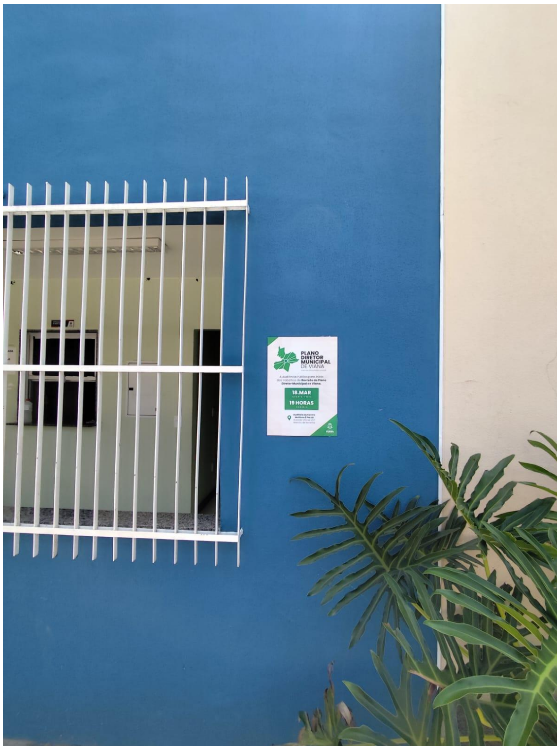
Figura 9- Registro da afixação de cartaz pela SEMDUH para divulgação da audiência – UBS A.