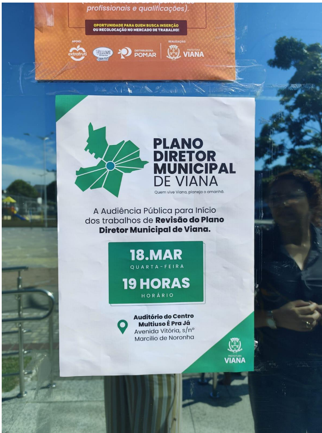
Figura 18- Registro da afixação de cartaz pela SEMDUH para divulgação da audiência – EPRAJÁ.