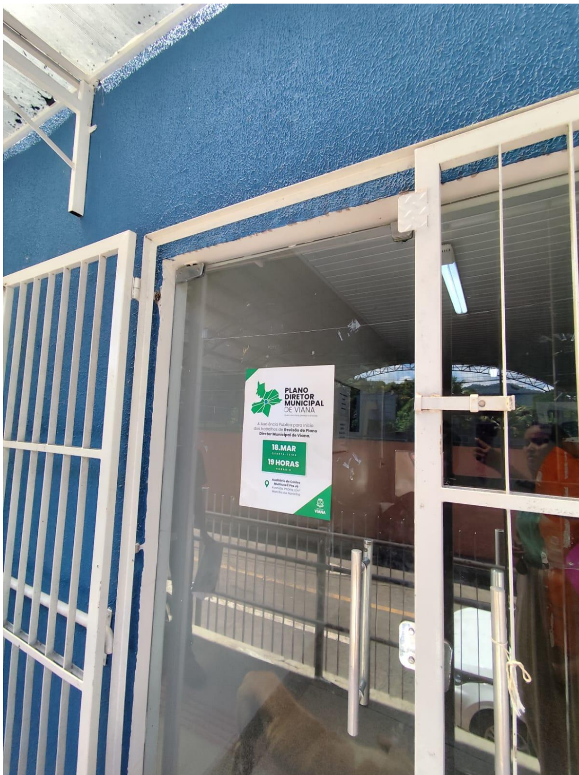
Figura 6- Registro da afixação de cartaz pela SEMDUH para divulgação da audiência – UBS BOM PASTOR.