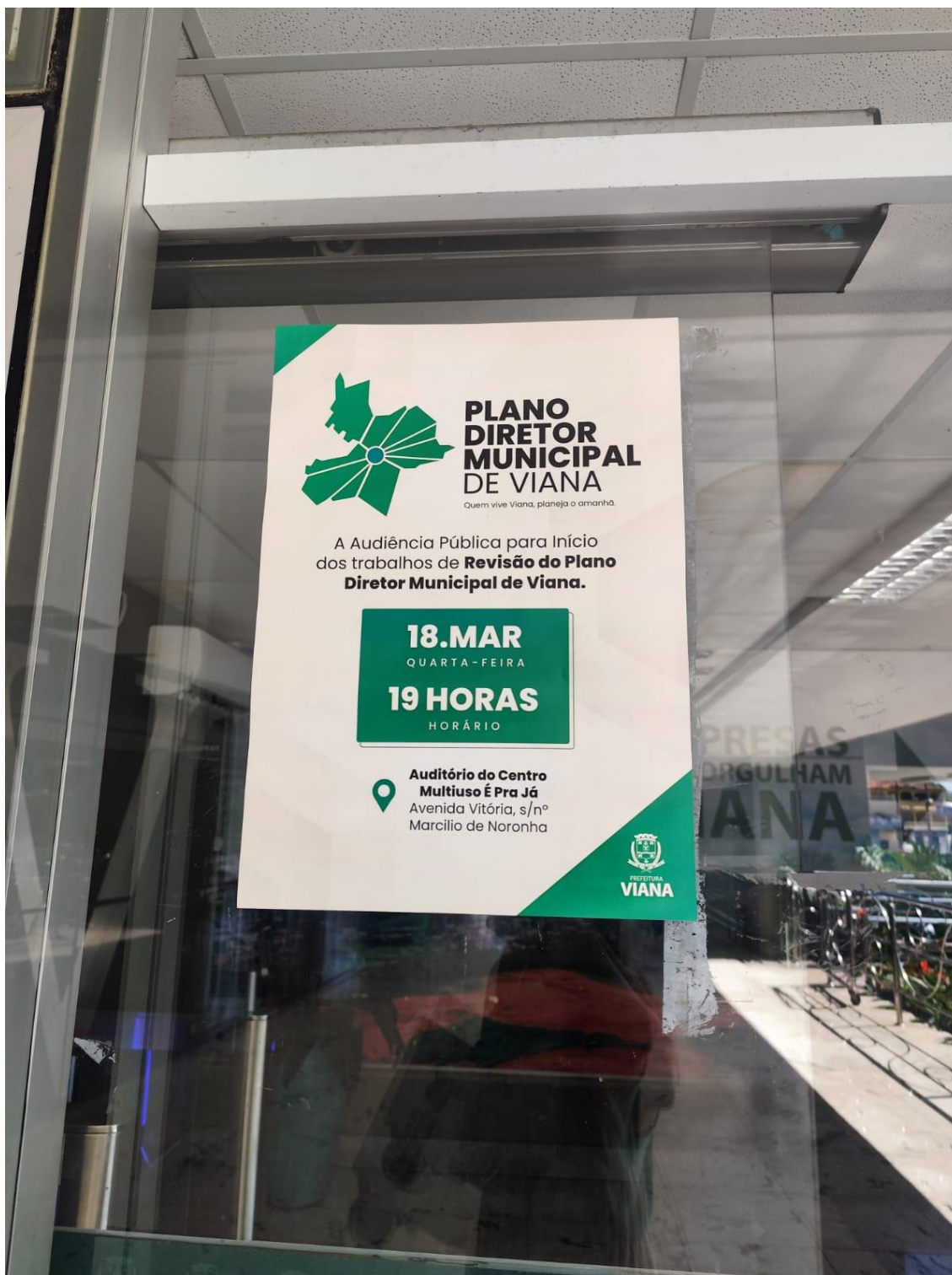
Figura 4- Registro da afixação de cartaz pela SEMDUH para divulgação da audiência – Prefeitura Municipal de Viana.

Adicionalmente, foram afixados cartaz informativos em todos os bairros do município, em locais de ampla circulação, como escolas e unidades de saúde, no dia 16 de março de 2026, conforme registrado nas imagens a seguir.