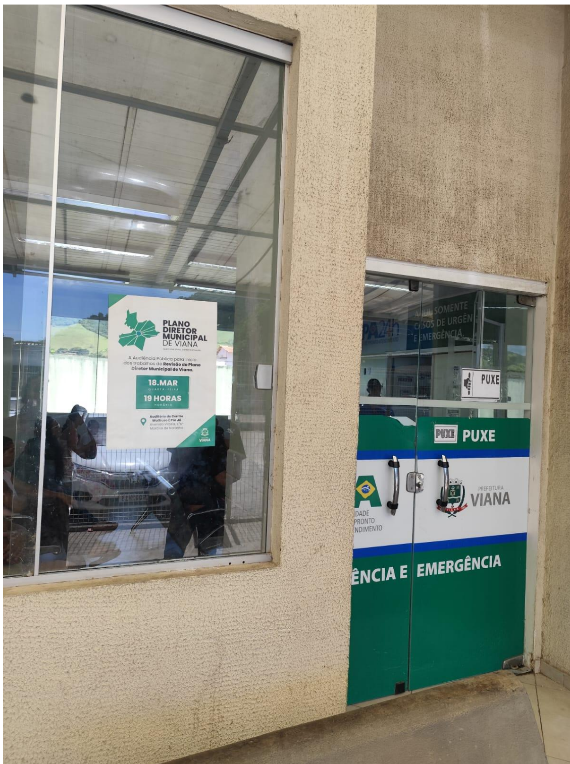
Figura 5- Registro da afixação de cartaz pela SEMDUH para divulgação da audiência – UPA CENTRO.