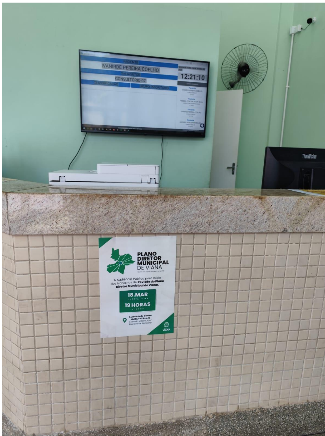
Figura 15- Registro da afixação de cartaz pela SEMDUH para divulgação da audiência – UBS VILA BETHÂNIA.