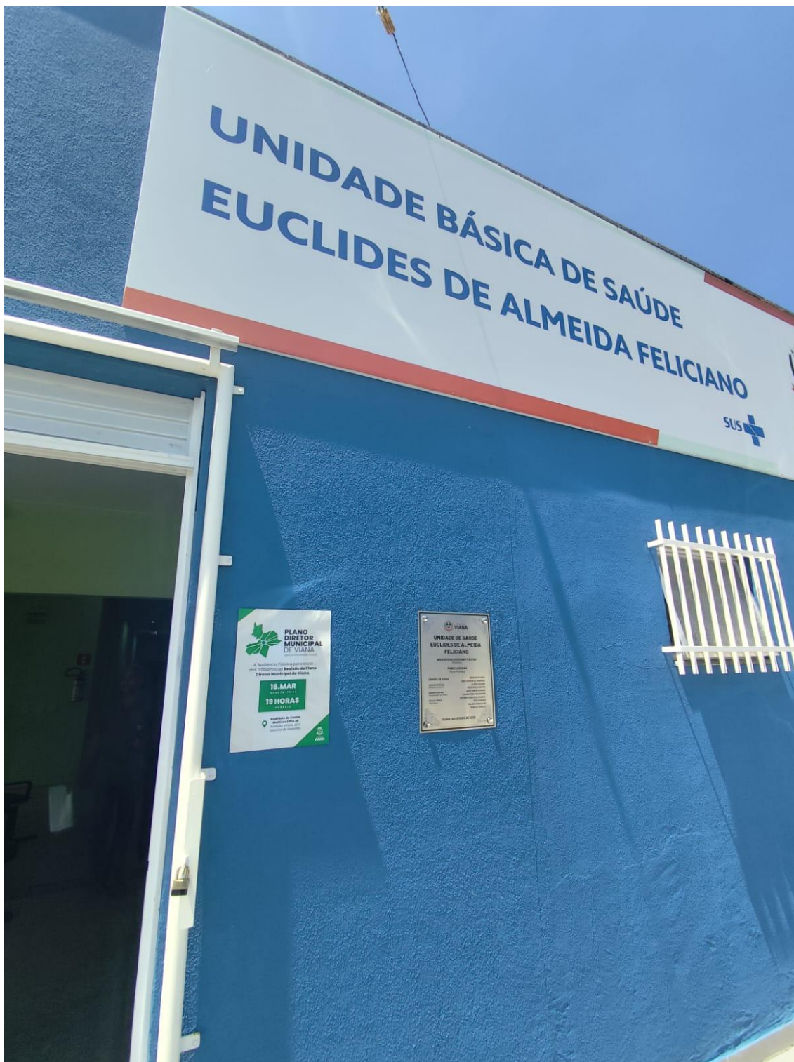
Figura 13- Registro da afixação de cartaz pela SEMDUH para divulgação da audiência – UBS CAMPO VERDE.