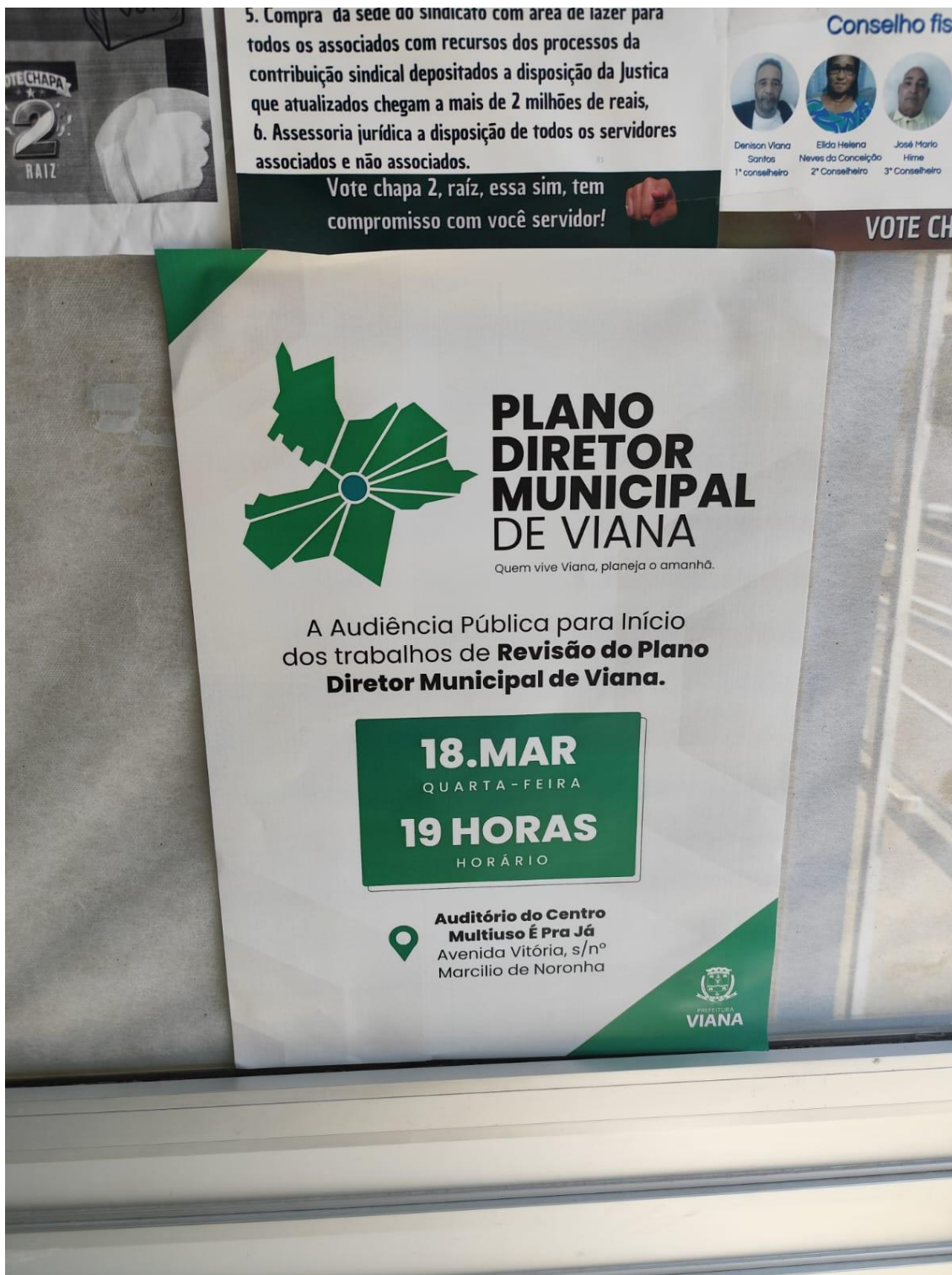
Figura 23- Registro da afixação de cartaz pela SEMDUH para divulgação da audiência – REGIÃO RURAL/FORMATE/ PIAPINTANGUI.