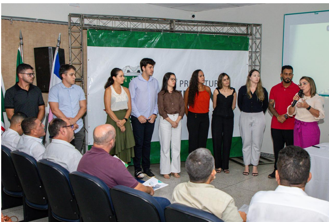
Figura 29 e 30- Registro da audiência pública de início da revisão do Plano Diretor.