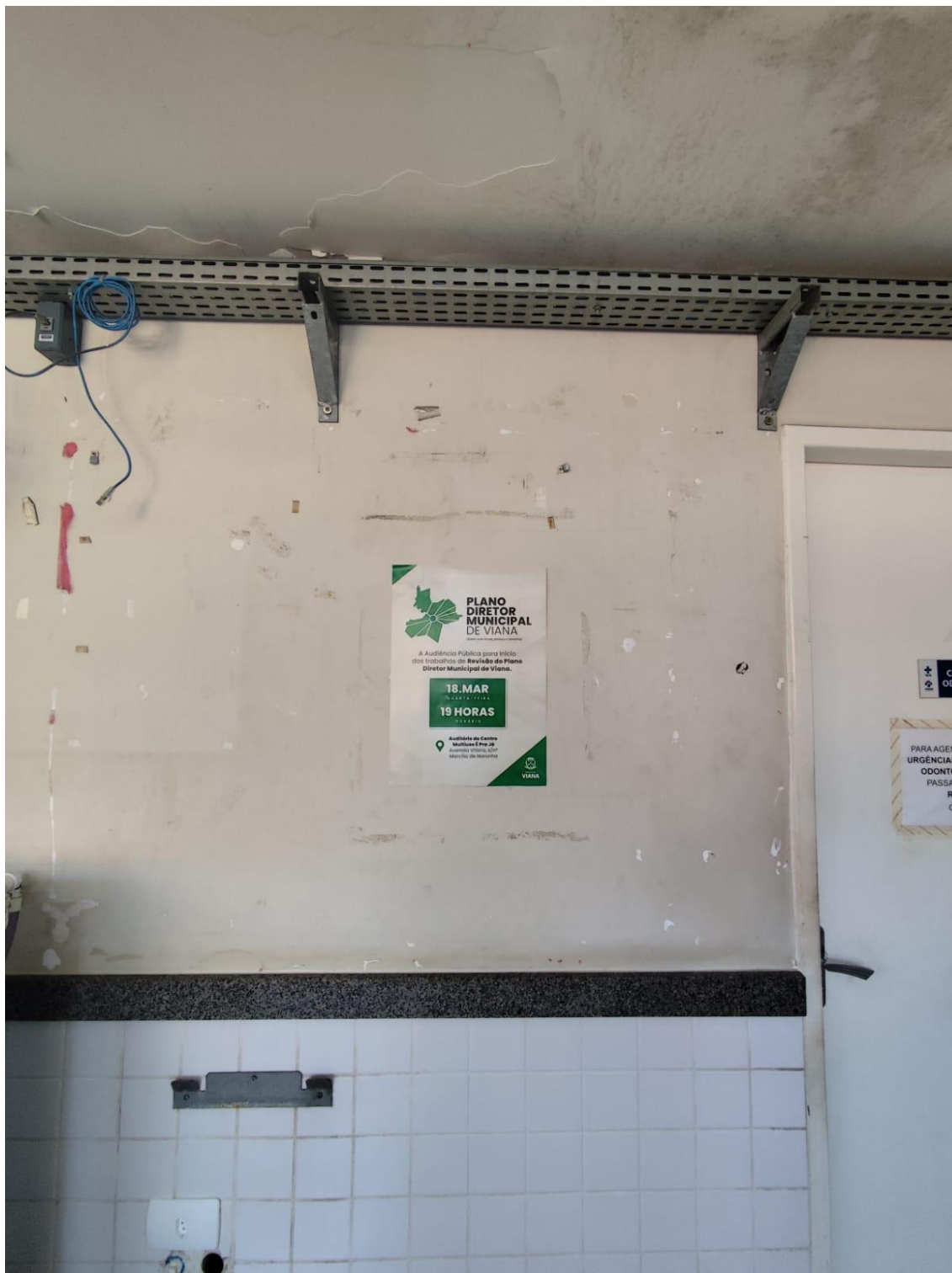
Figura 11- Registro da afixação de cartaz pela SEMDUH para divulgação da audiência – UBS – NOVA BETHÂNIA.