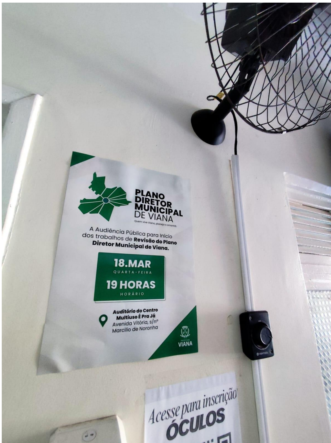
Figura 25- Registro da afixação de cartaz pela SEMDUH para divulgação da audiência – EMEF PIAPITANGUI.