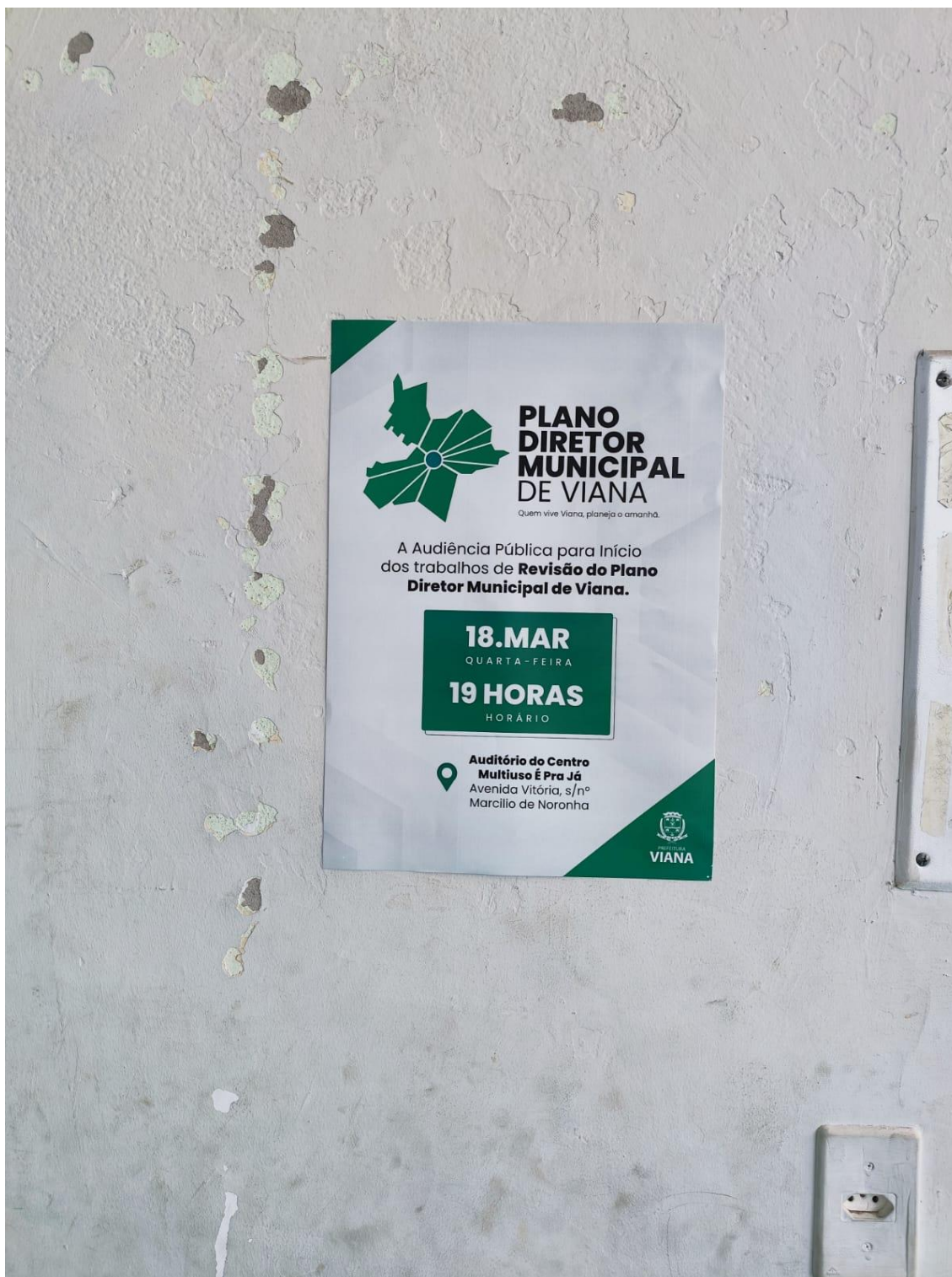
Figura 16- Registro da afixação de cartaz pela SEMDUH para divulgação da audiência – EMEF SOTECO.