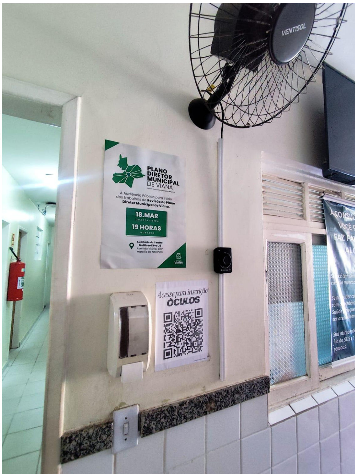
Figura 21- Registro da afixação de cartaz pela SEMDUH para divulgação da audiência – UBS UNIVERSAL.