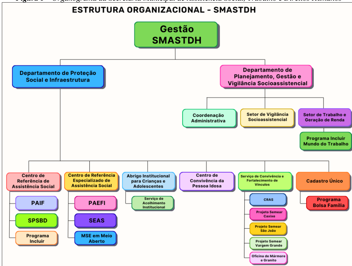
Figura 1 – Organograma da Secretaria Municipal de Assistência Social, Trabalho e Direitos Humanos