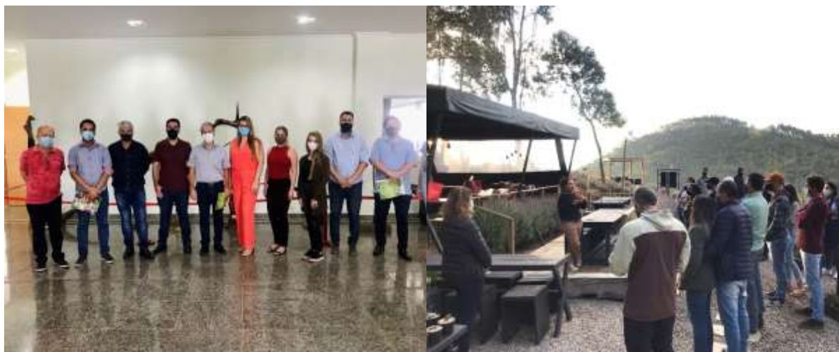
Imagem 04: Visitas Técnicas, da esquerda para a direita: Equipe de Iconha/ES, vereador de Minas Gerais, Prefeito e equipe do Município de São Gonçalo do Rio Abaixo/MG e empreendedores de Piaçú, Muniz Freire/ES.

Em 2021 foram recebidas visitas técnicas envolvendo a Secretaria Municipal de Turismo, Cultura e Artesanato. As equipes foram recepcionadas e acompanhadas por atrativos do Município, entre elas os servidores de Iconha/ES, o Prefeito e secretários do Município de São Gonçalo do Rio Abaixo/MG, empreendedores de Piaçú (Muniz Freire) e um vereador de Minas Gerais que visitou a Câmara Municipal quando na oportunidade participamos apresentando o trabalho desenvolvido pela pasta.