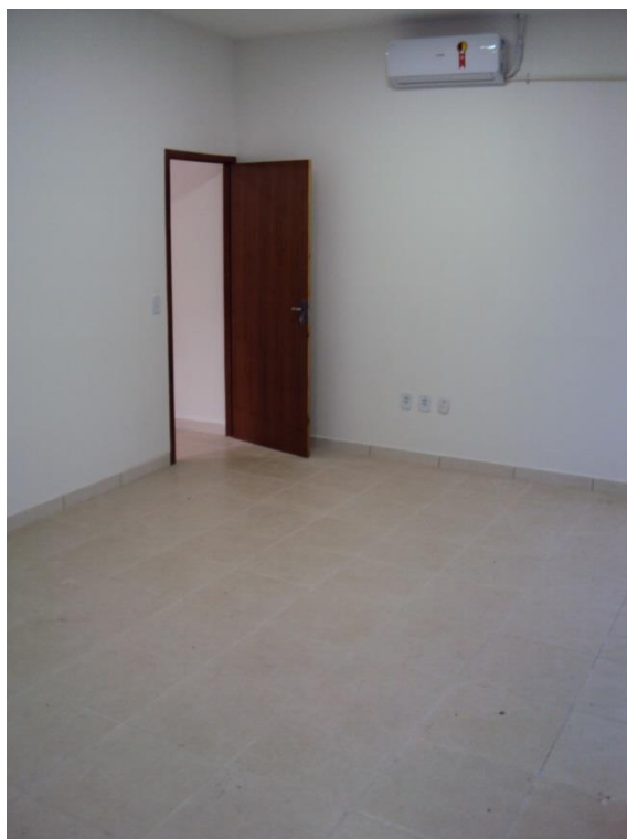
IMAGEM - 04