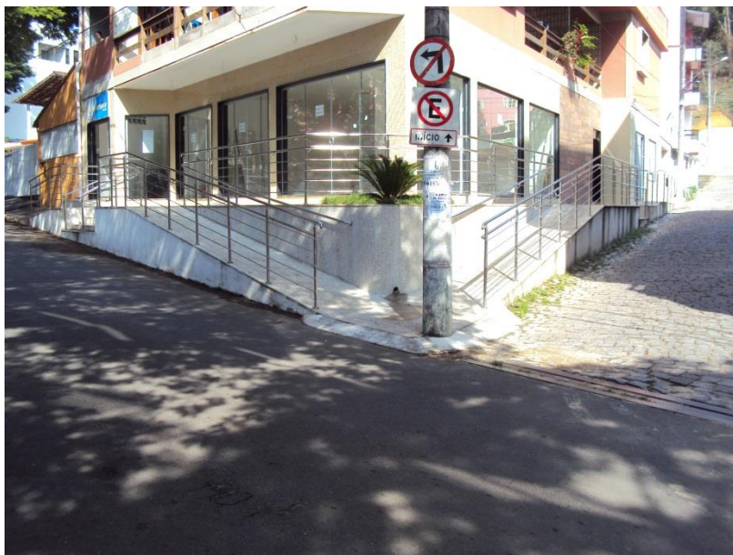
IMAGEM - 01