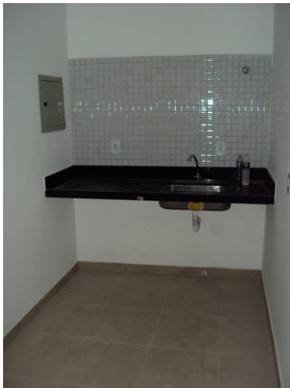
IMAGEM - 03