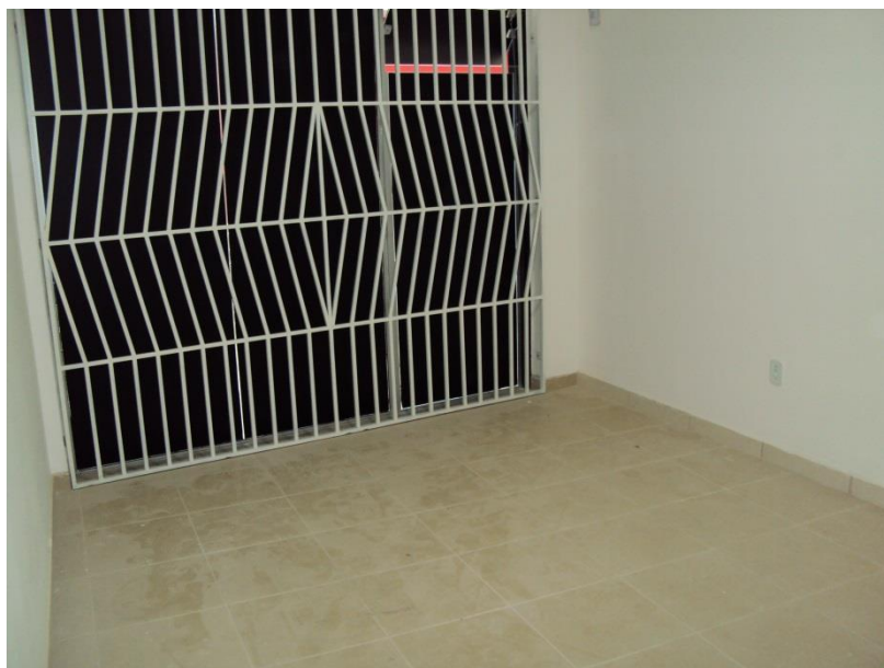
IMAGEM - 06

Vargem Alta-ES, 24 de fevereiro de 2026.