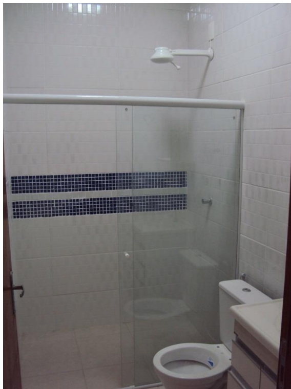
IMAGEM - 05