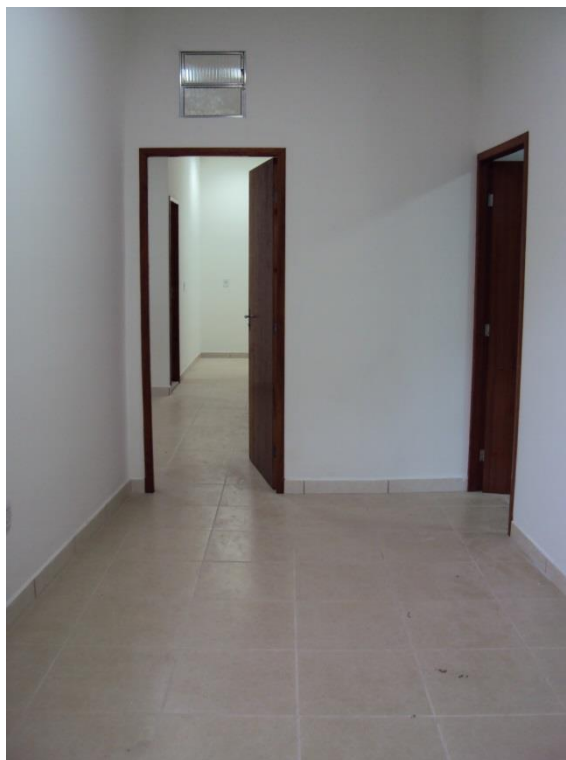
IMAGEM - 02