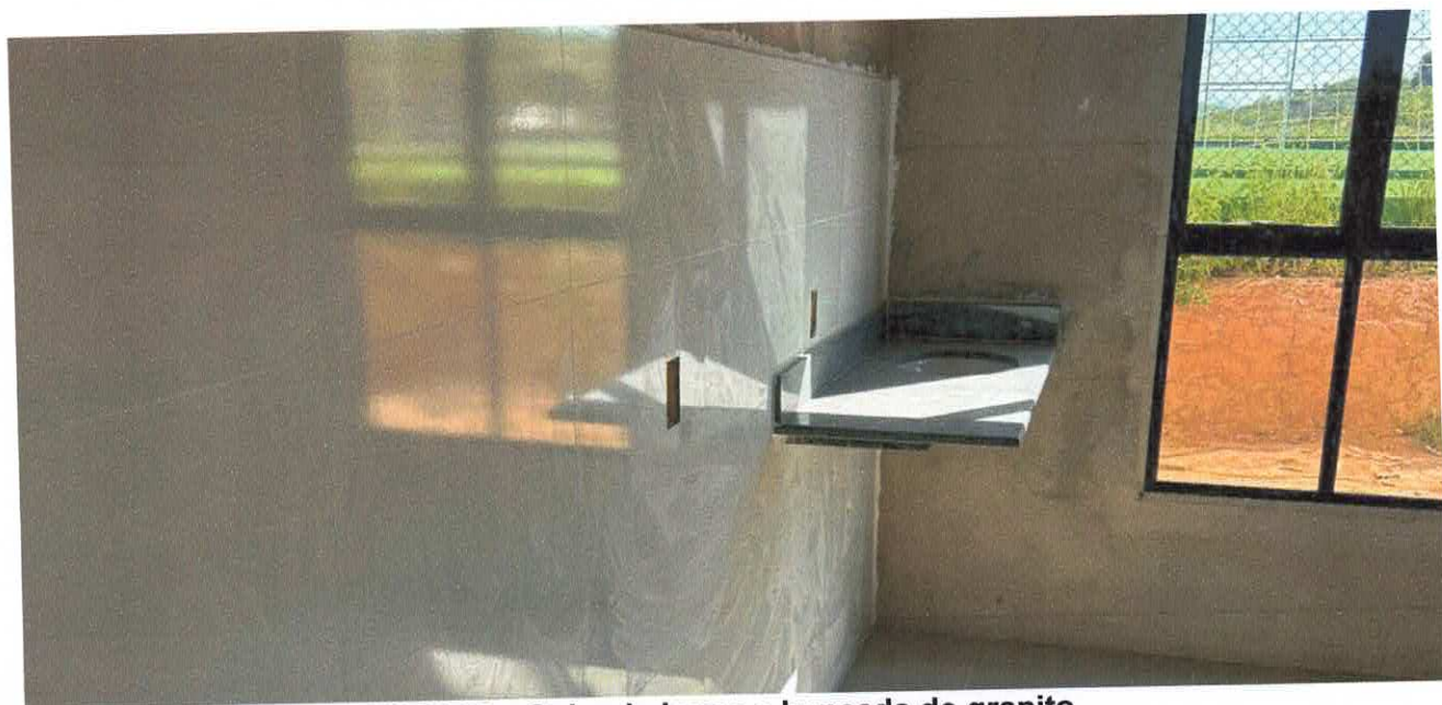
FOTO 08 - Cuba de louça e bancada de granito.

São Domingos do Norte, 05 de Fevereiro de 2025.