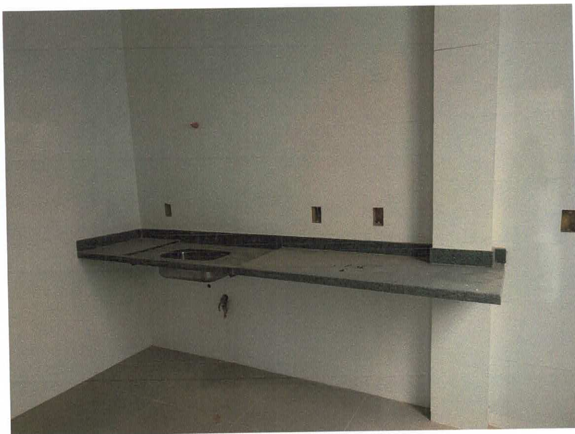
FOTO 02 – Copa com revestimento em parede e piso, bancada de granito, rodabanca e cuba inox;