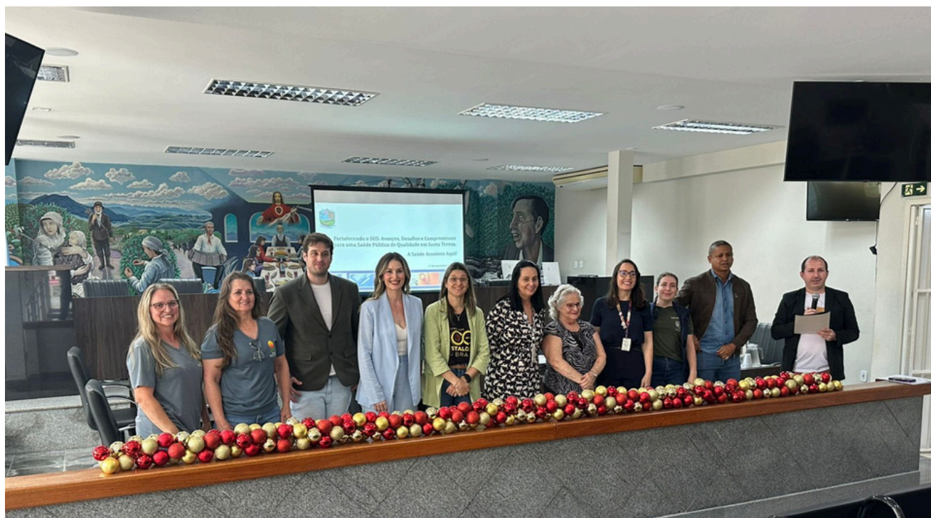
Imagem 06: Conselheiros Municipais de Saúde presentes.