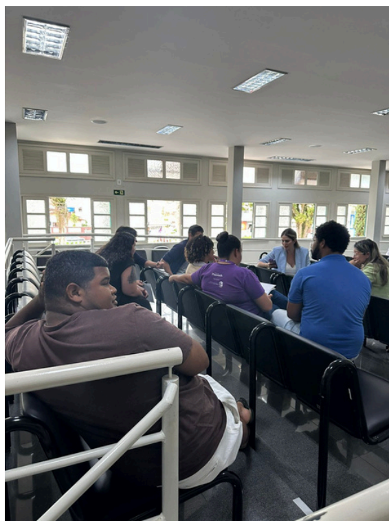
Imagens 07, 08 e 09: Trabalhos/Oficinas em grupo para discussão dos Eixos Temáticos.