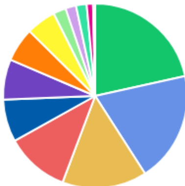
DFDs POR ÁREA DEMANDANTE