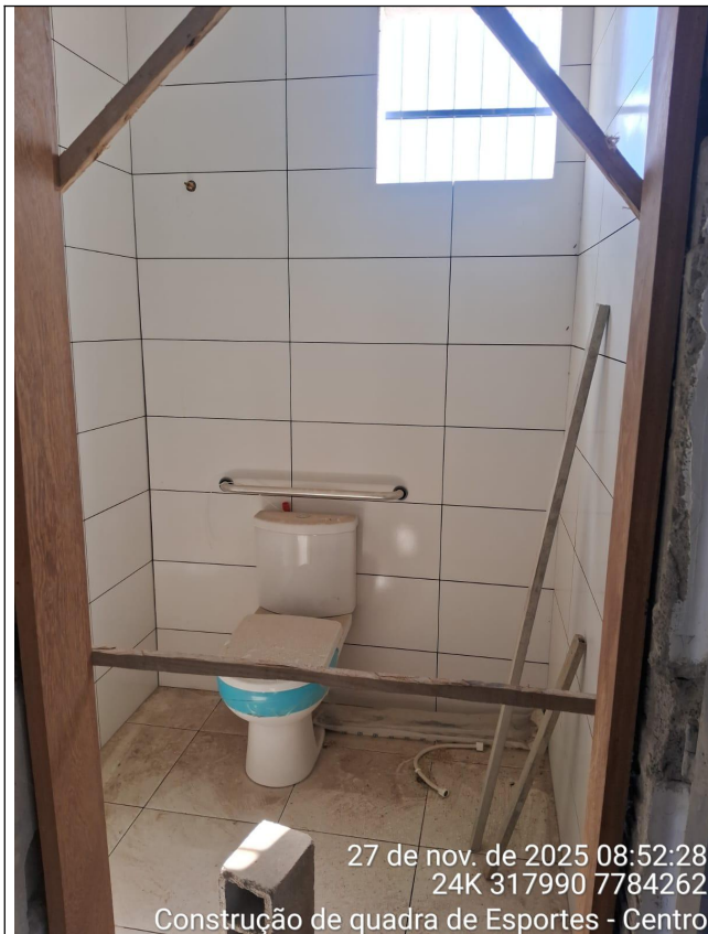
Situação atual do Banheiro Masculino PNE.