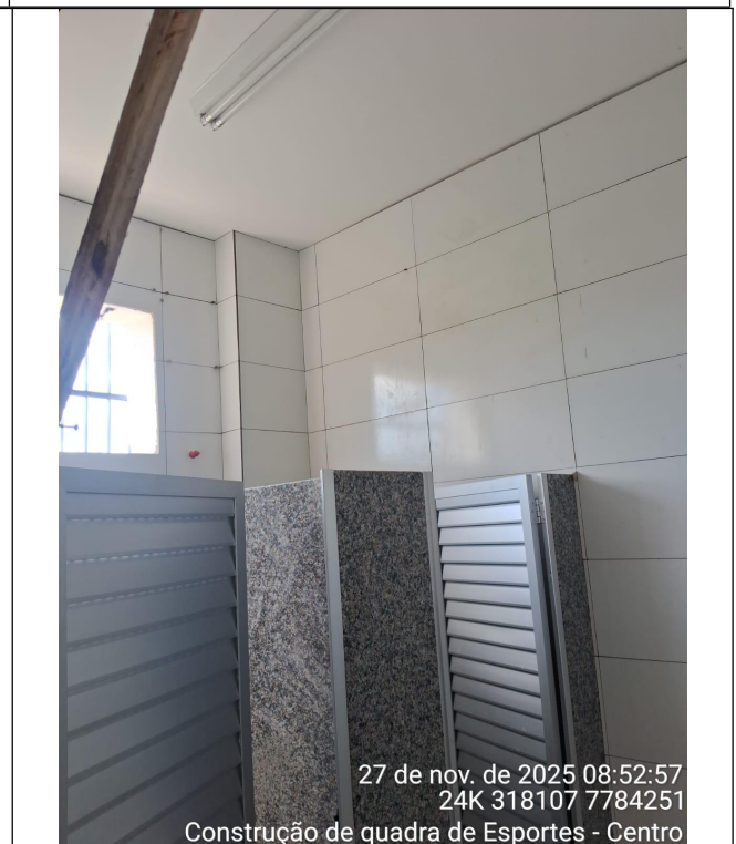
Guarda corpo de tubo de ferro galvanizado e Lastro de Concreto