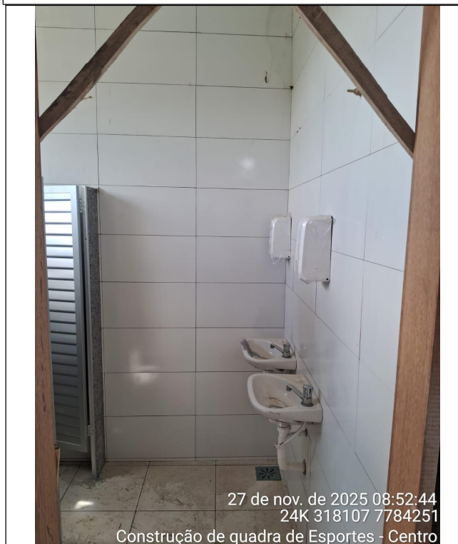
Situação atual do Banheiro Feminino PNE.