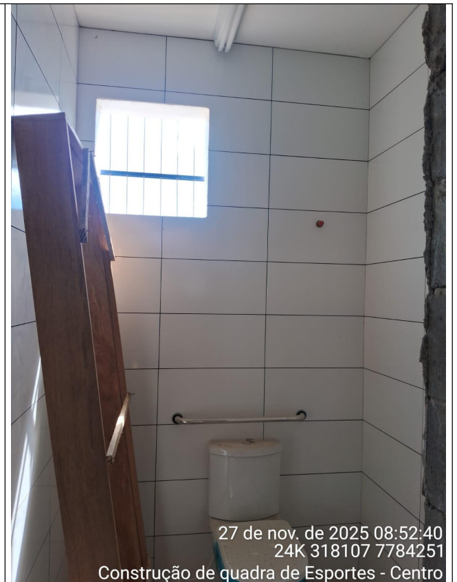
Situação atual do Banheiro Feminino PNE.