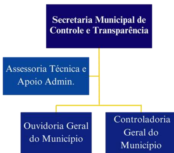
Organograma 1: Estrutura da SECONT

Durante o exercício de 2025, a SECONT contou com o Secretário, a Controladora Geral do Município e Ouvidora Geral do Município, além de uma Auditora Interna da especialidade de Engenharia e uma Agente de Ouvidoria nomeadas a partir do Concurso Público nº 001/2024.