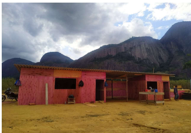
Foto 3 - Instalações provisórias de almoxarifado e escritório