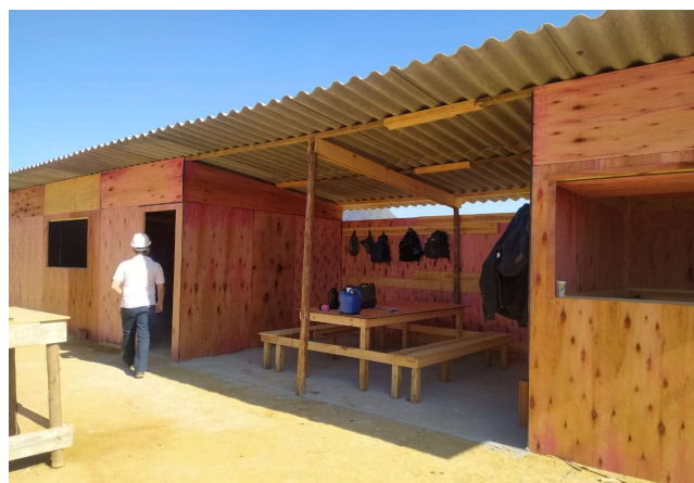
Foto 4 - Instalações provisórias de almoxarifado e escritório