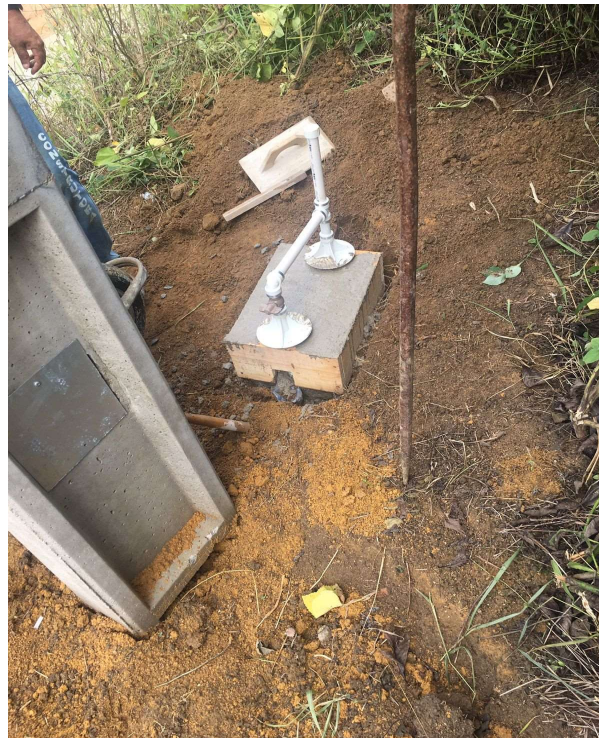
Foto 2 - Rede de água, com padrão de entrada d'água diâm. 3/4", conf. espec. CESAN.