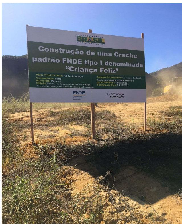
Foto 5 - Instalação de Placa de Obras