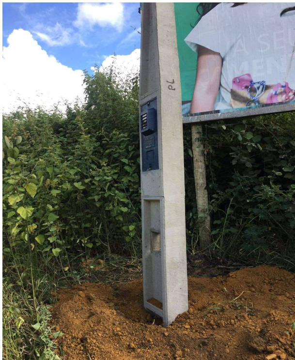
Foto 1 - Rede de luz, incl. padrão entrada de energia trifás.

CRECHE "CRIANÇA FELIZ", PANCAS/ES RELATÓRIO FOTOGRÁFICO - 1ª Medição