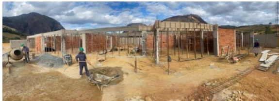
Foto 01 - Detalhes de paredes de alvenaria, e vigas e pilares após desforma.