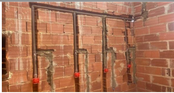
Foto 30 - Válvula de descarga 1.1/2" e registro de gaveta 2" instalados, no banheiro sanitário infantil 3 e 4 do Bloco B.