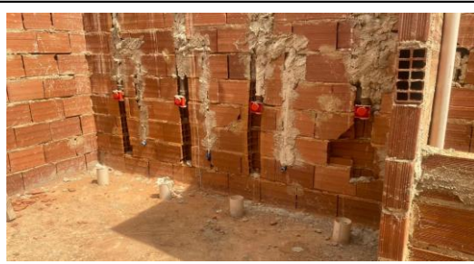
Foto 38 - Pontos de instalação sanitária e hidráulica, no sanitário infantil do bloco B. Detalhe de válvula de descarga 1.1/2" .