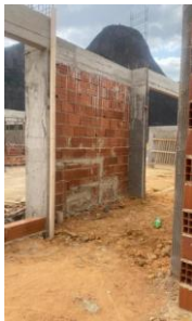
Foto 31 - Pontos de instalação sanitária e hidráulica, no solário do bloco B