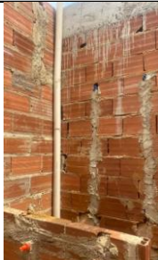
Foto 37 - Pontos de instalação sanitária e hidráulica, no sanitário infantil do bloco B. Detalhe de registro de gaveta 3/4" e tubo de ventilação e ponto de chuveiro.