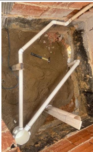
Foto 23 - Execução dos pontos de esgotos no banheiro dos professores feminino e masculino do Bloco B.