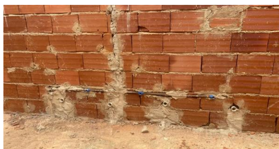
Foto 34 - Pontos de instalação sanitária e hidráulica, no sanitário infantil do bloco B