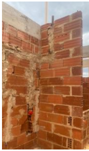
Foto 39 - Pontos de instalação sanitária e hidráulica, no sanitário infantil do bloco B. Detalhes de válvula de descarga 1.1/2" e registro de gaveta 2".