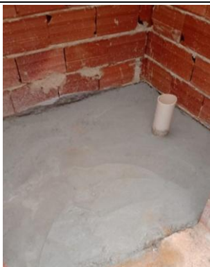
Foto 21 - Contrapiso em sanitário dos professores feminino e masculino no bloco B.