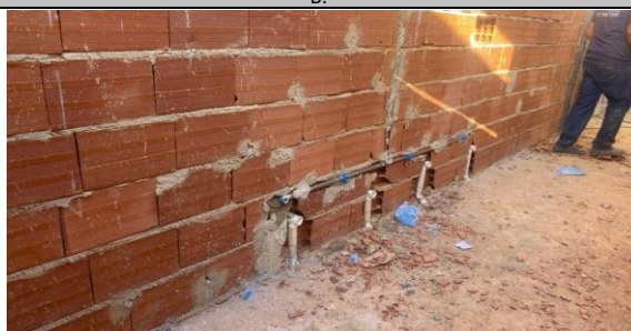
Foto 28 - Execução dos pontos de água fria e respectivos esgotos, no banheiro sanitário infantil 3 e 4 do Bloco B.