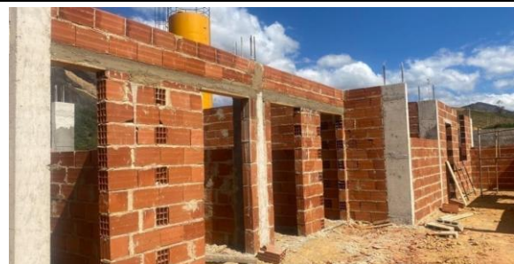
Foto 07 - Vergas executadas nos vãos das portas.