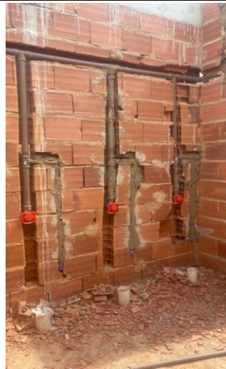
Foto 24 - Execução dos pontos de água fria e respectivos esgotos, válvula de descarga 1.1/2" instalados, no banheiro sanitário infantil 3 e 4 do Bloco B.