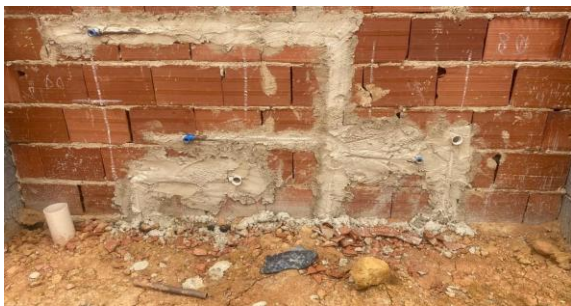
Foto 33 - Pontos de instalação sanitária e hidráulica, no solário do bloco B