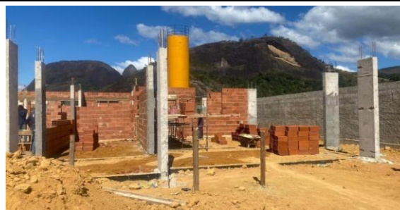
Foto 08 - Execução da alvenaria do Bloco A.