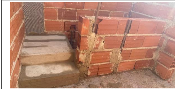
Foto 29 - Execução de muretas, no banheiro sanitário infantil 3 e 4 do Bloco B.