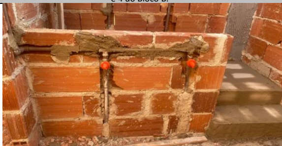
Foto 27 - Registro de gaveta 3/4" instalados no banheiro sanitário infantil 3 e 4 do Bloco B.