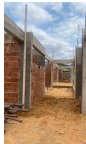
Foto 32 - Pontos de instalação sanitária, no solário do bloco B