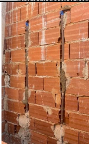
Foto 25 - Execução dos pontos de água fria, no banheiro sanitário infantil 3 e 4 do Bloco B.