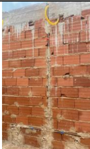
Foto 35 - Pontos de instalação sanitária e hidráulica, no sanitário infantil do bloco B. Detalhe de registro de gaveta 3/4".