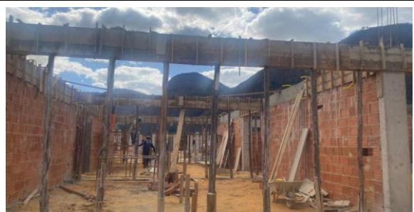
Foto 05 - Detalhes de formas de vigas.