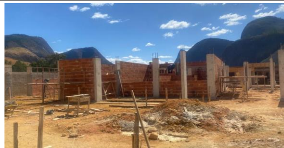
Foto 12 - Detalhes de após desformas de vigas, e paredes de alvenaria.