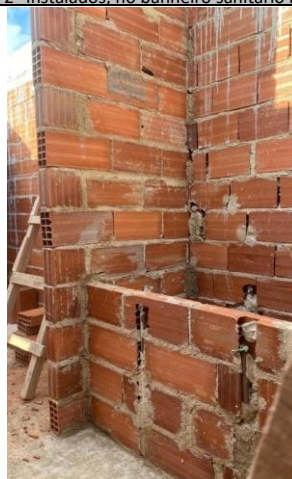
Foto 26 - Execução de muretas, no banheiro sanitário infantil 3 e 4 do Bloco B.