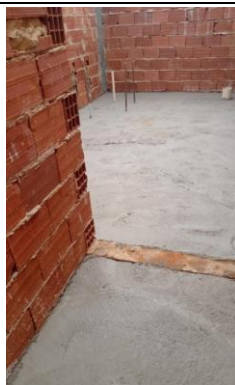
Foto 22 - Contrapiso em sanitários infantil 3 e 4 no bloco B.