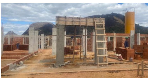
Foto 04 - Detalhes de formas de vigas.