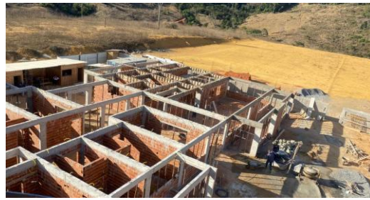
Foto 40 - Detalhes de após desformas de vigas, e paredes de alvenaria do bloco A.