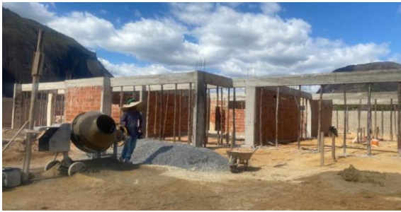
Foto 10 - Detalhes de após desformas de vigas, e paredes de alvenaria.