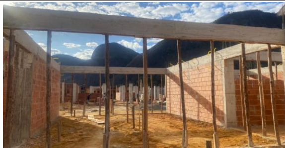
Foto 11 - Detalhes de após desformas de vigas, e paredes de alvenaria.