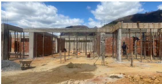
Foto 02 - Detalhes de paredes de alvenaria, e vigas e pilares após desforma.