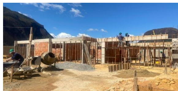
Foto 03 - Detalhes de formas de vigas, e paredes de alvenaria.