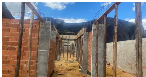
Foto 06 - Formas de fundo de vigas e suas respectivas armaduras sendo instaladas. E detalhes de paredes de alvenaria.