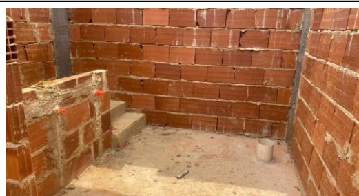
Foto 36 - Pontos de instalação sanitária e hidráulica, no sanitário infantil do bloco B. Detalhe de registro de gaveta 3/4".