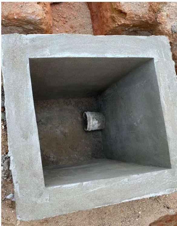
DRENAGEM - CAIXA ENTERRADA HIDRÁULICA RETANGULAR EM ALVENARIA