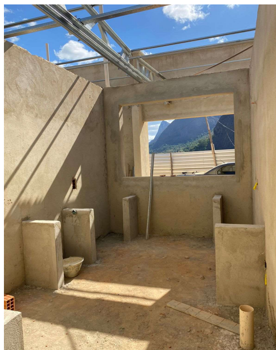
ALVENARIA DE VEDAÇÃO DE BLOCOS CERÂMICOS FURADOS NA VERTICAL DE 9X19X39CM (ESPESSURA 9CM) DE PAREDES COM ÁREA LÍQUIDA MENOR QUE 6M² SEM VÃOS E ARGAMASSA DE ASSENTAMENTO COM PREPARO EM BETONEIRA. AF_06/2014