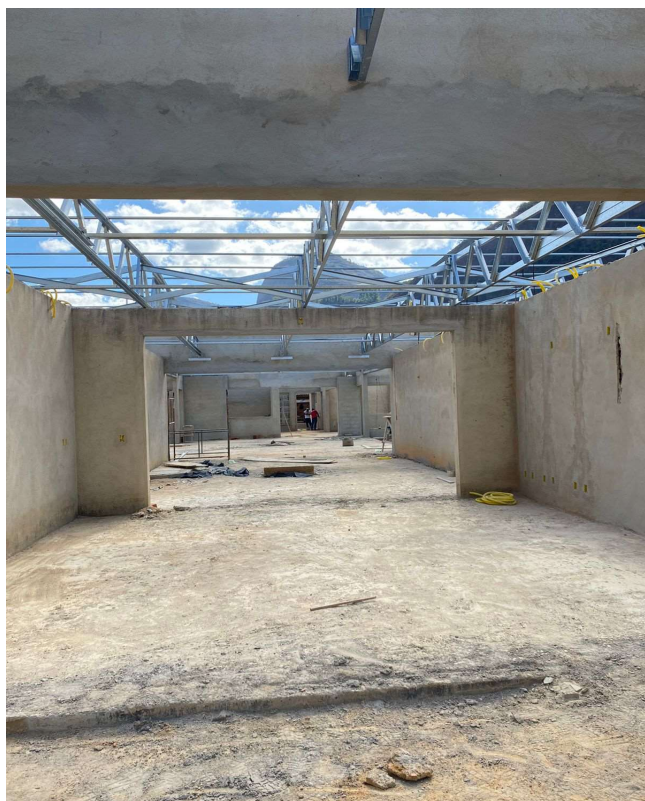
PISO EM CONCRETO 20 MPA PREPARO MECÂNICO, ESPESSURA 7CM. AF_09/2020