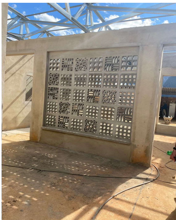
Cobogó de concreto 40 x 40 x 10 cm, tipo reto, assentados com argamassa de cimento e areia no traço 1:3, espessuras juntas 15 mm