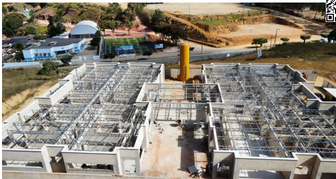
Estrutura steel frame metalica em tesouras (1451,75m²)