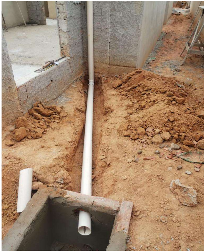
Drenagem de águas pluviais