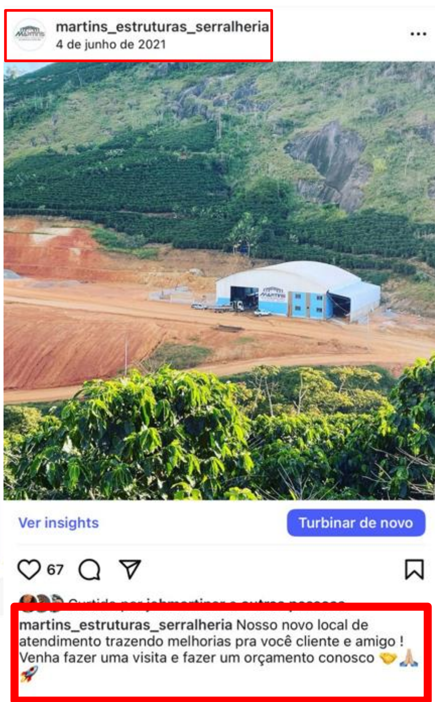
Foto 04: Print da galeria da rede social (Instagram) da empresa D R MARTINS PIRAI MÁQUINAS representando a edificação objeto do Atestado.

Destaque para a data da postagem (Data em que representa o mês de conclusão da obra devidamente explícito no atestado) e principalmente a legenda da empresa, deixando claro ser a nova sede da empresa.