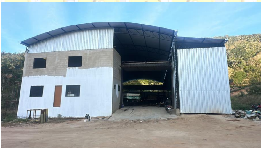
Foto 01: Fachada frontal da nova sede da empresa ainda em fase de acabamento

O galpão executado e objeto do atestado foi construído para ser a nova sede da empresa D R MARTINS PIRAI MÁQUINAS, obra construída no ano de 2021, na localidade de Córrego Jacutinga, Zona Rural do Município de Brejetuba, conforme constam o endereço explícito na ART e no Atestado. No entanto, por motivos únicos e exclusivos dos proprietários a empresa D R MARTINS PIRAI MÁQUINAS mudou o endereço de sua Sede, passando a ser na localidade de Vargem Grande, Zona Rural, também no Município de Brejetuba. A busca feita pela Recorrente por meio do google street view mostra um local aproximado da nova sede localizada na localidade de Vargem Grande, o que por falta de atualização no referido site não é possível identificar a nova sede da empresa, tanto que o print apresentado pela Recorrente mostra apenas uma cobertura de um despulpador de café de uma propriedade rural. Mas que, para fins de comprovação, apresentamos abaixo fotos retiradas no dia 04/08/2025 da nova sede da empresa com aproximadamente 1.000,00 m 2 (um mil metros quadrados).