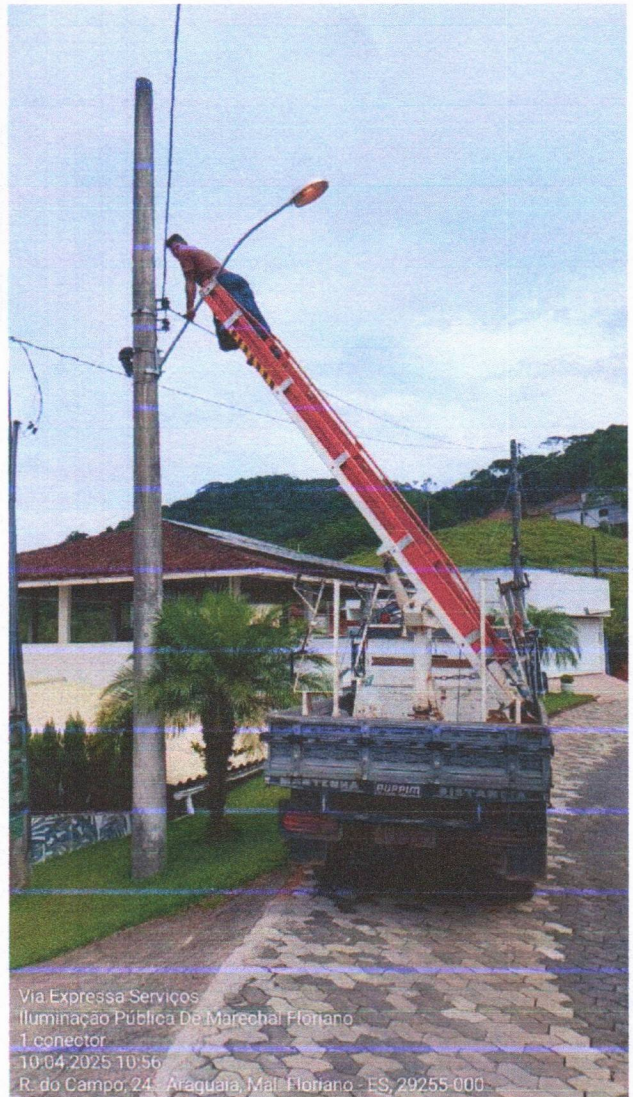
Via Expressa Serviços Iluminação Pública De Marechal Floriano 1. conector 10/04/2025 10:56 R. do Campo, 24 - Araguaia, Mal. Floriano - ES, 29255-000