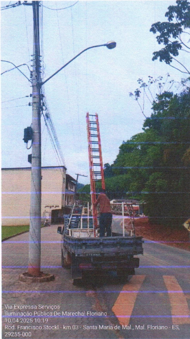
Via Expressa Serviços Iluminação Pública De Marechal Floriano 10.04.2025 10:19 Rod. Francisco Stockl - km 03 - Santa Maria de Mal., Mal. Floriano - ES, 29255-000