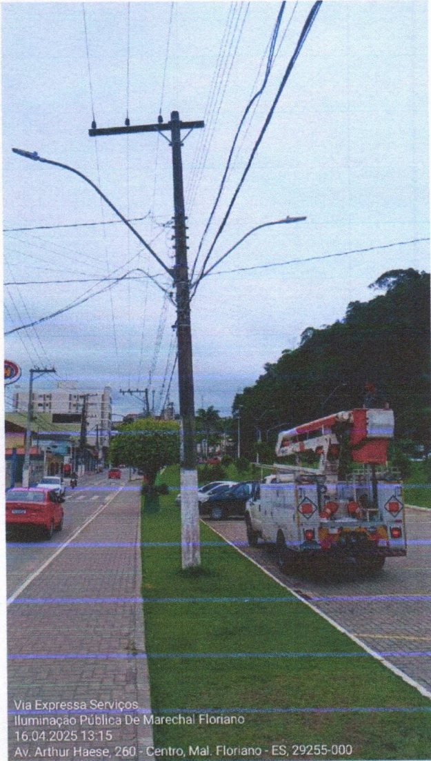
Via Expressa Serviços Iluminação Pública De Marechal Floriano 16.04.2025 13:15 Av. Arthur Haese, 260 - Centro, Mal. Floriano - ES, 29255-000