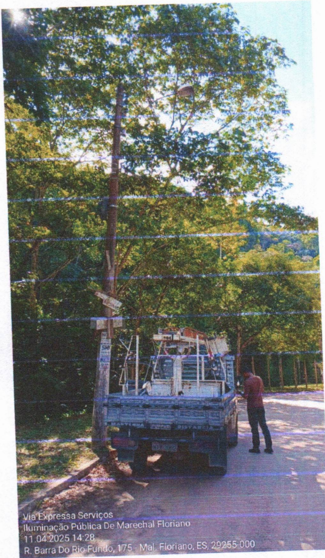
Via Expressa Serviços Iluminação Pública De Marechal Floriano 11.04.2025 14:28 R. Barra Do Rio Fundo, 175 - Mal. Floriano, ES, 29255-000