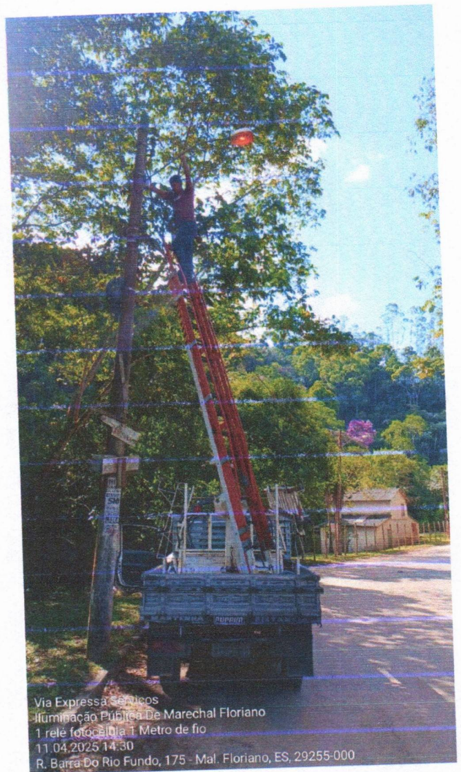
Via Expressa Serviços Iluminação Pública De Marechal Floriano 1 relé fotocâmera 1 Metro de fio 11.04.2025 14:30 R. Barra Do Rio Fundo, 175 - Mal. Floriano, ES, 29255-000