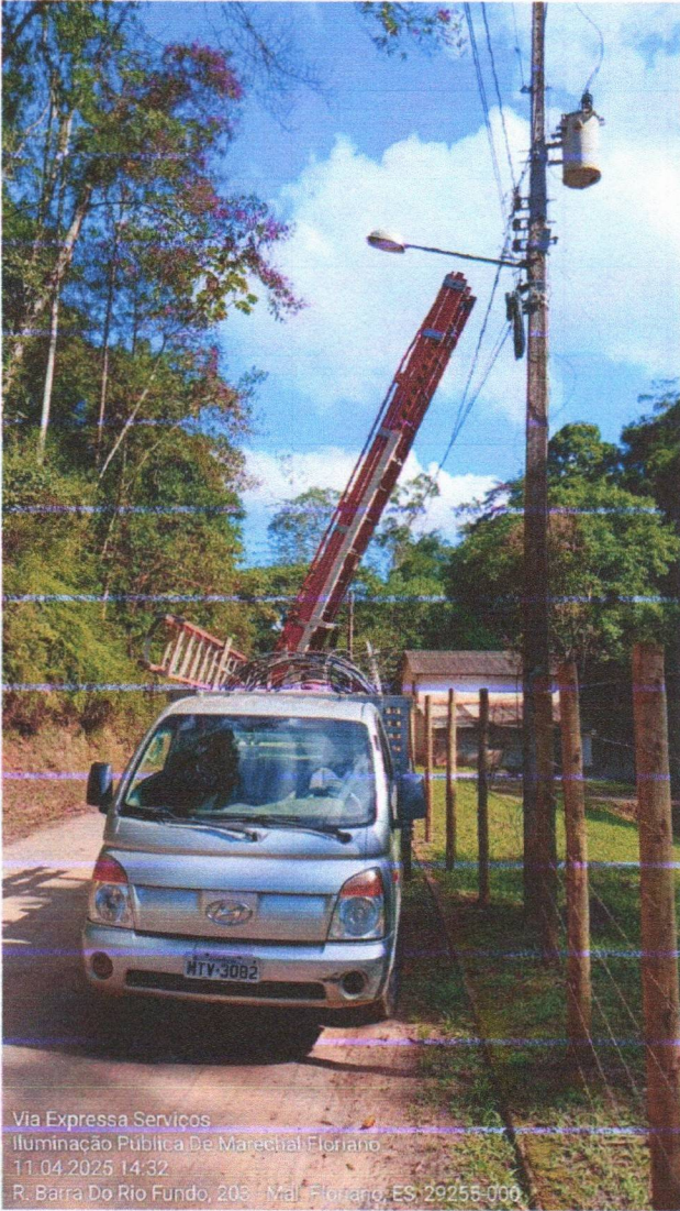
Via Expressa Serviços Iluminação Pública De Marechal Floriano 11.04.2025 14:32 R. Barra Do Rio Fundo, 203 - Mal. Floriano, ES, 29255-000