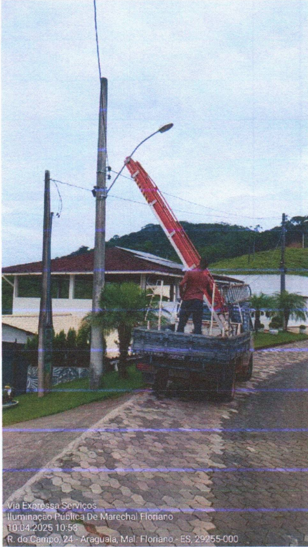
Via Expressa Serviços Iluminação Pública De Marechal Floriano 10/04/2025 10:53 R. do Campo, 24 - Araguaia, Mal. Floriano - ES, 29255-000