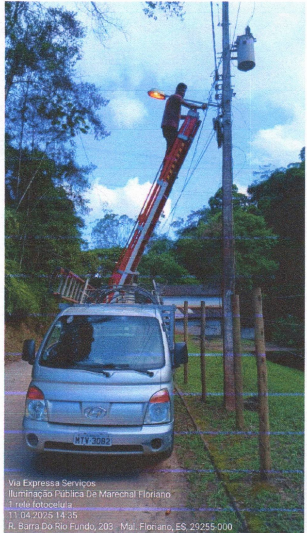
Via Expressa Serviços Iluminação Pública De Marechal Floriano 1 relé fotocelula 11.04.2025 14:35 R. Barra Do Rio Fundo, 203 - Mal. Floriano, ES, 29255-000