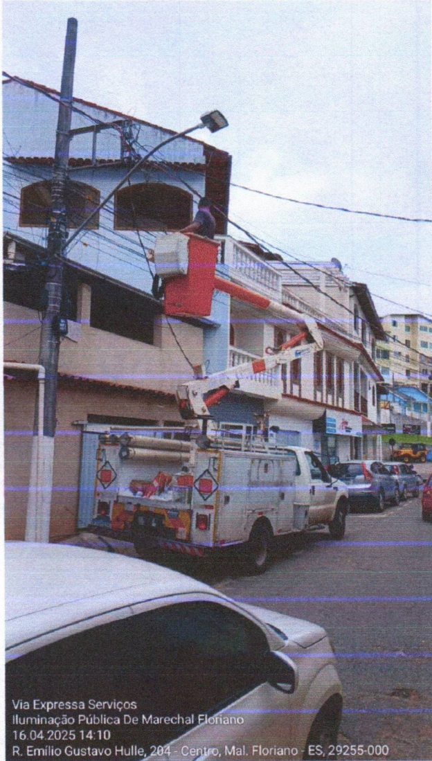
Via Expressa Serviços Iluminação Pública De Marechal Floriano 16.04.2025 14:10 R. Emílio Gustavo Hulle, 204 - Centro, Mal. Floriano - ES, 29255-000