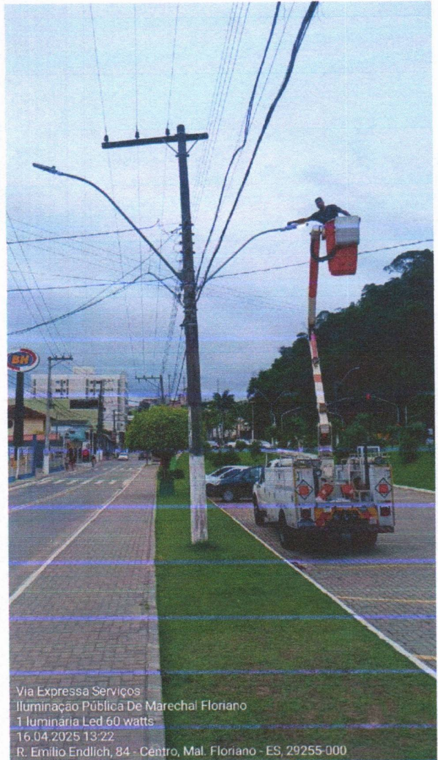
Via Expressa Serviços Iluminação Pública De Marechal Floriano 1 luminária Led 60 watts 16.04.2025 13:22 R. Emilio Endlich, 84 - Centro, Mal. Floriano - ES, 29255-000