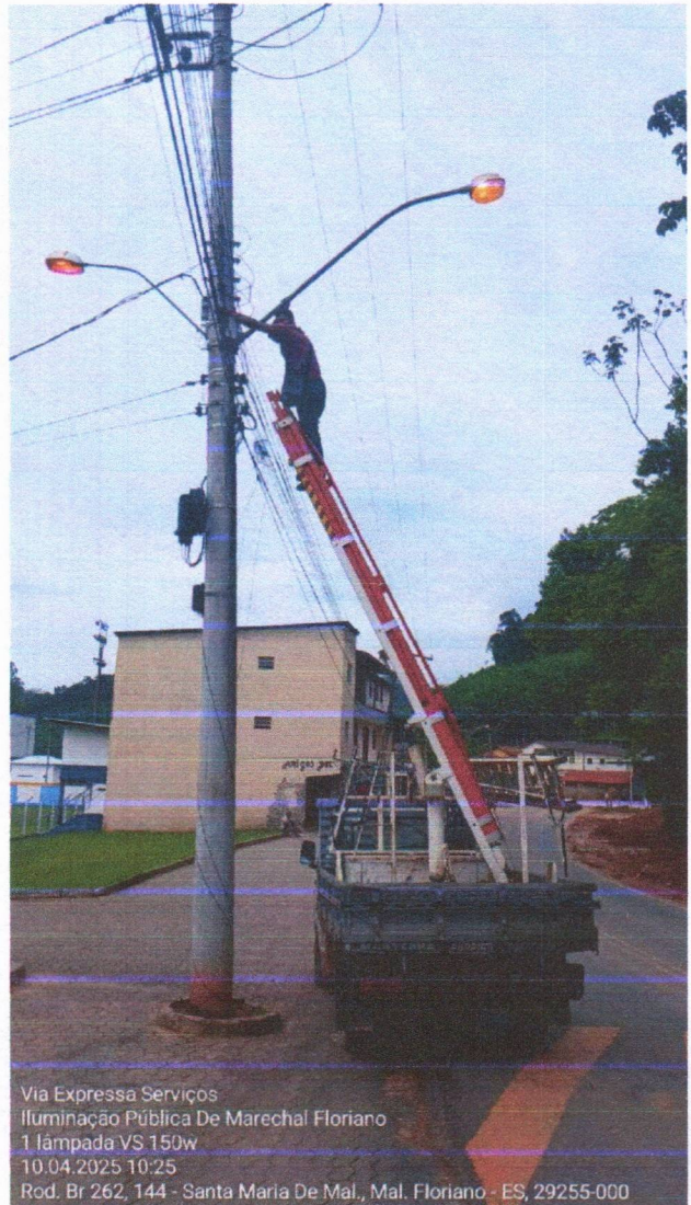
Via Expressa Serviços Iluminação Pública De Marechal Floriano 1 lâmpada VS 150w 10.04.2025 10:25 Rod. Br 262, 144 - Santa Maria De Mal., Mal. Floriano - ES, 29255-000