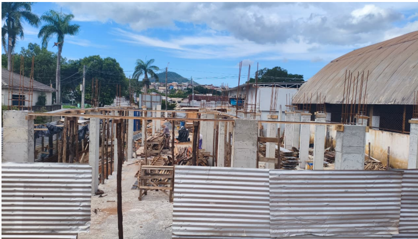
Foto da obra em andamento sede do CREAS

A obra foi iniciada em dezembro de 2025 e possui previsão de conclusão para novembro de 2026.