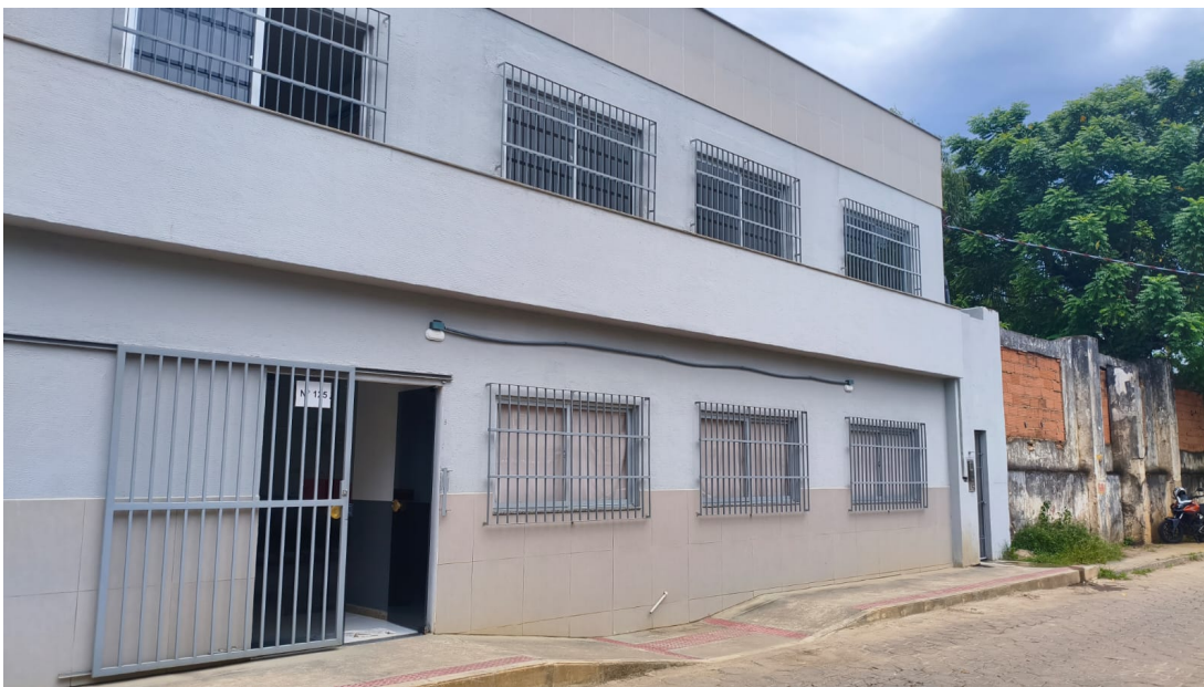
Foto da sede reformada da SEMTADES

Com a conclusão da reforma, no ano de 2025, os servidores retornaram às atividades na sede própria, agora reestruturada para oferecer melhores condições de trabalho e atendimento ao público.