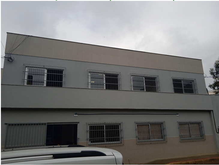
Foto da sede do Conselho Tutelar