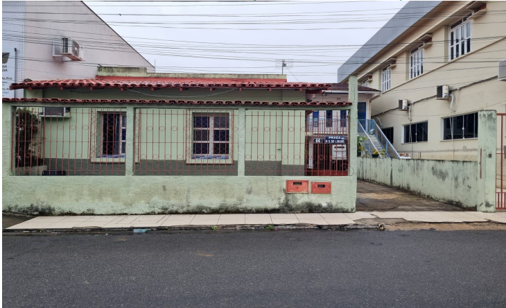
Foto atual da sede alugada do CREAS

A obra foi iniciada em dezembro de 2025 e possui previsão de conclusão para novembro de 2026.