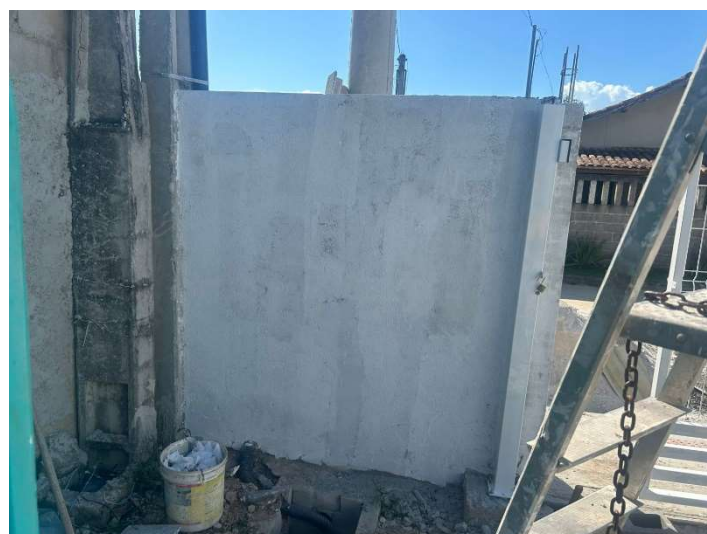
Aplicação do selador acrílico.