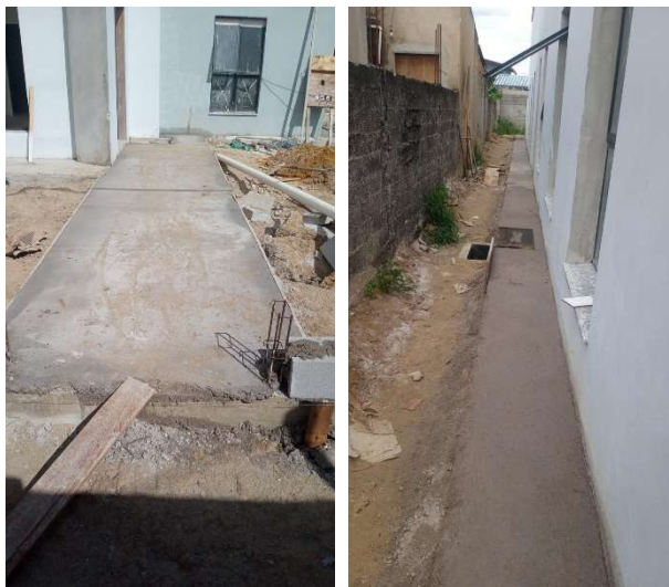
Execução dos passeios internos.