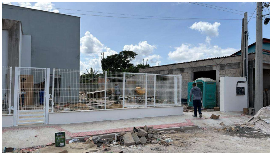
Vista frontal da obra com serviços executados.