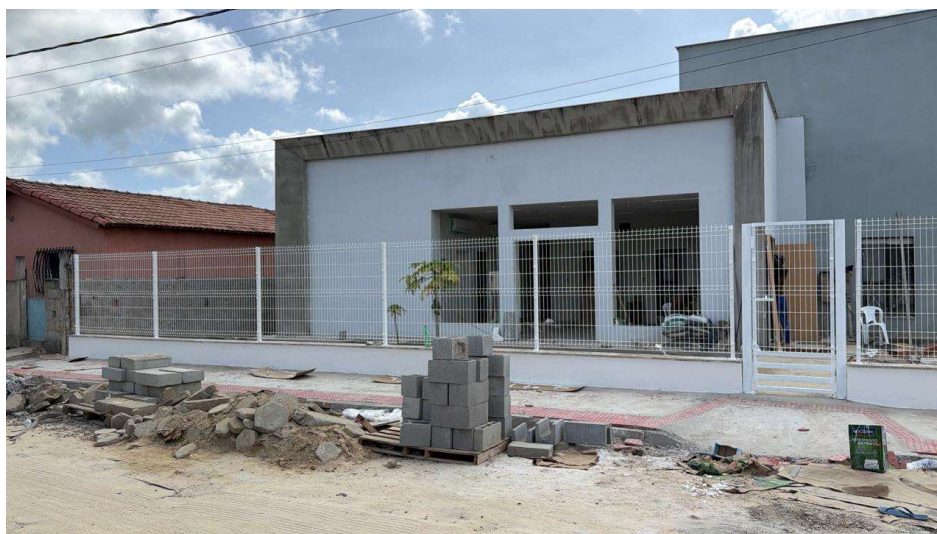
Vista frontal da obra com serviços executados.