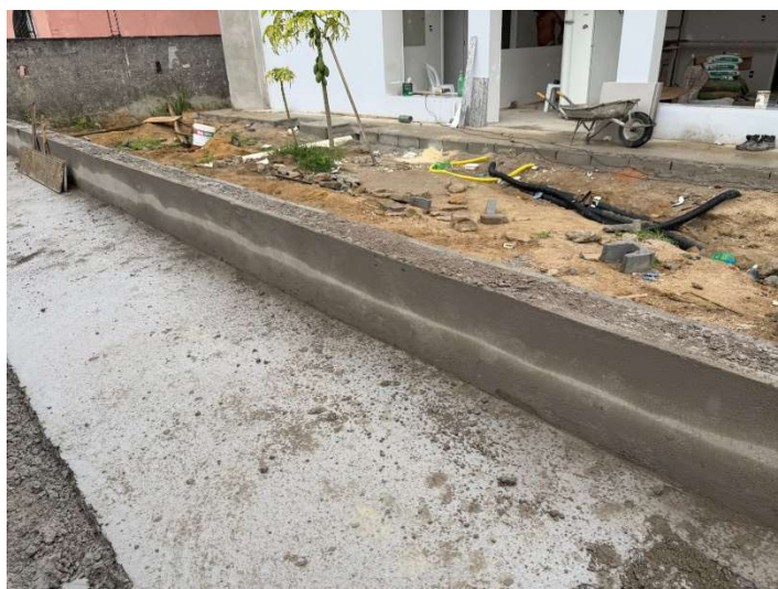
Reboco da mureta do gradil.