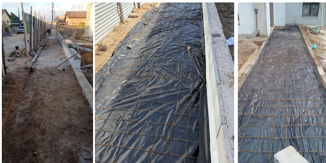
Preparação da base para concretagem da calçada e passeio da entrada da edificação.