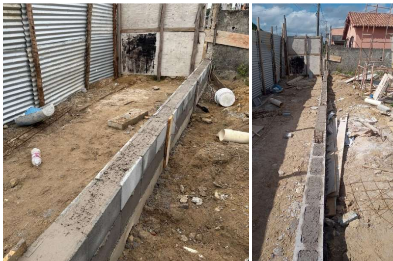
Execução do bloco estrutural de 20cm cheio para mureta do gradil.