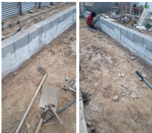
Impermeabilização da base.