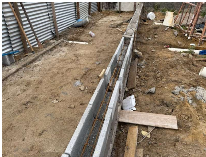
Execução do bloco estrutural de 20cm cheio para mureta do gradil.