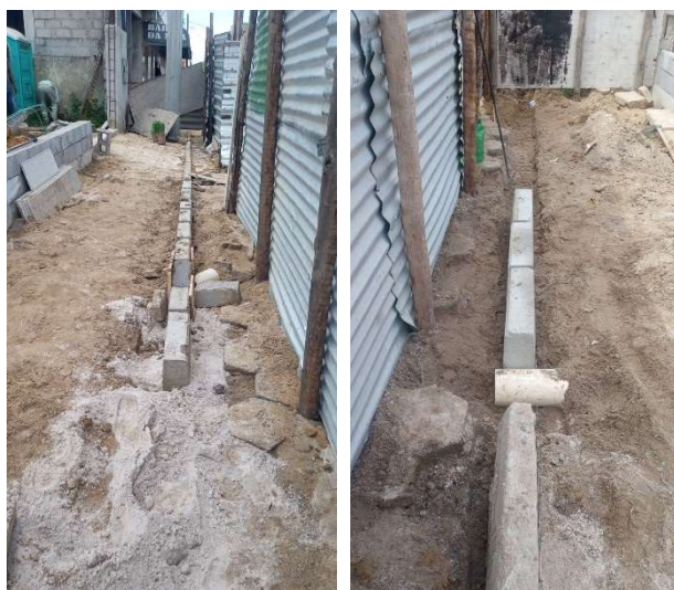
Assentamento de meio fio da calçada.