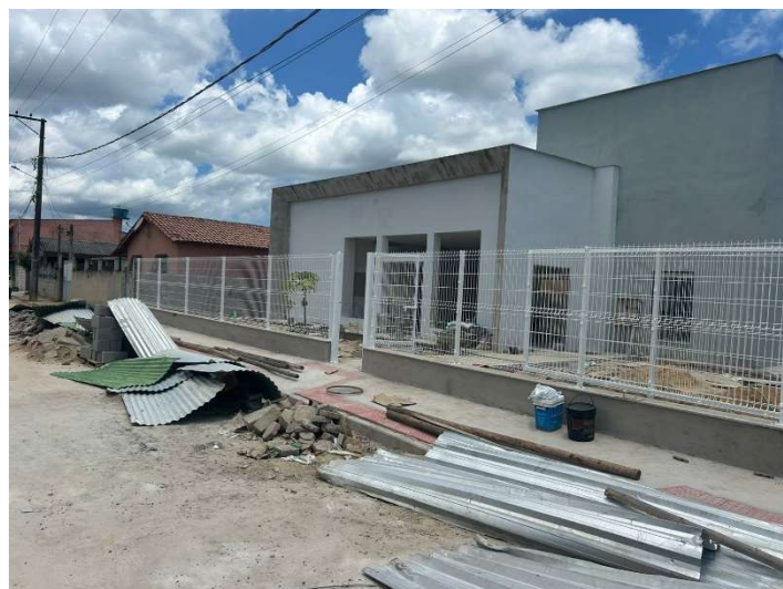
Retirada de tapume e materiais.