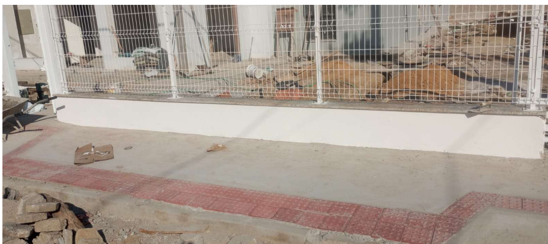
Assentamento de ladrilho em calçada.