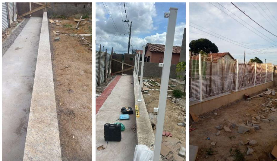
Assentamento de chapim e instalação de gradil.