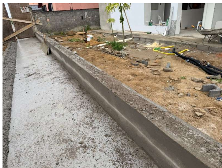
Reboco da mureta do gradil.