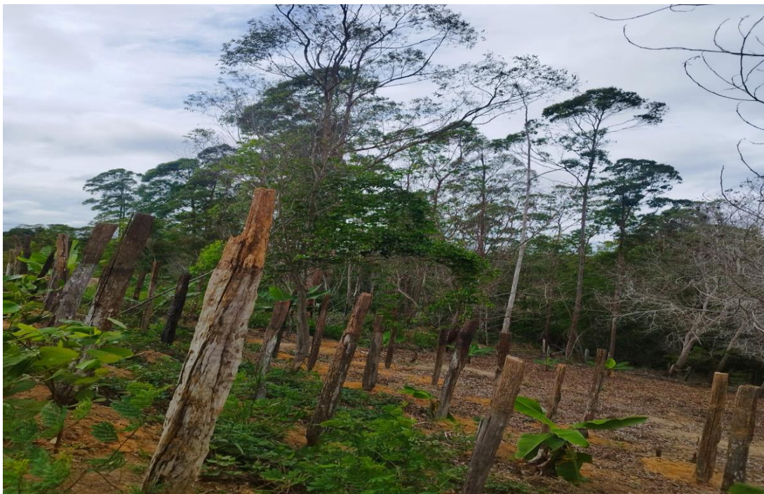
Foto 01 a 08: Manejo de cultura de pimenta do reino em área de APP